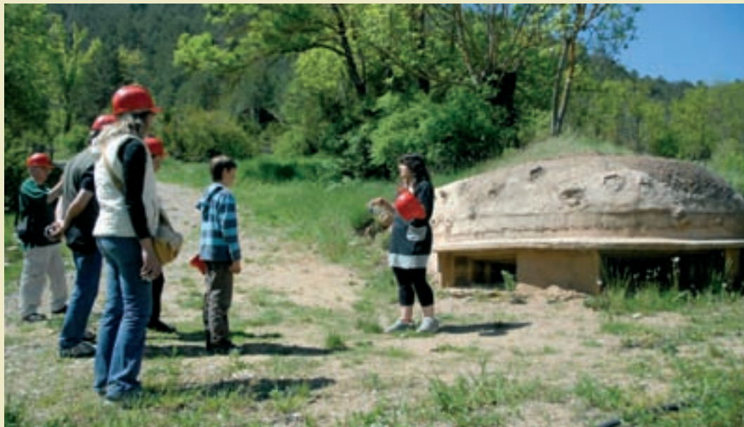
Imatges de la visita comentada i del Centre d'Interpretació del Parc dels búnquers de Martinet i Montellà.

El visitant inicia l'experiència al Centre d'Interpretació amb el visionat d'uns documentals que permeten contextualitzar la visita, i a continuació fa un recorregut que li permet endinsar-se —amb llanternes, perquè hom creua passadissos molt foscos— en diverses fortificacions (búnquers d'infanteria i d'artilleria, amb punts de combat per a fusellers, nius de metralladores, plataformes per a morters, polvorins,