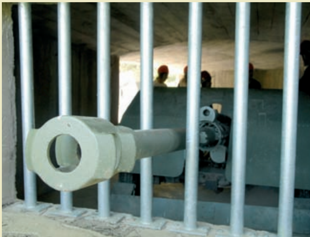
L'itinerari pel parc permet conèixer les construccions defensives per dins i per fora i té com a al·licient extra els relaxants paisatges de la Cerdanya.