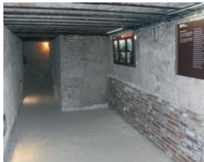
Fotos superiors: restes de l'aeròdrom militar de l'Aranyó (la Segarra) i del refugi antiaeri d'Agramunt (l'Urgell). A sota, Cervera (la Segarra), on trobem abundosos records del conflicte.