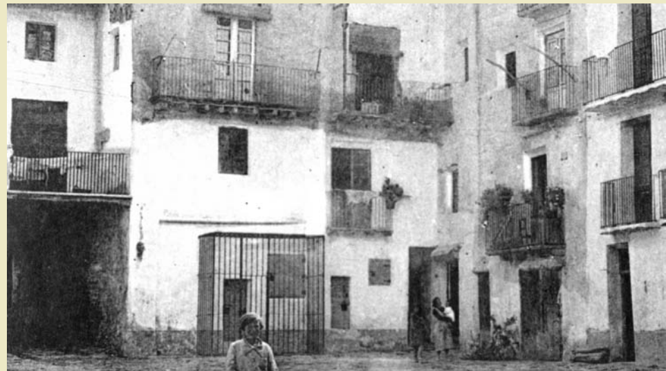
Imatges actuals i foto històrica de la recuperada presó-museu Camí de la Llibertat de Sort, centre de detenció dels evadits que creuaven el Pirineu.