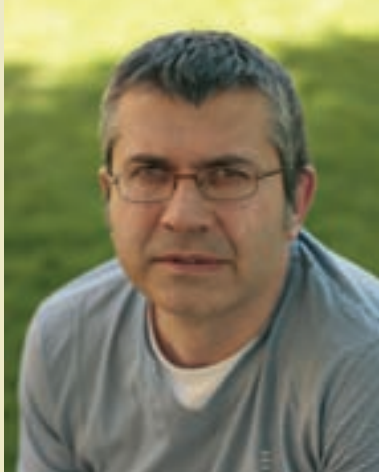
Josep Calvet Memorial Democràtic Generalitat de Catalunya