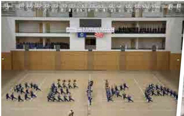
〈第33回 九州マーチングコンテスト〉