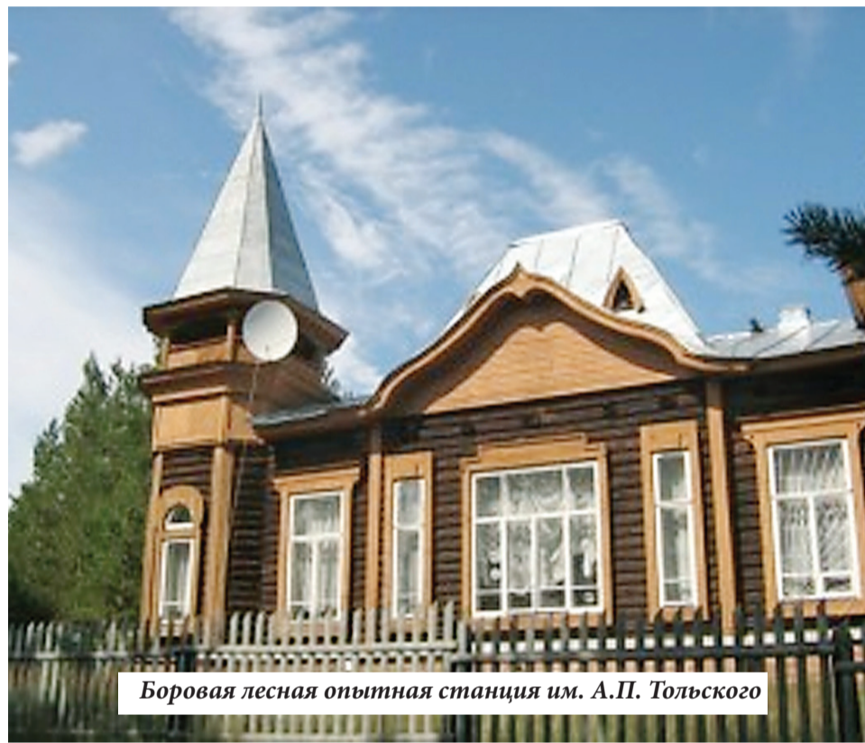
Боровая лесная опытная станция им. А.П. Тольского

В 1793 году было проведено генеральное отмежевание бора. Общая площадь обмежеванной лесной дачи «Бузулукский бор» составила 54 тыс. га. Во многих местах эта площадь была ограничена от помещичьих земель глубокой канавой, препятствующей заезду в лес даже на гужевом транспорте. Самое интенсивное изучение Бузулукского бора отечественными лесоводами и ботаниками началось в начале XX века такими учеными, как Г. Н. Высоцкий (1909 г.) В.Н.