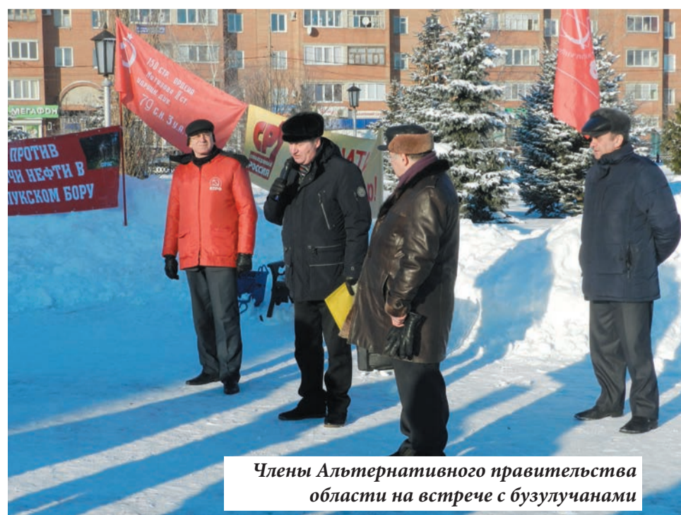
Члены Альтернативного правительства области на встрече с бузулучанами