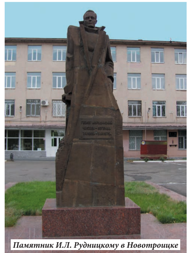
Памятник И.Л. Рудницкому в Новотроицке

По материалам Новотроицкого краеведческого музея, очерки которого (см. №2 «Оренбургской правды») о первооткрывателях мы будем публиковать и впредь