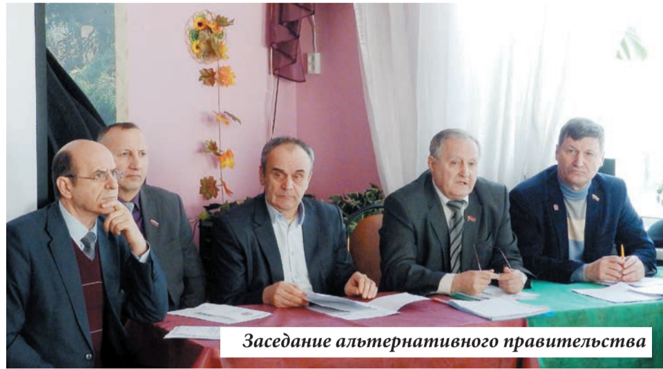
Заседание альтернативного правительства

В ходе дискуссии выяснился один нелицеприятный аспект для нынешних властей РФ: и докладчик, и выступающие не раз цитировали Постановление