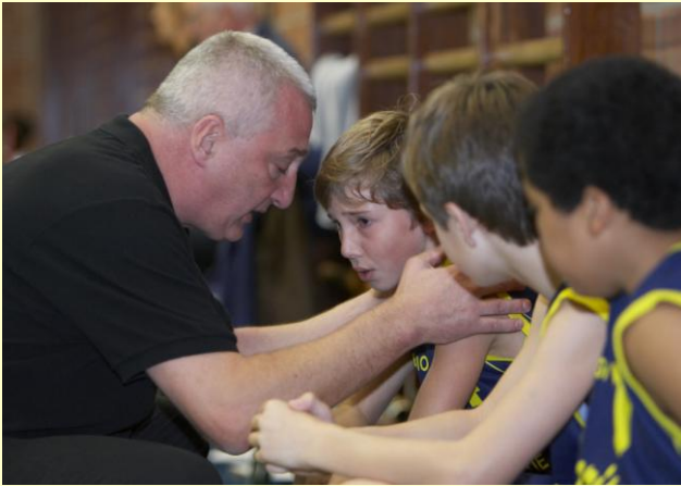
▲ Laureaat clubs Provincie Antwerpen Basketbalclub Eligio Deurne