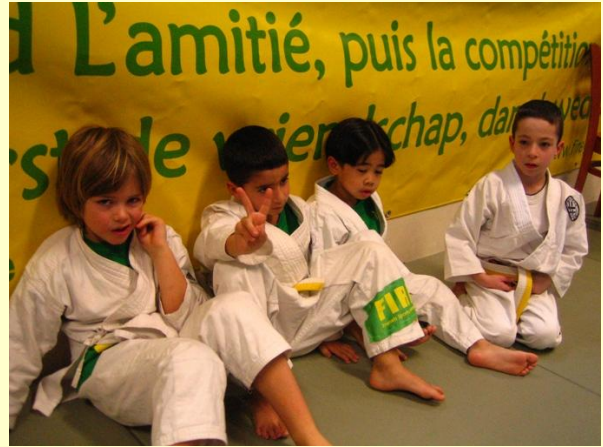
▲ Laureaat clubs Provincie Vlaams-Brabant & Brussels Hoofdstedelijk Gewest Brussels Brazilian Jiu Jitsu Academy (Eerst de vriendschap, dan de competitie)