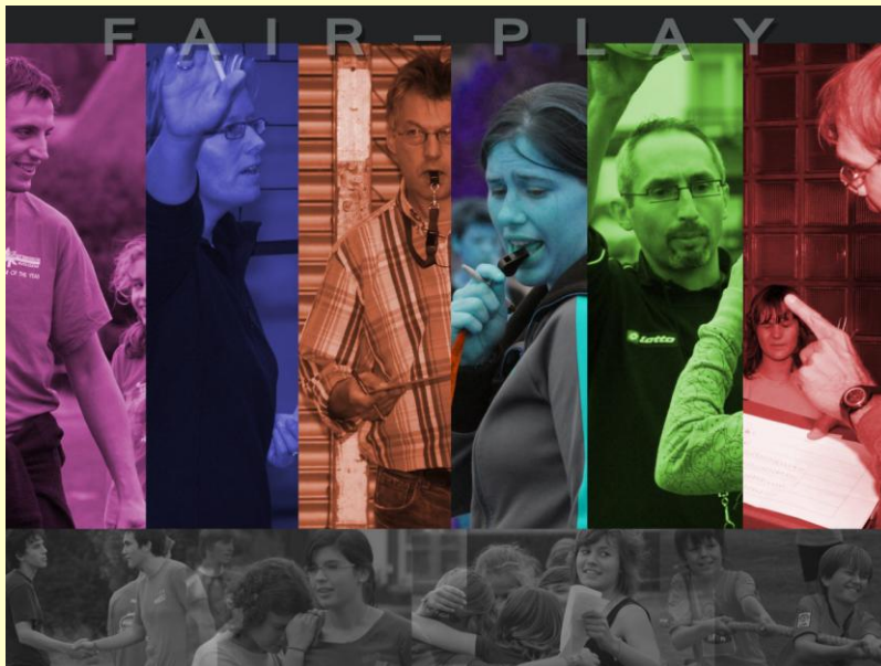
◀ Laureaat scholen 3 e jaar Sint-Jan Berchmanscollege Avelgem