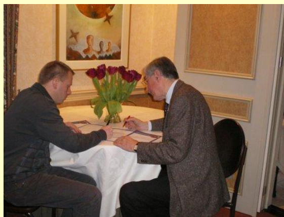
◀ Paul De Broe met Philippe Muyters, Vlaams Minister van Sport

- Panathlon Brussel was nauw betrokken bij de organisatie van het PANATHLON STIPENDIUM 2010 . De uitreiking van het Stipendium vond plaats op 17 juni 2010 in de topsporthal in Gent. (zie verder)