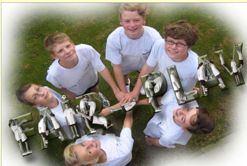
◀ 2e jaar: Sint-Jorisschool Geluwe (klas 2A6)