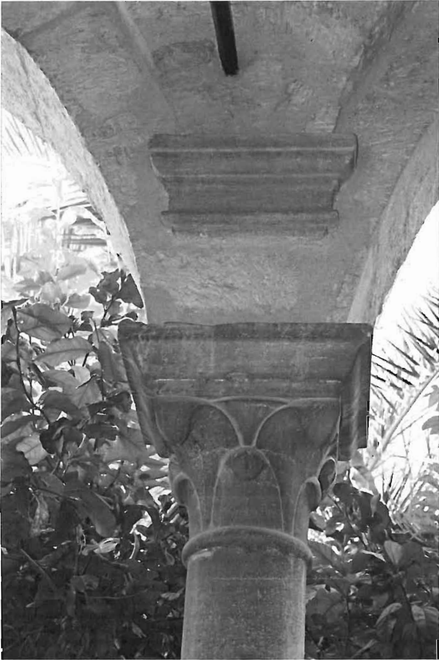
Fig. 5 - Alcamo. Convento di S. Maria di Gesù, colonna del chiostro e dettaglio del capitello