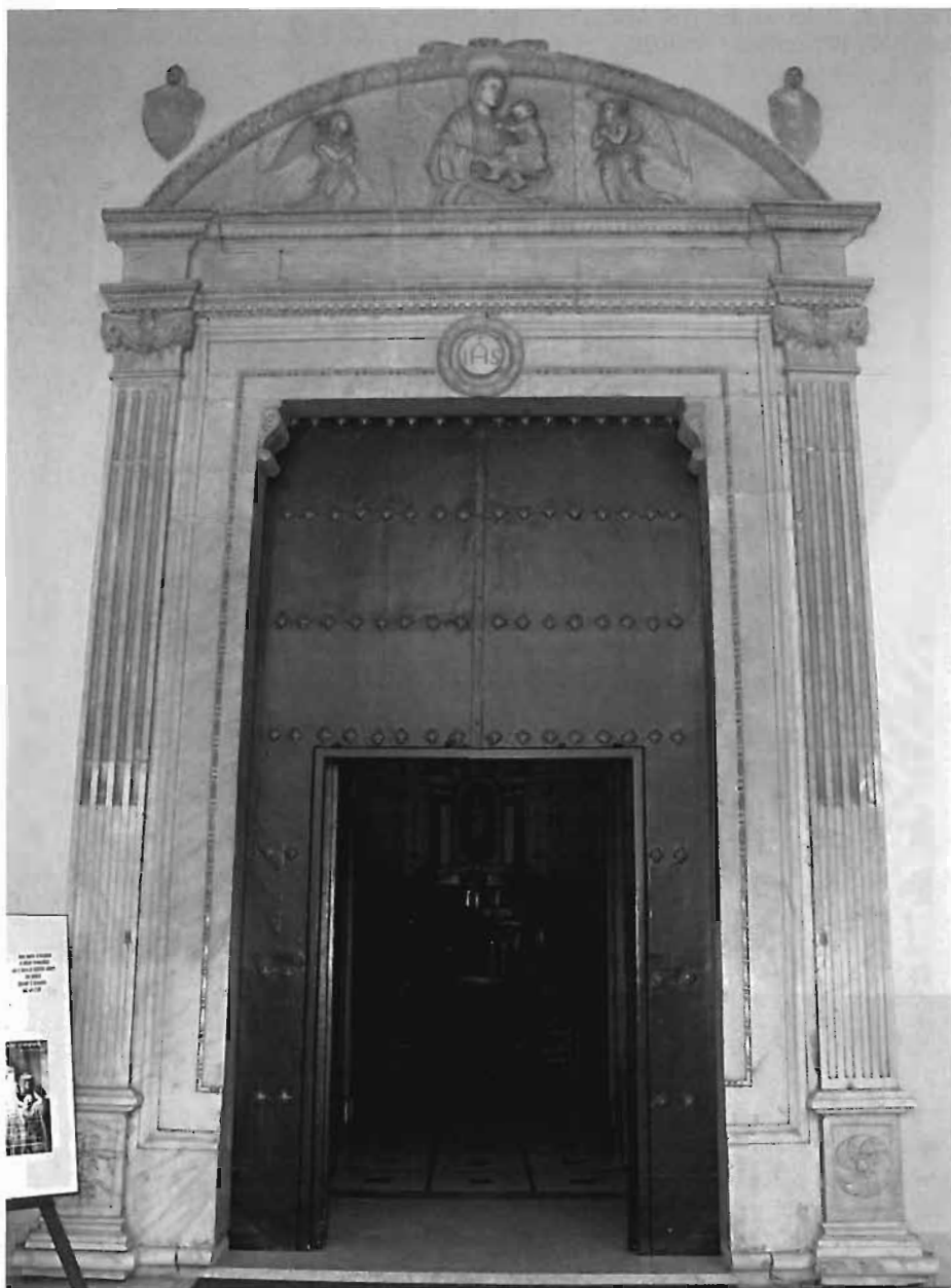
Fig. 8 - Alcamo. Chiesa di S. Maria di Gesù, portale (attribuito a Bartolomeo Berrettaro)