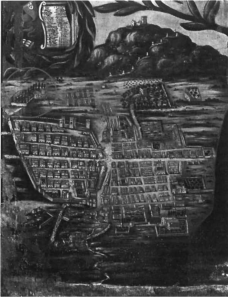
Fig. 1 - Dipinto della città di Alcamo (XVIII secolo) e dettaglio (da V. Regina, Alcamo e le sue opere d'arte , Torino 1984).