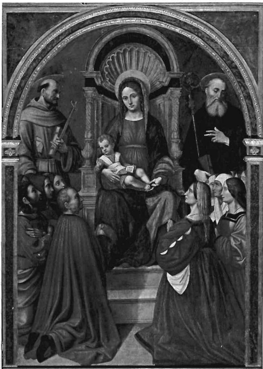
Fig. 2 - Alcamo. Chiesa di S. Maria di Gesù, dipinto della Madonna delle Grazie e dettaglio (da V. Regina, La chiesa parrocchiale , cit.)