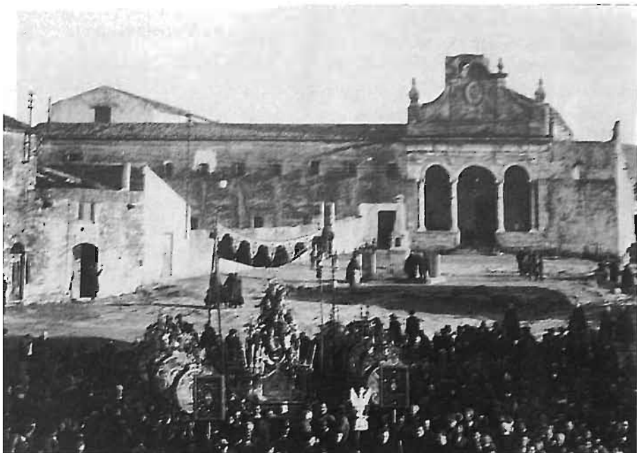
Fig. 3 - Alcamo. Convento di S. Maria di Gesù, foto del 1927 (da C. Cataldo, I giardini di Adone , cit.)