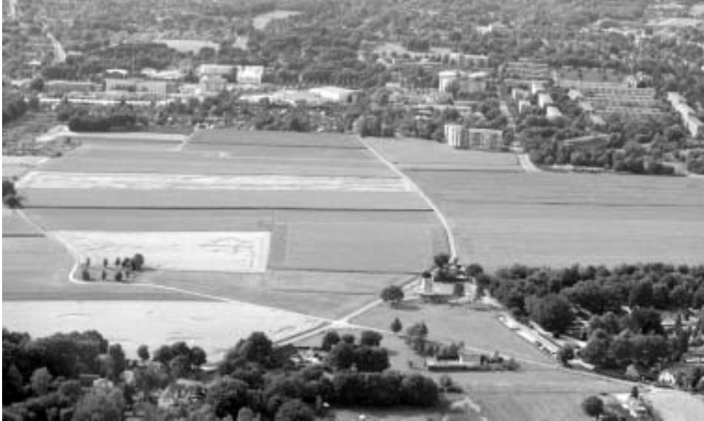
Afb. 1: Hier is de bebouwing aan de westelijke grens van de Zuidelijke Eng met de ontsierende flatbebouwing aan de rand en de in 2008 in gebruik genomen nieuwe molen te zien.

De stuwwallen, waaronder De Eng, waren aanvankelijk voor het grootste deel nog woeste gronden , waarvan de hogere delen geleidelijk aan zijn ontgonnen voor bouwland. Wanneer dat precies op de Soester Eng is gestart, weten we niet. De eerste schriftelijke berichten over boerennederzettingen hebben voor het grondgebied van Soest betrekking op Oud Hees en in relatie daarmee met de Hezer Eng (een gebied dat nu deel uitmaakt van de gemeente Zeist en bij Den Dolder in gebruik is als industrieterrein).