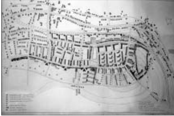
Afb. 4: Plannen tot bebouwing van de Eng uit de jaren dertig van de vorige eeuw.

materiaal oudere Soesters nog dierbare herinneringen hebben (afb. 3). In de loop van de 20 e eeuw veranderde echter het beeld drastisch. Door belangrijke wijzigingen in de structuur van de agrarische bedrijven heeft een omwenteling plaatsgevonden in de bewerking van de grond. Was vroeger het vee de leverancier van de grondstof voor het akkerland op de Eng, in de loop van de 20 e eeuw is de Eng de leverancier van het voedsel voor het vee geworden. De maïs heeft de golvende korenlanden verdreven en ook bijgedragen aan het verlies van openheid tijdens het zomerseizoen. En juist uit cultuurhistorisch oogpunt is openheid een essentieel kenmerk van de Eng. Bovendien was er tijdens de vorige eeuw opnieuw oorlogsgeweld waardoor de Eng werd aangetast.