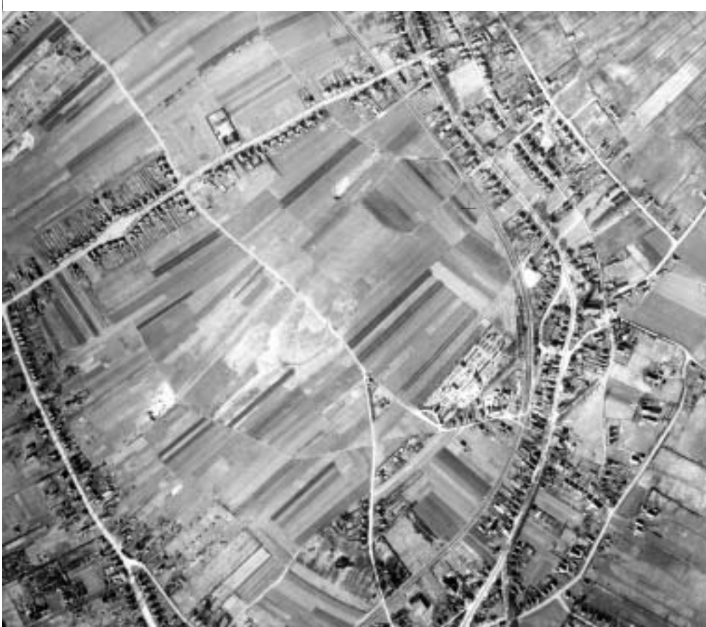
Luchtfoto Soester Eng 1947.

weg over de Eng ondermijnd. Met name de geplande aanleg van een nieuwe weg, waaraan het gemeentebestuur aanvankelijk hardnekkig vasthield, riep in toenemende mate verzet op. En datzelfde gold voor de geplande hoogbouw op de Eng. In 1973 werd de koers bijgesteld. Het plan tot de aanleg van een weg over De Eng werd ingetrokken evenals een uitbreidingsplan dat voorzag in bebouwing van het noordelijk deel van de Zuidelijke Eng. Inmiddels was echter aan de rand van de Zuidelijke Eng aan de zijde van de Molenstraat al een horizonvervuilend flatgebouw neergezet, alsmede in hoogbouw een bejaardencentrum gebouwd (zie afb. 1).