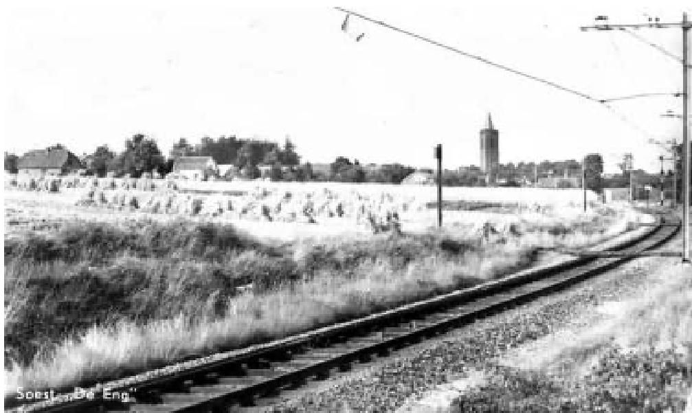
Afb. 3: Het koren nog in de schoof op de Soester Eng, dierbare herinnering uit het midden van de vorige eeuw.

In de daaropvolgende eeuwen ontwikkelde zich het landschap waarop kunstenaars zoals hiervoor beschreven verliefd werden en waaraan al dan niet ondersteund door foto-