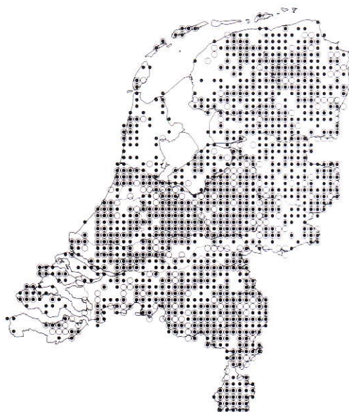
Verspreiding 1990-1997 (cirkel), 1998-2007 (stip). Distribution 1990-1997 (circle), 1998-2007 (dot).

Op de hoge zandgronden is de Blauwe glazenmaker wijd verspreid en vrijwel overal aan te treffen. De soort bewoont vooral stilstaande wateren en larven kunnen vooral in bosplasjes zeer talrijk zijn. In de lager gelegen delen van Nederland is de soort zeldzamer en ontbreekt vaak in open gebieden. In dit deel van Nederland kan de Blauwe glazenmaker worden aangetroffen in onder andere parken, tuinvijvers en bossen in de binnenduinrand. In het rivierengebied is de soort vrij schaars ondanks dat er veel geschikt biotoop aanwezig lijkt te zijn. Mogelijk houdt de soort niet van de overstromingen die hier in het winterhalfjaar optreden. Er lijkt geen sprake te zijn van een voor- of achteruitgang. Na 1997 is de Blauwe glazenmaker niet waargenomen op Texel. Opvallend genoeg zijn er nog steeds geen waarnemingen gemeld van Ameland.