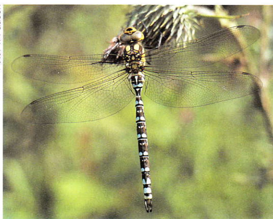
Blauwe glazenmaker Aeshna cyanea .