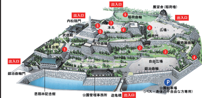
湖衣姫コンテストが行われる舞鶴城公園