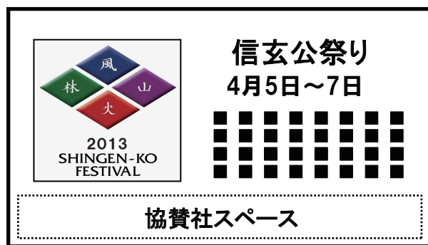
大型看板イメージ