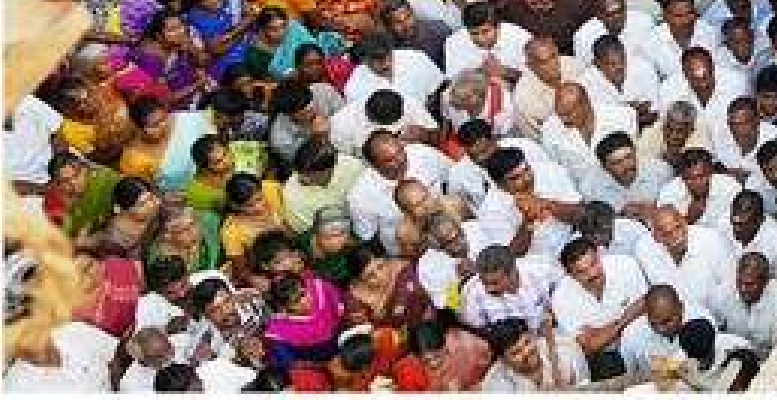
வேலூர் மாவட்டம் குடியாத்தம் அருள்மிகு செல்வநிநாயகர் திருக்கோயிலில் 26.10.2015 அன்று நடைபெற்ற திருக்குடமுழுக்கில் கலந்துகொண்ட பக்தர்கள்.