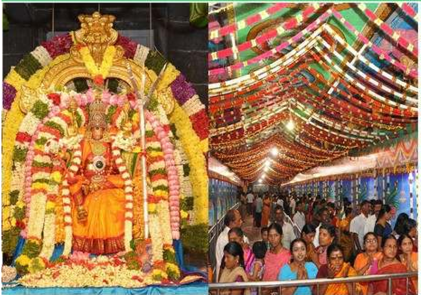
மதுரை பீளாட்சி அம்மன் திருக்கோயிலில் நடைபெற்ற நவராத்திரிப் பெருவிழாவில் பக்தர்களுக்கு அருள்பாலித்தபோது...