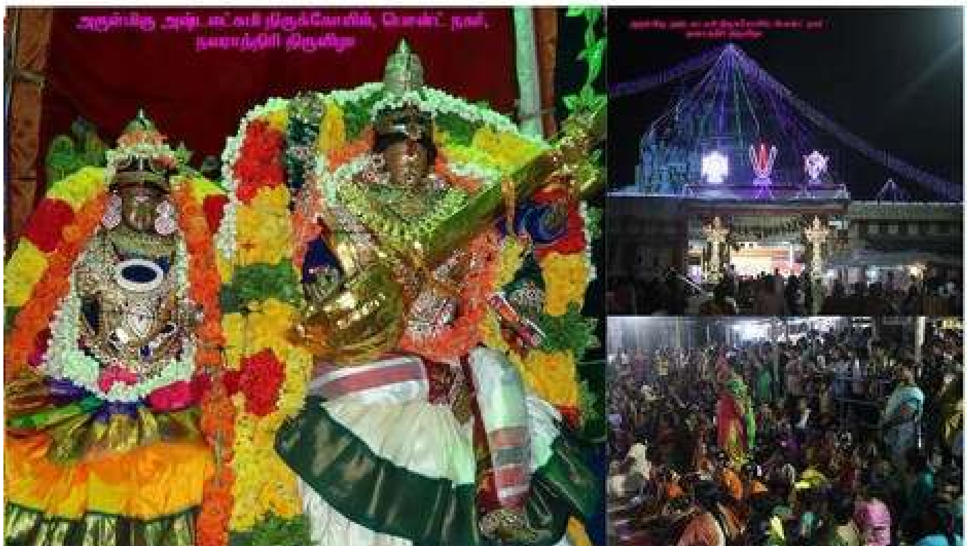
சென்னை பென்ட் நகர் அஷ்டலட்சுமி திருக்கோயிலில் நடைபெற்ற நவராத்திரிப் பெருவிழாவில் திரளாகக் கலந்துகொண்ட பக்தர்கள்.