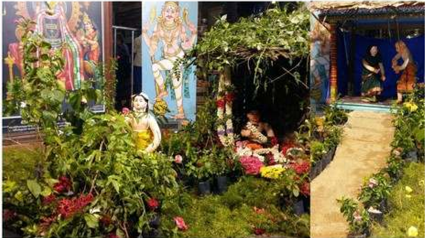
சென்னை மயிலாப்பூர் அருள்மிகு கபாலிகவர் திருக்கோயிலில் நடைபெற்ற நவராத்திரிப் பெருவிழாவில் கொழுக்காட்சி.