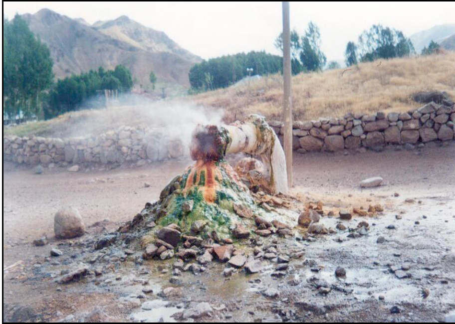
Foto 2: -Taşkapa (Şor) Köyü'nde açılmış jeotermal sondaj kuyularından biri. Çökelen mineral maddeler görülmektedir.

108°C -138°C arasında olduğu tahmin edilmektedir. Zilan jeotermal sahasının muhtemel jeotermal potansiyeli 25 yıl hiç beslenme olmadığı ve rezervuarda depolanan akışkanın %25'nin alınacağı varsayılarak jeotermal akışkanın 120°C rezervuar sıcaklığına göre debisi 2300 l/sn.dir. 15