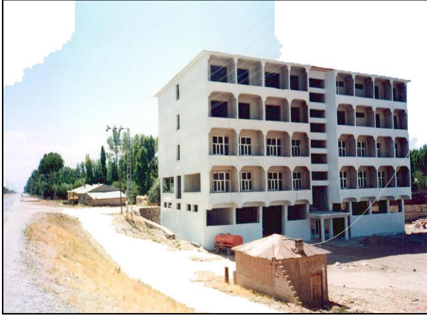
Foto 4: -Erciş'te Otogarın doğusunda inşa edilen Jeotermal Otel binası.

seracılık ve kültür balıkçılığı yapılması da planlanmıştı. Ayrıca, yine bu proje kapsamında Erciş'te iki jeotermal otele de yer verilmişti. Hatta jeotermal otellerin inşaatlarının büyük bir kısmı da tamamlanmıştı (Foto 4).