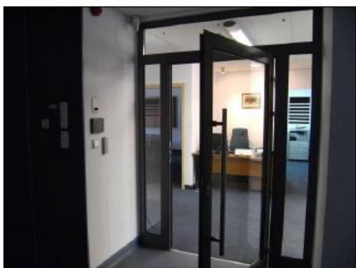
Fot. 19. Powierzchnie biurowe.