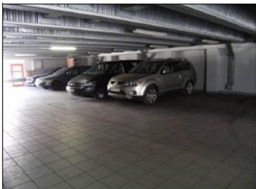
Fot. 13. Parking.