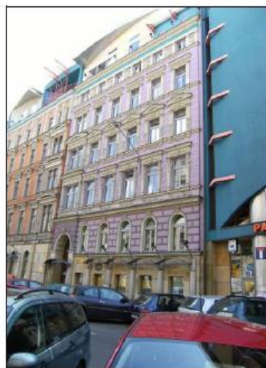
Fot. 2. Budynek biurowy przy ul. Rejtana 11.