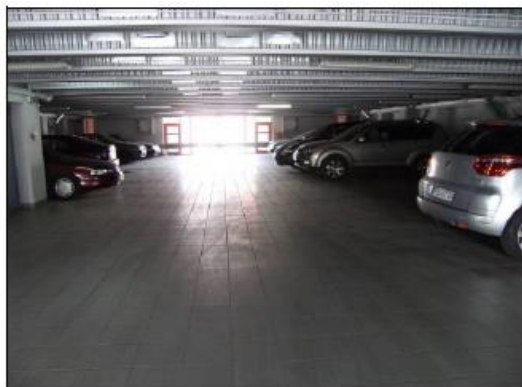
Fot. 14. Parking.