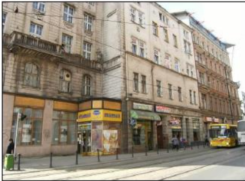
Fot. 7. Otoczenie nieruchomości.