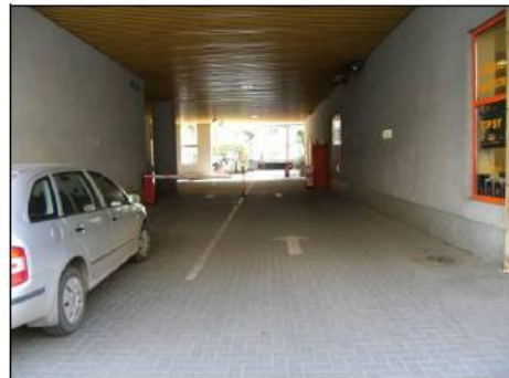
Fot. 10. Podjazd do budynku garażu.