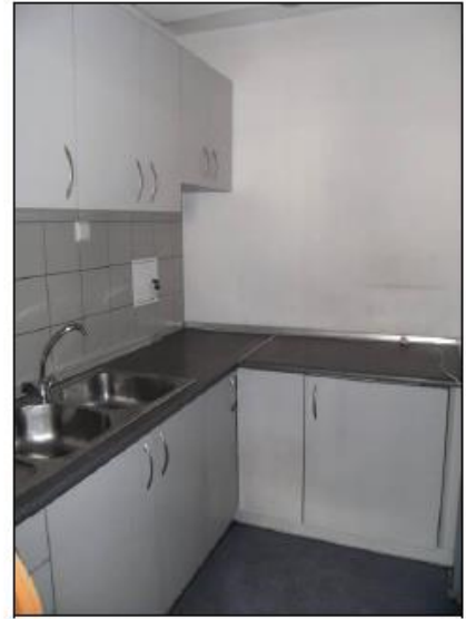
Fot. 24. Aneks kuchenny.