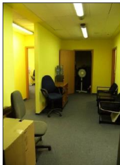
Fot. 20. Powierzchnie biurowe.