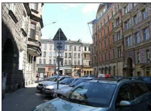
Fot. 3. Ulica Rejtana.