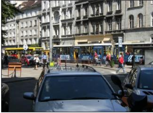
Fot. 5. Otoczenie nieruchomości.