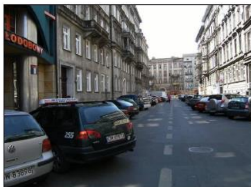
Fot. 4. Ulica Rejtana.