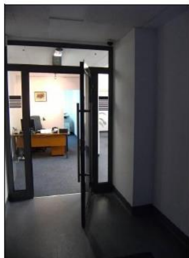
Fot. 18. Powierzchnie biurowe.