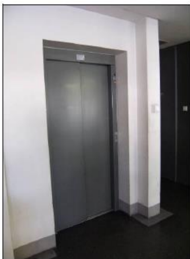
Fot. 17. Winda – budynek biurowy.