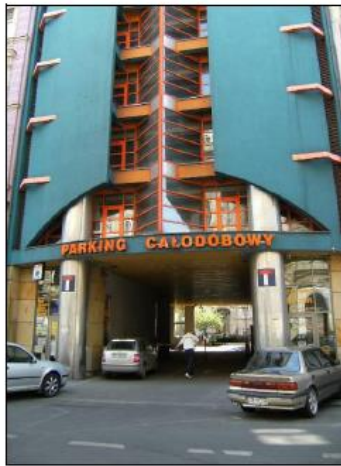
Fot. 9. Podjazd do budynku garażu.