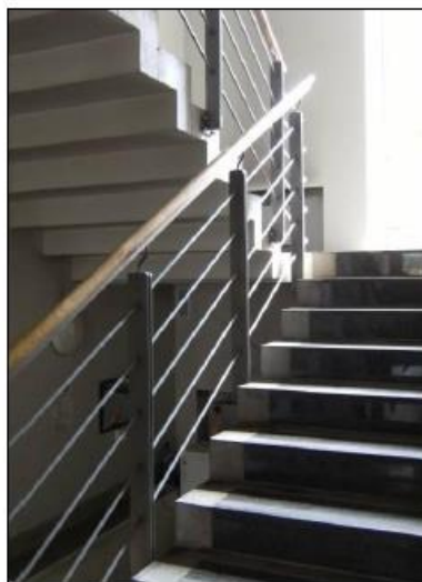
Fot. 16. Klatka schodowa – budynek biurowy.