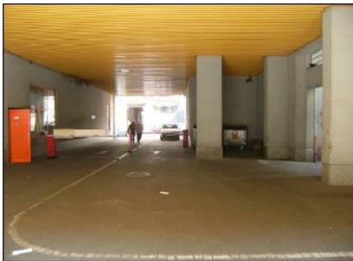
Fot. 11. Podjazd do garażu.