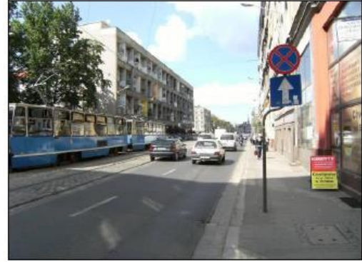
Fot. 6. Ulica Kołłątaja.