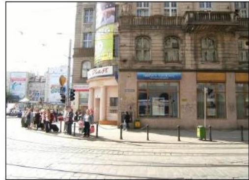
Fot. 8. Otoczenie nieruchomości.