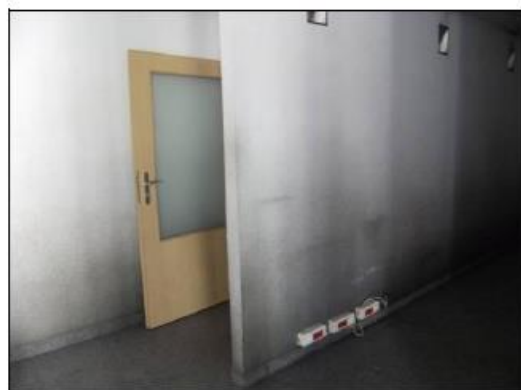
Fot. 22. Powierzchnie biurowe.