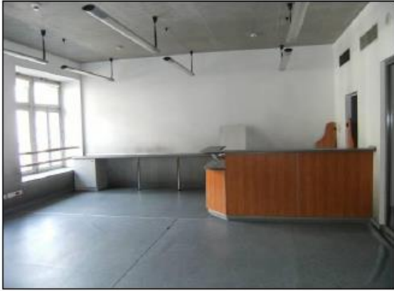
Fot. 23. Powierzchnie biurowe.