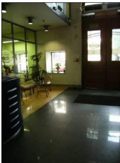
Fot. 15. Hall – budynek biurowy.