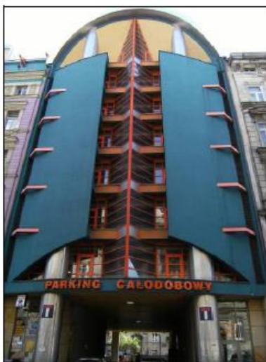
Fot. 1. Budynek garażu przy ul. Rejtana 9.