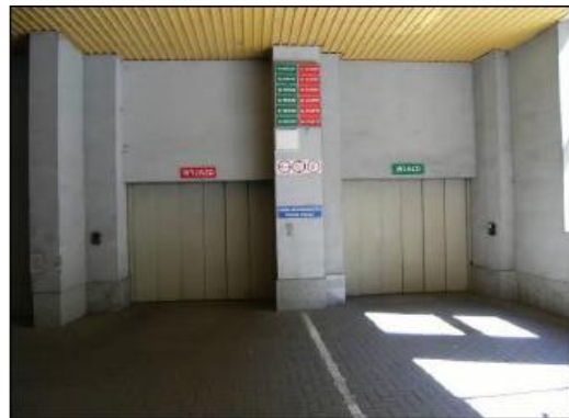
Fot. 12. Winda samochodowa.