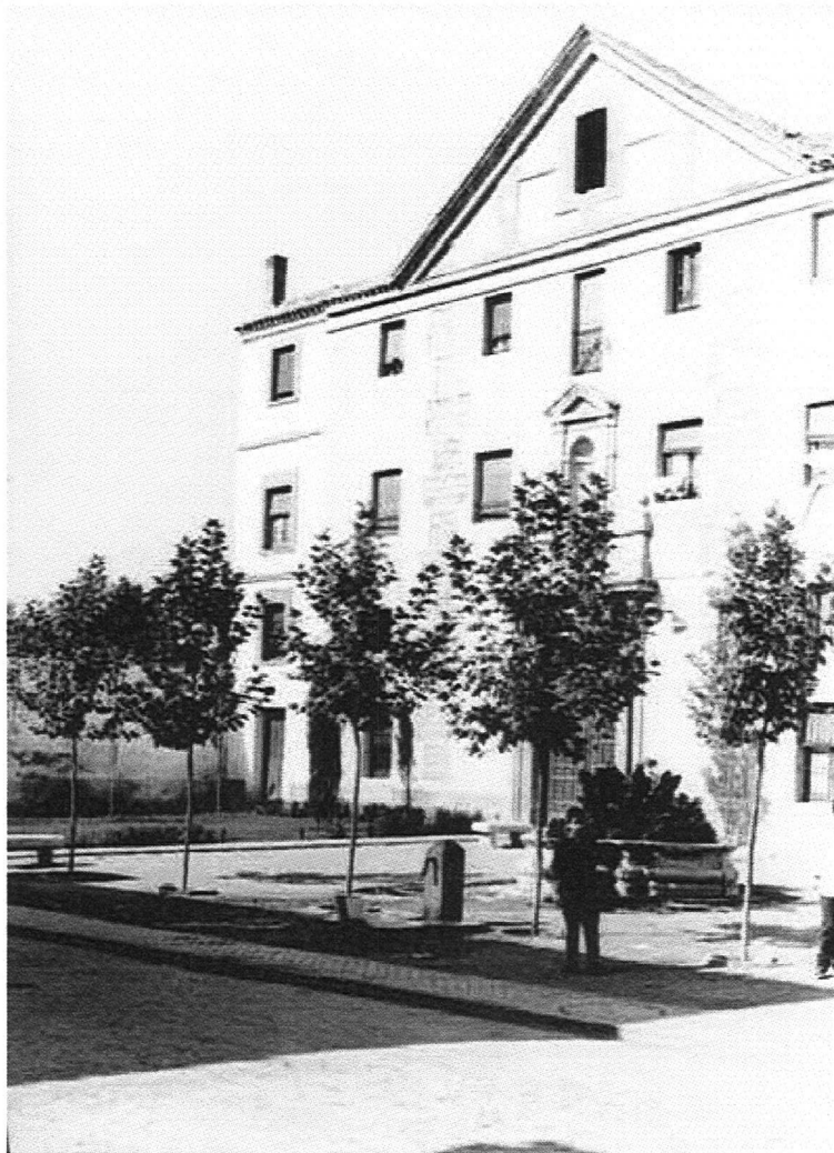
Antiguo hospital y farmacia militar. Plaza de la Victoria