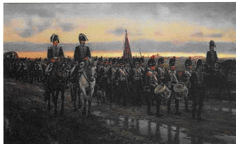
La salida de los zapadores de Alcalá en 1808. Augusto Ferrer Dalmau