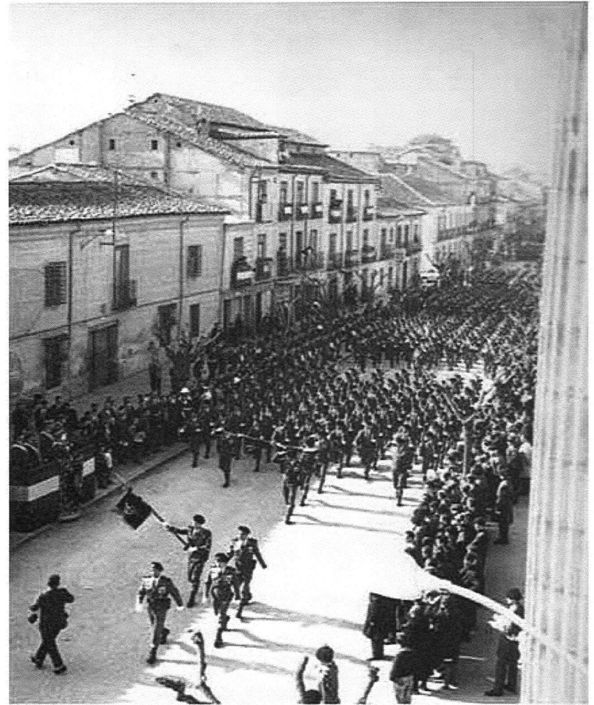
Parada Paracaidista desfila en la calles de los Libreros