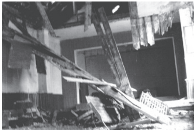
Народний дім у смт. Великий Любінь

На жаль, знову ніхто не подбав ані про ремонт, ані про зведення нової будівлі народного дому. Вже понад п'ять років цей блаженський, понищений часом будинок, що колись був народною будовою наших дідів і батьків, разом із бібліотекою закрито на замок, оскільки він перебуває в аварійному стані. Проте Городоцька райдержадміністрація не бачить, що в курортному містечку занепадає національно-культурне життя, молодь не має змоги і місця для проведення свого дозвілля.