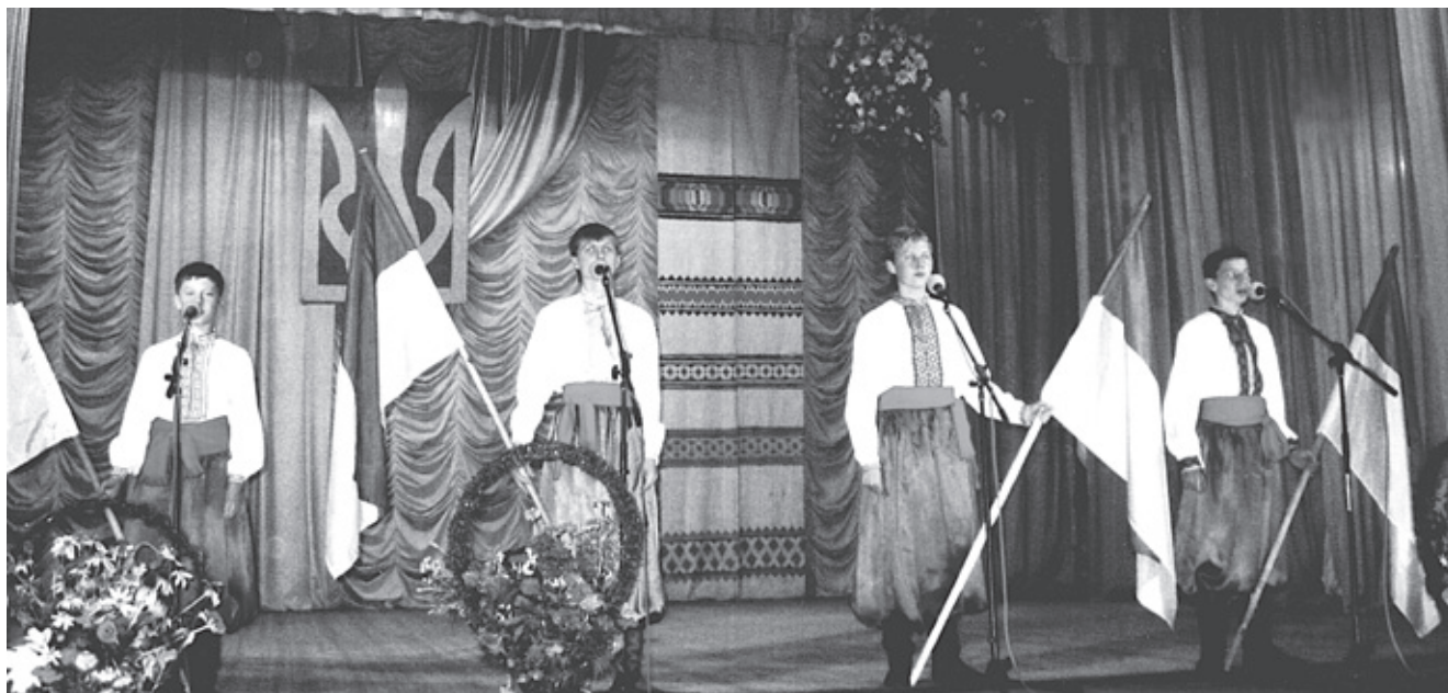
Виступ драматичного колективу «Планета мрій» з нагоди Дня Державного Прапора України

На обласному огляді-конкурсі масових заходів до 25-річчя аварії на Чорнобильській АЕС, що відбувся у Палаці культури імені Гната Хоткевича, виступ колективу із Новороздільського Будинку культури було визнано одним із найкращих. Це дає підставу стверджувати, що заходи міського Будинку культури «Молодість» мають