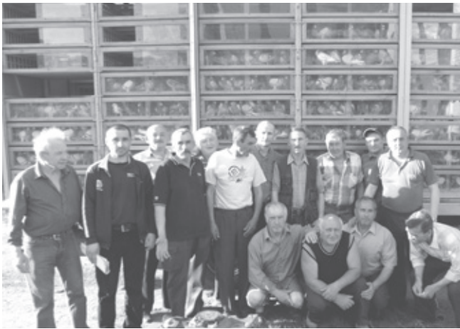
Учасники клубу голубоводів «Крила» перед змаганнями