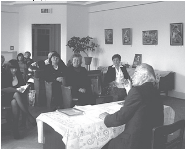
Учасники обласного семінару методистів культурно-освітньої роботи

Н а виконання комплексного плану роботи управління культури Львівської обласної державної адміністрації, на базі Львівського державного обласного центру народної творчості і культурно-освітньої роботи у березні цього року відбувся семінар методистів культурно-освітньої роботи народних домів. Під час семінару було проаналізовано сьогочасний стан та окреслено перспективи подальшого вдосконалення роботи сільських закладів культури у галузі національно-патріотичного, християнського та естетичного виховання серед населення.