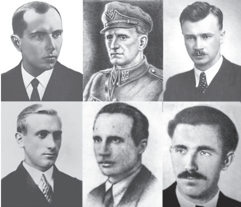
Степан Бандера, Роман Шухевич, Олег Кандиба (Ольжич), Роман Клячківський (Клим Савур), Василь Сидор (Шелест Виштий), Дмитро Грицай (Перебийніс)

14 жовтня 2012 року виповнюється 70 років від дня створення Української Повстанської Армії.