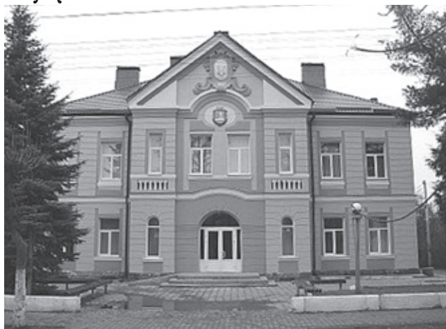
Палац культури у м. Ходорові

Колективи художньої самодіяльності МПК продемонстрували свою професійну майстерність під час святкового концерту. На сцені установи культури виступили: Народна хорова капела «Мрія», Народний ансамбль танцю «Наддністрянка», Народний оркестр народної пісні і музики «Заграва», Дует бандуристів «Мальви», Народний самодіяльний ансамбль троїстих музик «Візерунки», Народний чоловічий вокальний ансамбль «Діброва»,