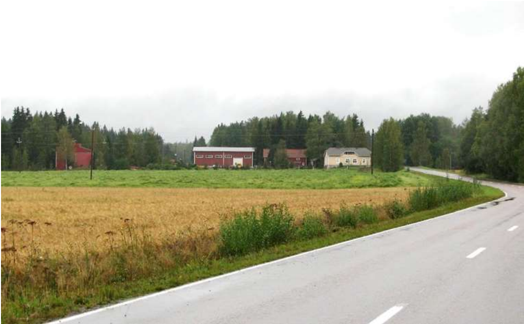
Kuva: Laahan talo peltomaiseman päässä Hyvinkäntien varrella.