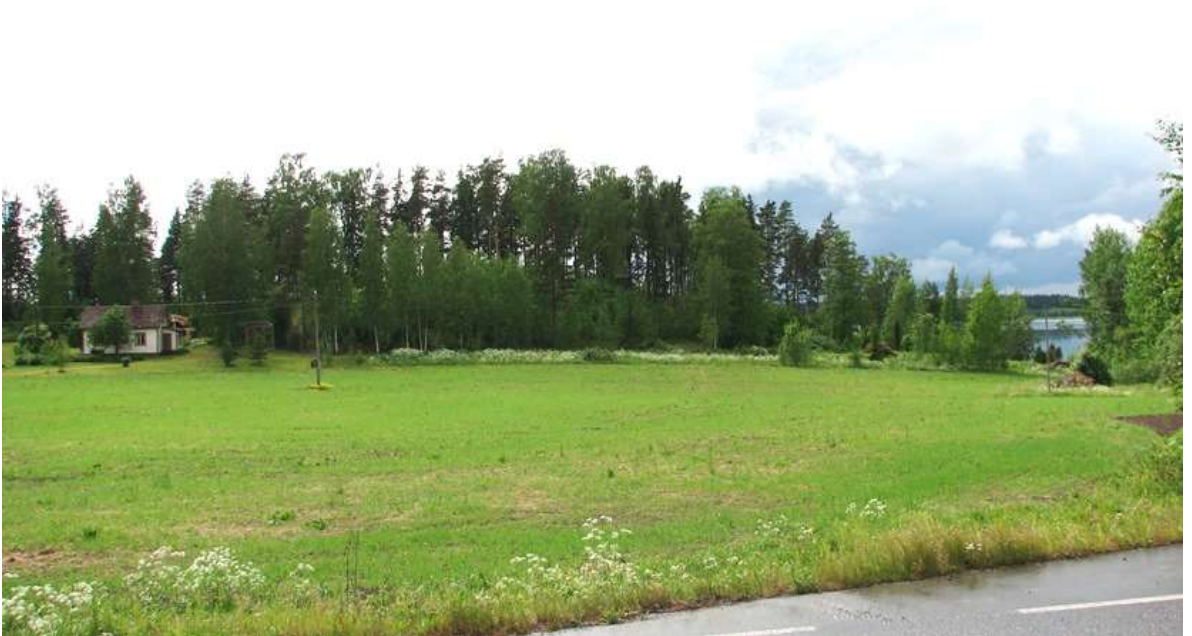
Kuva: Kilpijärven rantapelloja Salmelan pohjoispuolella.