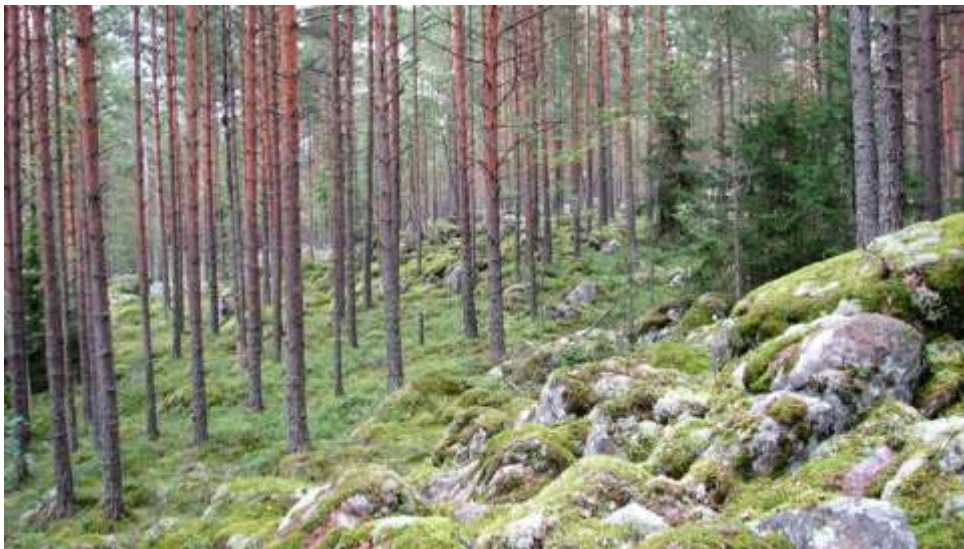
Kuva: Metsämaisemaa Suojärventien varrelta

Kansikuvat: Vähäkylän Santamäki (yläkuva), Vanhakartanon pelto eli kylän vanhimmat rintapelot (alakuva)