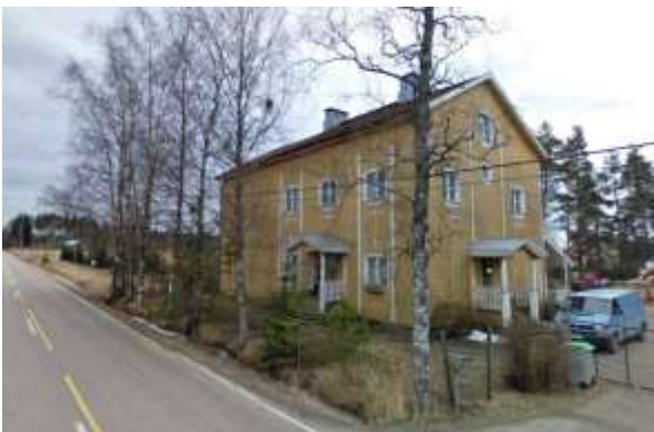
Kuva (oik.): Murron pihapiirin rakennukset ja rakenteen luovut pienipiirteistä pihamiljöötä. (2008)