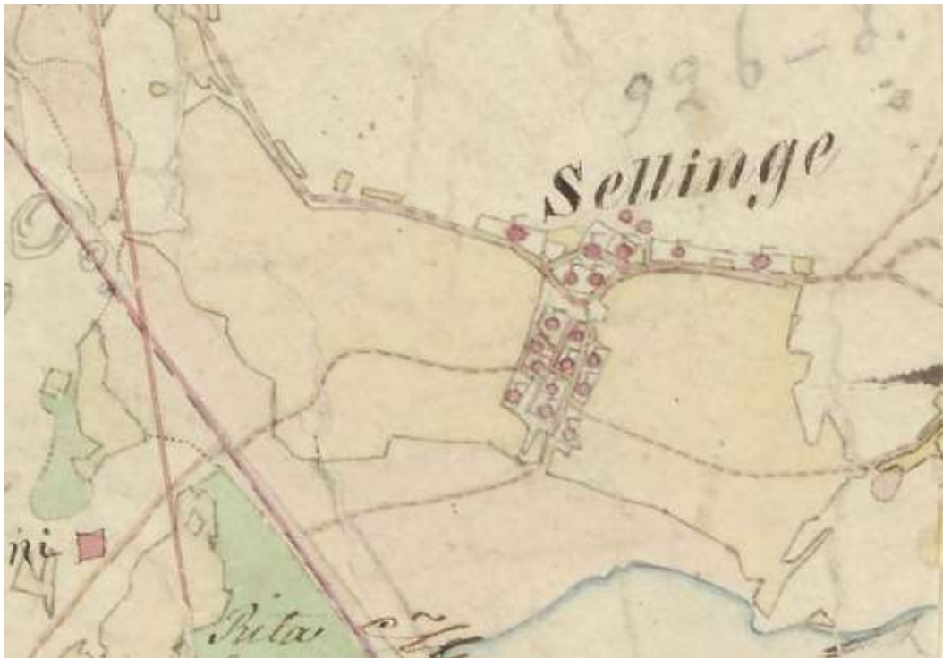
Kuva: Sälinkään vanha kylä Lukonmäen ja Kotojärven välissä. / Osasuurennos pitäjänkartasta (n. 1840)