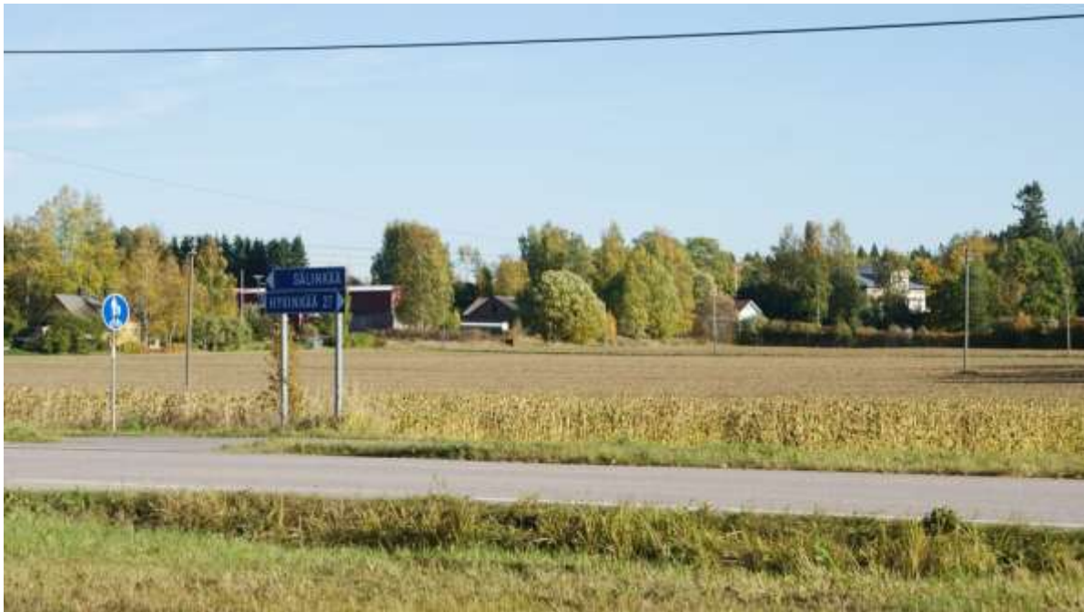
Kuva: Kaanaantieltä kartanolle avautuva näkymä. (2013)