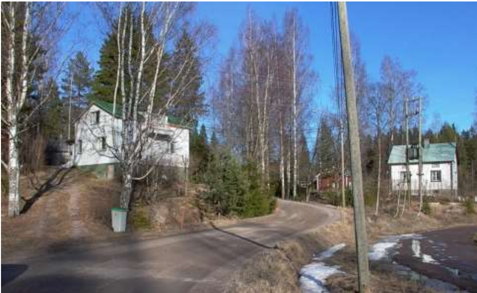
Kuva: Koverontien alkupään puolitoistakerroksisia puutaloja. Rakennuskantaa yhdistää jo ennen viime sotia ja etenkin sen jälkeiselle tyyppirakentamiselle ominainen kompakti neliömäinen hahmo, puolitoistakerroksisuus sekä jyrkähkö harjakatto. / Kaisa Linnasalon raportti, 2004