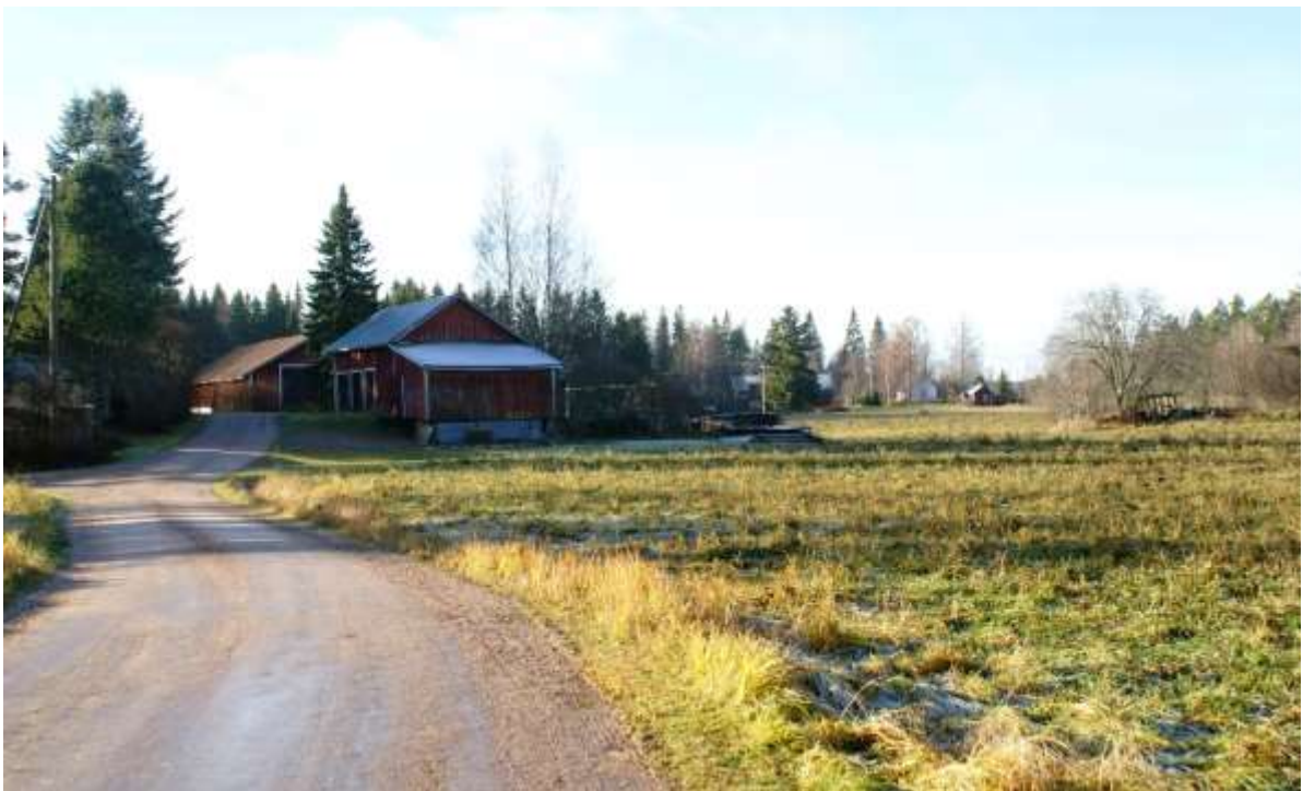
Kuva: Vanhaa torpparialuetta Järvikulmalla.

Kartanokylässä torpparilaitos takasi päättilalle vakinaisen työvoiman. Sohlbergin aikana torppien määrä lisääntyi niin, että välillä niitä oli yli 100. 11 Torppien lukumäärä vaihteli, sillä siinä missä uusia perustettiin, vanhoja myös hävitettiin; 1830-luvulla torppia oli noin 80. 12 Kylälle vuonna 1983 perustettuun torpparimuistomerkkiin on merkitty 124 torpan nimet. Torpat olivat pelto- ja niittymailtaan erisuuruisia. Isoimmista ja usein vanhimmissa torpissa saattoi olla 1900-luvun alussa yli 20 ha peltoa, kun pienimmissä viljelty ala jäi alle 2 hehtaarin.