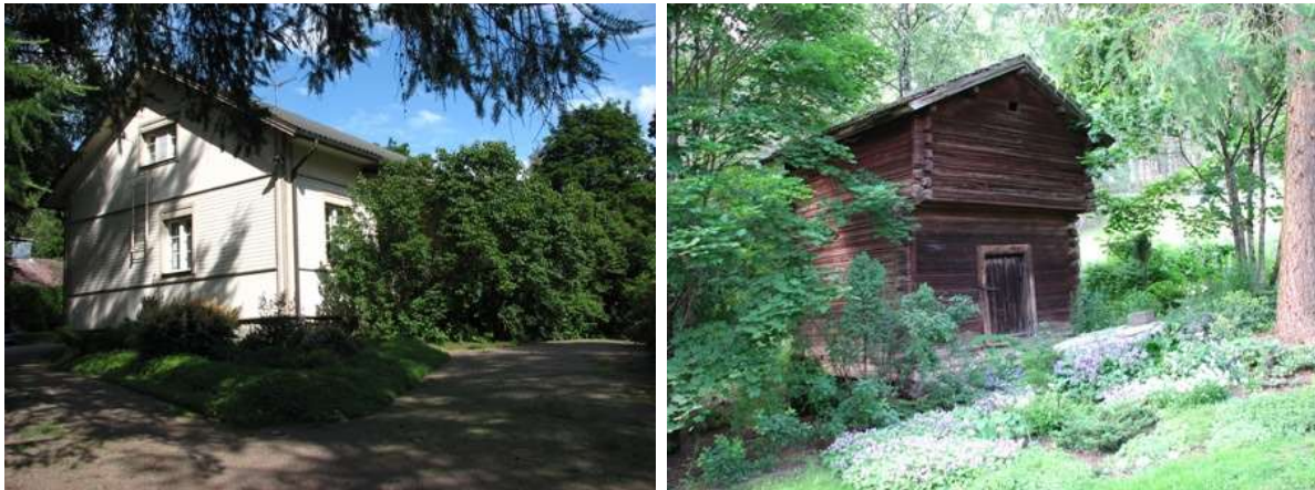
Kuvat: Vanhakartanon päärakennuksen rappaus (kiinnitys tapituksella suoraan hirteen) on korvattu vyöhykkeisellä puuverhouksella. Tienpuoleinen pitkä avoveranta on rakennettu uudelleen vanhaan malliin. Pihanpuoleisesta sivukuistista on tehty aikaisempaa suurempi harjakattoinen umpikuisti. Pihan reunalla on korkeaotsainen yksinäisaitta. (2008)