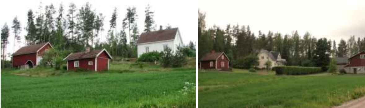
Kuvat: Kuvassa vasemmalla on Pakkalan pihapiiriä, missä pieni 1930-luvun asuinrakennus on pitkälti alkuperäisessä asussaan. Oikealla on Liljan 1930-luvun alussa valmistunut päärakennus, jonka ulkoasussa on kerroksellisuutta.

Kyrölän ja Koivulähteen välillä oleva metsäsaareke jakaa laakson kahtia Vähäkylään ja Kannakonaukeaan. Vähäkylän ja Kannakonaukean peltomaiseman keskellä näkyy kolmen 1940-luvun lopulla perustetun karjalaistilan tilakeskukset: Kannakko, Koivulähde ja Hannula. Peltoaukean reunoilta työntyy esille samankaltaisia alaosaltaan sementtitiili- tai betonirunkoisia karjarakennuksia. Kannakonaukea rajautuu idässä Oitintiehen. Maantien ympäristössä rakennukset ovat lähes poikkeuksetta rakennettu joko rinteeseen, kalliomäelle tai loiville kumpareille, jolloin ne jäävät tietä ylemmäksi. Asutus sijoittuu vanhojen torppien paikoille ja niiden lomaan. Täydennysrakentaminen on kuitenkin jo muuttamassa maantiehen rajautuvan asutuksen luonnetta, ja alue Kuunovinmäeltä Yrjölänmäelle alkaa olla tiivistä kyläkeskustaan liittyvää pientaloaluetta. Muutamain paikoin maisemaan avautuville tonteille tehdyt uudisrakennukset työntyvät melko hallitsevina viljelymaisemaan.