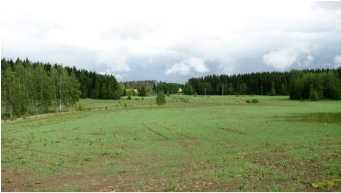
Kuva: Näkymä maantieltä Nikkiläntien viljelymaisemaan.