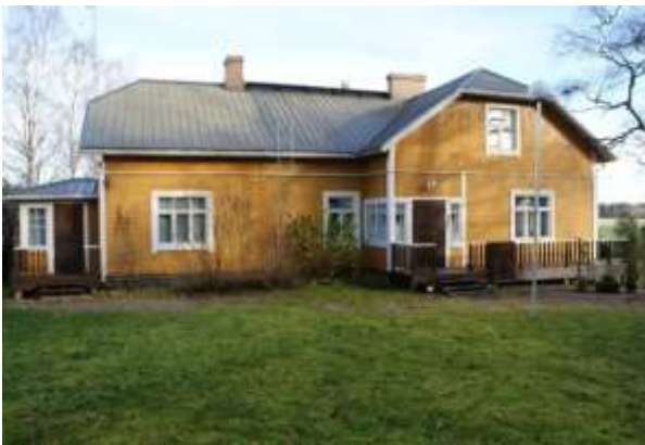
Kuva: Laahan päärakennus (2013)