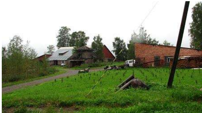
Kuva (vas.): Paavila on ulkoasunsa ja ikänsä perusteella ollut ulkotilan työväenrakennuksia. Tontille on rakennettu myöhemmin pieni pyöröhirsinen saunamökki.