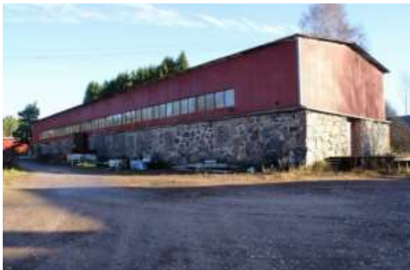
Kuva: Kartanon navetasta on enää jäljellä kiviseinät. (kuvat 2013)