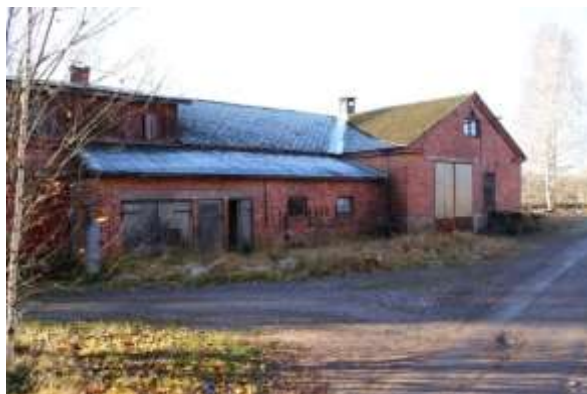
Kuva: Meijerissäkin muutokset ovat olleet suuria ja rakennushistoriallisia piirteitä tuhoavia.