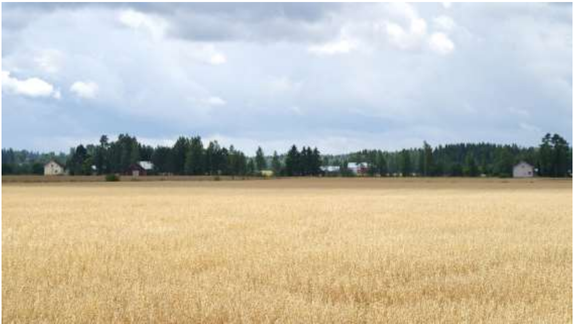
Kuva: Kaanaanjoen ranta-asutusta jälleenrakennuskaudelle tyypillisin taloin.