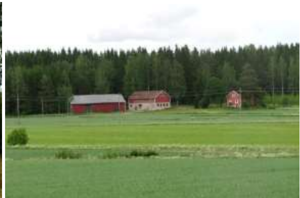
Kuva: Jälleenrakennuskauden tilakeskus.