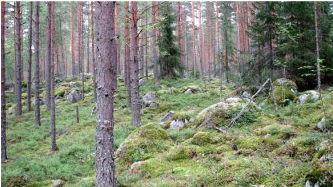
Kuva: Metsämaisemaa Suojärventien varrelta