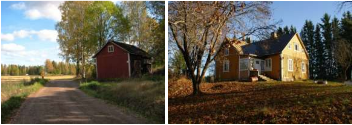
Kuvat: Oikealla on Suomen piharakennus ja näkymä koilliseen, missä sijaitsi aikoinaan Järvelän torppa. Suomen pihassa on perinteisessä asussaan säilynyt puutalo vuodelta 1924. (2013)