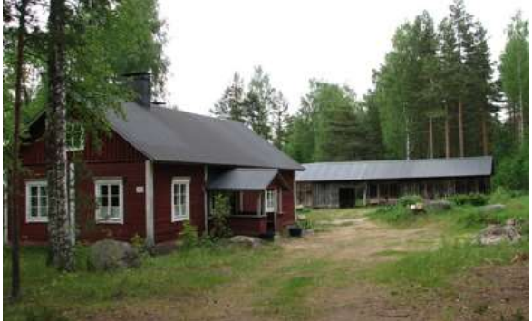
Kuvat: Kuvassa on Haapamäen pihanpuoleinen julkisivu. (2008) Oikealla on Karelian vuoraamaton asuinrakennus ja pitkä hirsistä aittahuoneista sekä lautavälköistä koottu piharakennus.(2013)