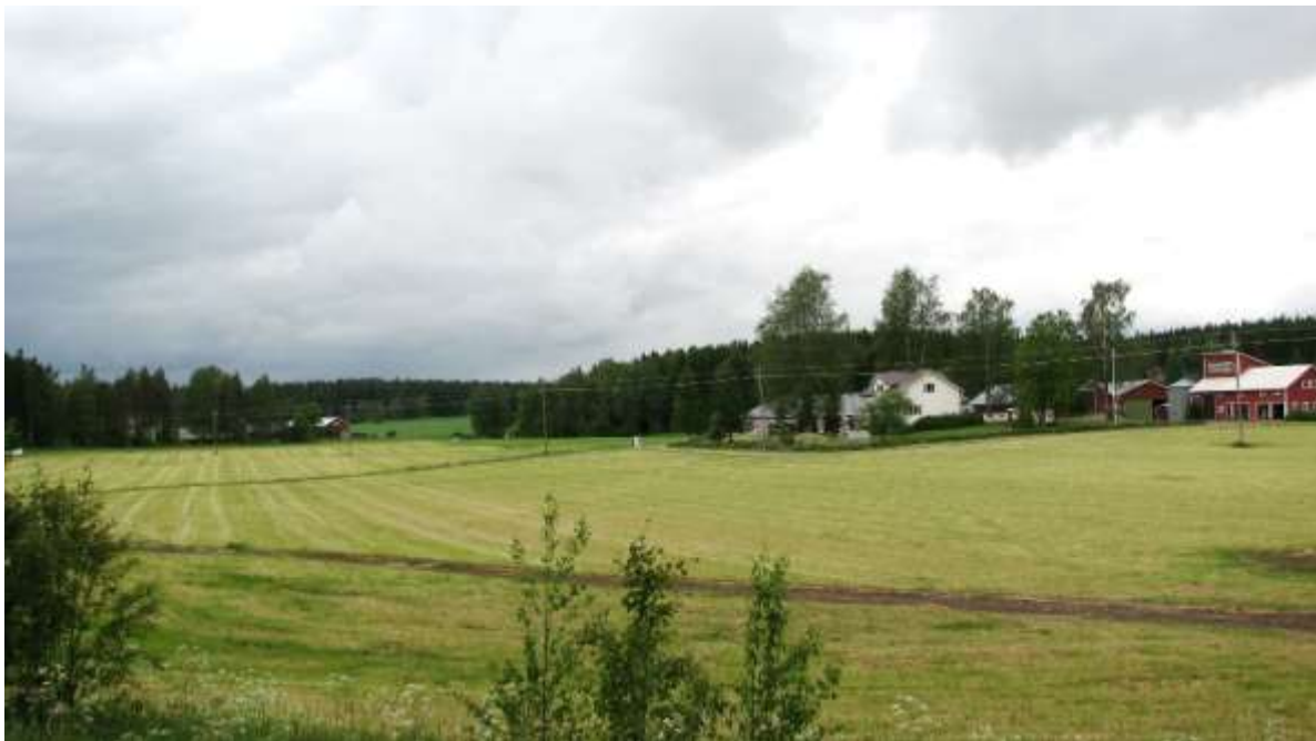
Kuva: Vähäkylään perustettiin viime sotien jälkeen asutustiloja. Kannakonaukean keskellä on Kannakon tilakeskus. Näkymä jatkuu Koivulähteen tilan oitse Vähäkylän vanhalle peltoaukealle.

Torppien itsenäistyminen muutti ensi alkuun kylän asutus- ja viljelymaisemia pelto- ja niittyalueiden osalta, jonkin verran itsenäisiä tiloja myös halottiin perinnönjaoissa. Merkittävämpi muutos tapahtui 1940- ja 50-luvuilla, kun kartanon maaomaisuus pirstoutui usealle eri omistajalle. 17 Kartanon maita otettiin ensin pika-asutukseen ja sodan päätyttyä maanhankintalailloin asutustoimintaan. Kartanon ydinalueella sen talouskeskus ja lähimmät pellot jaettiin myös asutustiloiksi sekä pienemmiksi rintamamiestiloiksi. Haja-asutusta lisäsi myös itsenäisten tilojen halkominen ja asutotonttien lohkominen, jälkimmäinen näkyi 1940-luvulta lähtien myös kylätaajamassa.