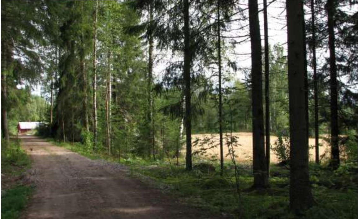
Kuva: Puoliavointa maisemaa Lassilantien varrella.