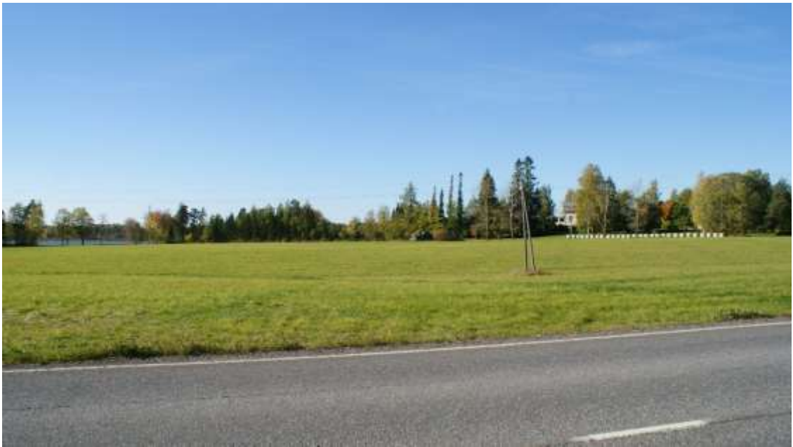
Kuva: Kartanokeskus kuvattuna etelästä, vasemmalla näkyy Kilpijärvi (2013).