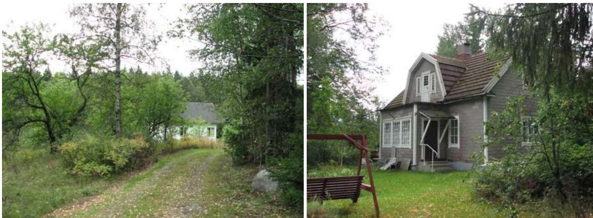
Kuva: Haaralan asuinrakennus pihatiensä päässä. Kuva: Sointulan asuinrakennus.

Karhuaronojan tuntumassa sijainneet torpat, Malmbacka ja Junttila, perustettiin 1810-luvulla, samaan aikaan asutettiin myös Kotkan torppa Oitintien varrelta. Asutus on jatkunut yhtäjaksoisesti vanhoilla asuinpaikoilla, Rajanmäen, Junttilan ja Kuuselan tiloilla. Rakennuskanta on uudistunut vaiheittain torppien itsenäistymisen jälkeen. Kimparintien varteen, kylänrajan lähelle on rakentunut loma-asutusta 1980-90-lukujen taitteessa.