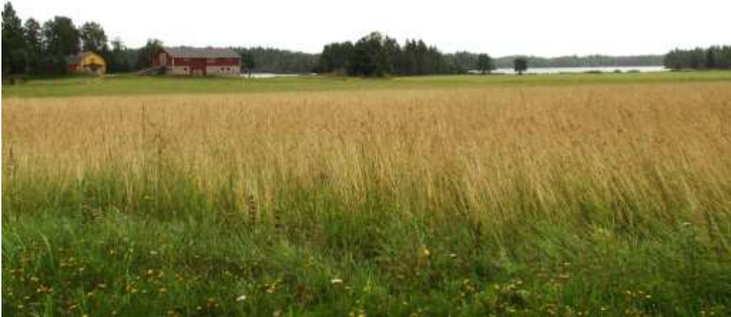
Kuva: Järvikulmantiehen rajautuvaa pelto- ja vesistömaisemaa Juholan ja Terhenniemen luona.