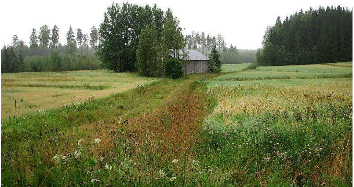
Kuva: Joutsjärven peltomaisemia.

Joutsjärven päärakennus on vanhimmilta osiltaan ilmeisen vanha, mahdollisesti jopa 1700-luvulta. 55 Sisäosiltaan tulipalossa vaurioitunut tupa on omistajan mukaan vuodelta 1918. Rakennus on nyt varastona ja pihaan 2001 rakennettu hirsimökki toimii asuinrakennuksena. Pihapiirissä on myös kaksikerroksinen aitta, navetta ja muutama muu hirsinen ja lautarunkoinen talousrakennus. Vanhat riihipihan rakennukset kuuluvat nykyään Joutsmäen tilaan.