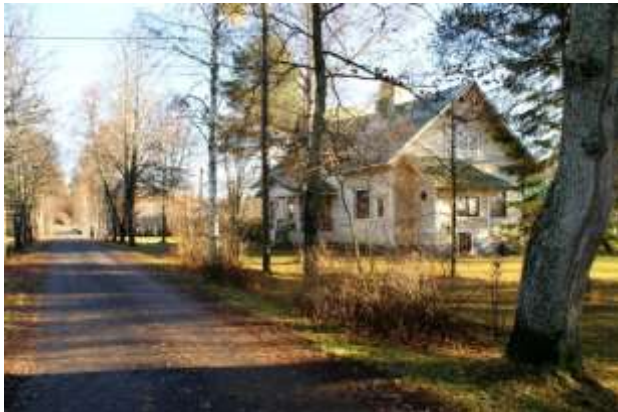
Kuva: Toivola kartanolle vievän kujan varrella (2013).