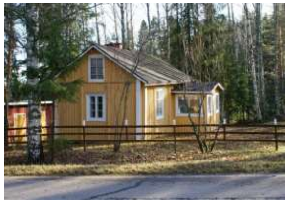
Kuva: Kaunismäen pikkumökki (2013)