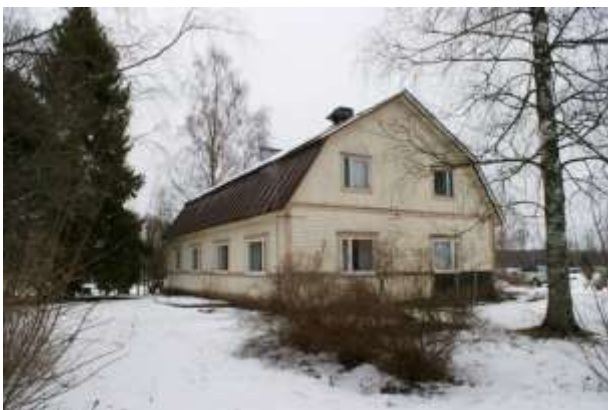
Kuva: Eskolan talo (2013)

Kauniston puutarhan ympäröimä päärakennus on rakennettu vaiheittain laajentamalla 1930-luvun rankorakenteista rakennusta. Kauniston tilan edustalla Kilpijärvässä on Pukkisaari, jonne on 1940-luvun lopulla rakennettu lautarunkoinen kesähuvila, sauna ja liiteri muodostavat tyyllisesti poikkeuksellisen yhtenäisen kesämökkimiljöön. Samoihin aikoihin loma-asutusta tuli myös mantereen puolelle Järvenpääntien varteen Kauniston pohjois- ja lounaispuolelle. Myöhemmin 1900-luvun jälkipuolella loma-asutus on tiivistynyt ja kesämökkejä on rakennettu myös Järvenpääntien vanhoille torpanpaikoille Tuoksenlahden rannalle.