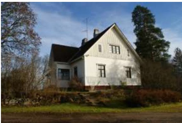
Kuva: Myllymaan jyrkkäharjaista 1920-luvun taloa on myöhemmin jatkettu pituussuunnassa. (2013)