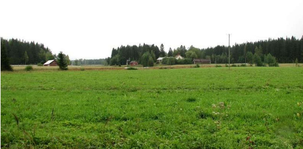
Kuva: Sivulaakson peltomaisemaa kuvattuna Takalantieltä Erkkiläntien suuntaan.