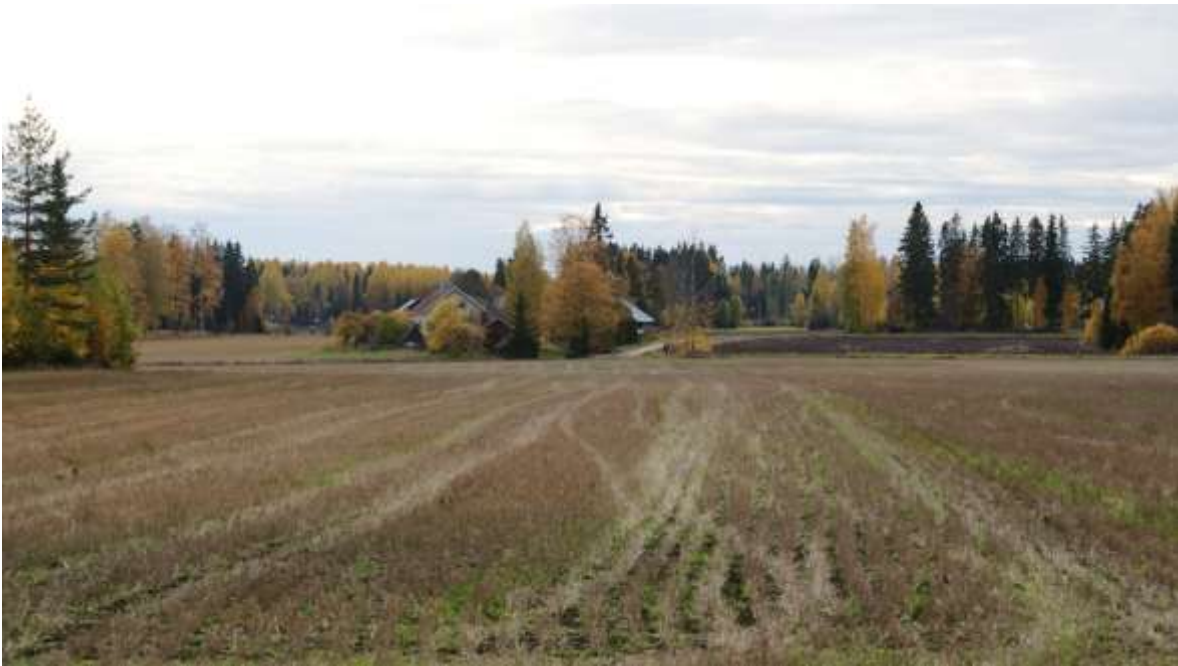
Kuva: Viljamaan talouskeskus peltomaiden keskellä