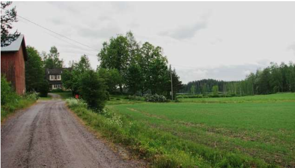
Kuva: Kaunisto ja vesistöön liittyvä peltomaisema.