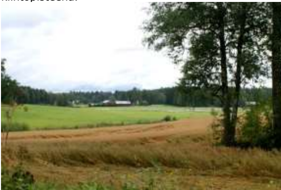
Kuva: Maisema Kannakonaukean suuntaan.