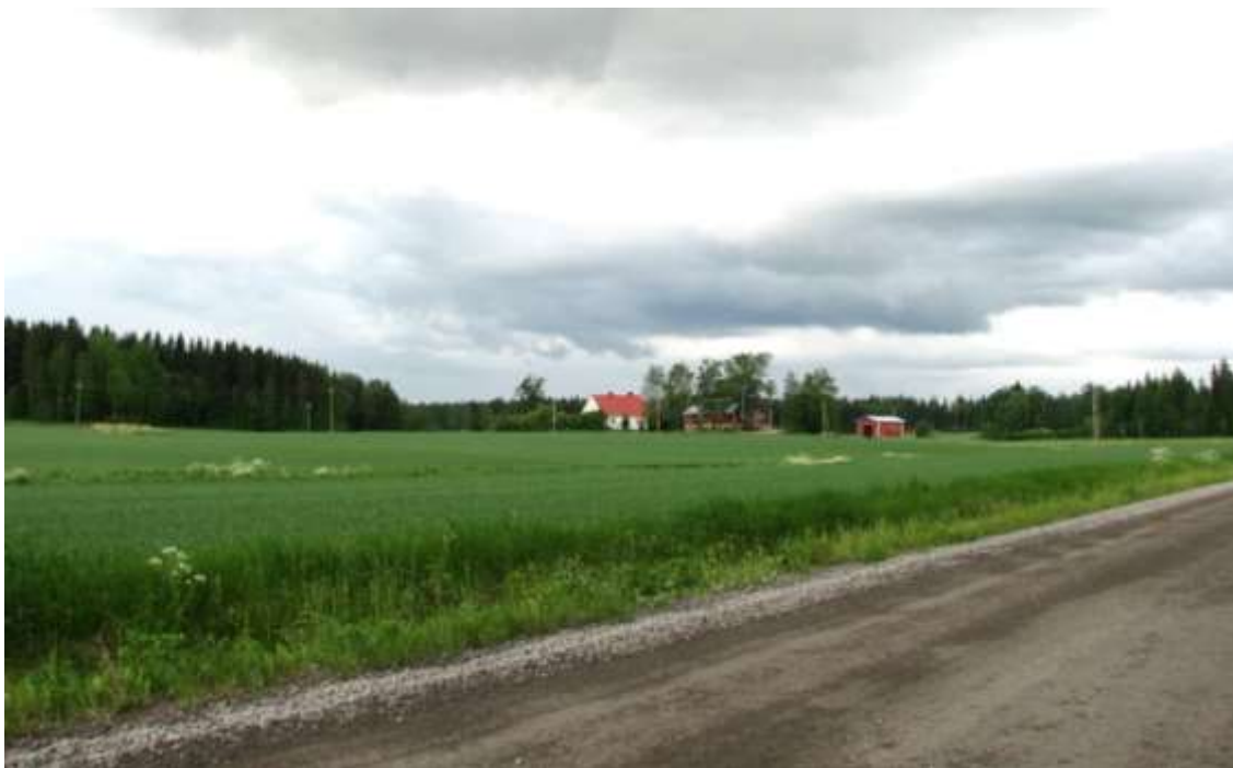
Kuva: Sarkasuon sivulaaksossa sijaitsevan Jussilan talo on viljelysten ympäröimällä kummulla. Päärakennus on 1930-luvun alusta, sementtitiilinavetta on 1950-luvulta.

Syrjälässä vanha tie päättyy nykyään Syrjälän eli entisen Kurlinin torpan (1816) pihapiiriin, jossa on 1950-luvun päärakennus piharakennuksineen. Haapakallion pienen kaksihuoneisen hirsitalon paikalla on ollut Sveitsin torppa (1816-1842); korjauksissa suuremmilta muutoksia säästynyt asuinrakennus on rakennettu 1900-luvun alussa osin käytetyistä hirsistä. Näiden kahden vanhan asuinpaikan lähiympäristössä on yksittäisiä pieniä puutaloja 1940- ja 50-luvuilta.