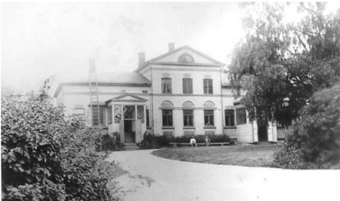
Kuva: Sälinkään kartano 1800-luvun lopulta, pohjoisfasadi. MKK 9202-7.