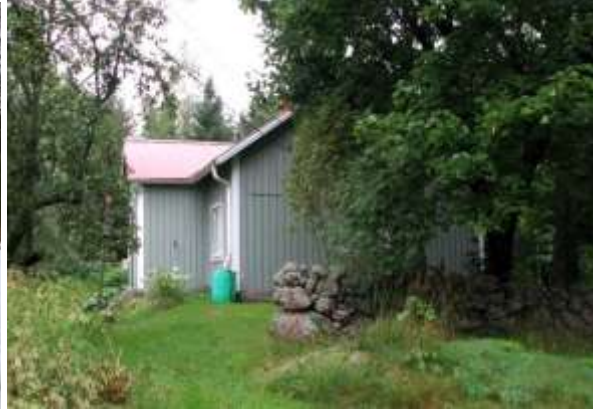
Kuva: Sola on yksi maisemapiirteiltään ja rakennustavaltaan tasapainoisista pienmiljöistä jokilaakson tiemaisemissa. (2013)