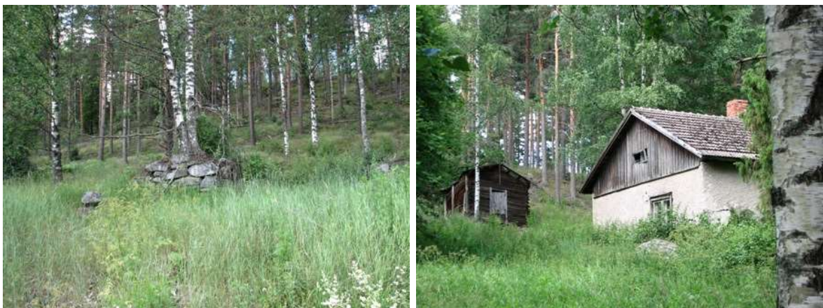
Kuvat: Vanhakartanon asuntopihan länsipuolella mäenrinteessä on näkyvissä rakennusten perustuksia ja uuninpohjia sekä kaksi huonokuntoista työväen asuinrakennusta - hirsiseinäinen ja rapattu - sekä aitta. (2008)