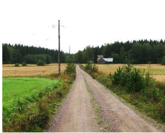
Kuva: Haapakallion kaksihuoneinen asumus edustaa mittasuhteiltaan hyvin 1800- ja 1900-lukujen vaihteen pienasumusta. Hirsirunkoinen rakennus on tiettävästi 1900-luvun alusta, kuisti on tehty myöhemmin. Syrjäläntie halkaisee kapean peltomaiseman.