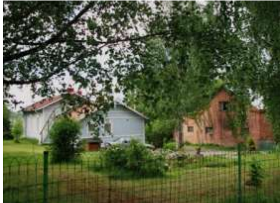
Kuva: Lepolan talo on entisen meijerin vieressä.