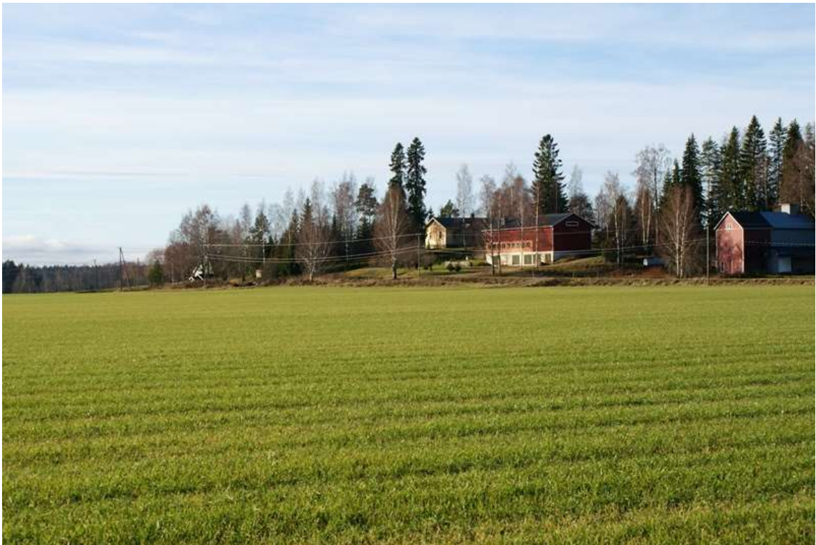
Kuva: Kaanaan mäki ja Harjulan talouskeskus kuvattuna luoteesta Järvenpäntieltä. Korkeat yksittäiset kuuset, tavallisesti siperianpihtoja, ovat olleet vanhoihin tilakeskuksiin liittyviä maamerkkejä jo 1800-luvun jälkipuoliskolta lähtien. Kaanaan mäen rinteelle on tullut myös perinteisestä rakennustavasta poikkeavaa asuntorakentamista.