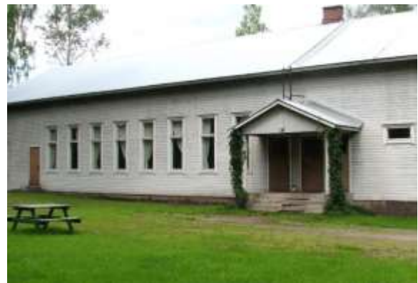
Kuva: Metsälinna. (2008)