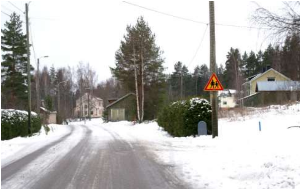
Kuva: Lukon koulu ja puutaloasutusta Lukonmäen rinteessä.