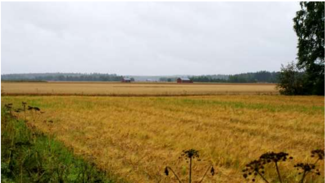
Kuva: Kaanaan jokilaakson peltotasankoa kuvattuna Suonpäntieltä etelään.