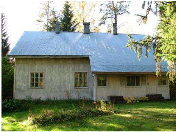
Kuvat: Kesämäen vuoraamaton hirsitalo ja Kunnalan pysty-laudoitettu hirsitalo sijaitsevat nykyään metsäympäristössä. Rinteeseen tonttien kohdalle on 1870-luvun kartassa merkitty kapea pelto. (2008)