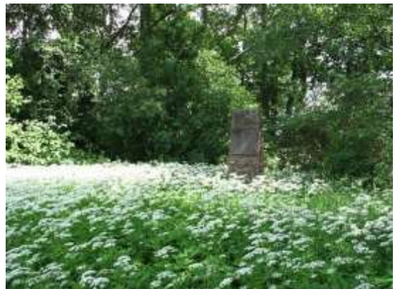
Kuva: Sälinkään lasiruukin muistopaasi.