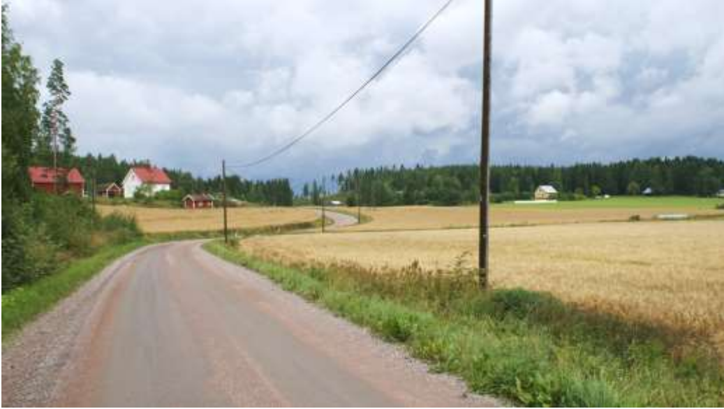
Kuva: Lähestymismaisema etelästä tullessa. Vasemmalla tien mutkassa on Pakkala, ja oikealla metsän reunassa Mäkelä. Mäkelän 1920-luvulla rakennettua päärakennusta on laajennettu ja uudistettu 1970-luvulla.