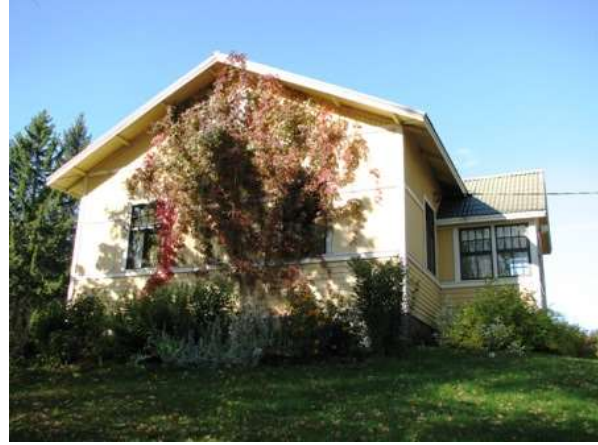
Kuvat: Entinen Kaanaan ulkotilan päärakennus on säilynyt kohtuullisesti 1900-luvun alun asussaan. Sen tunnuspiirteitä ovat korkea kivijalka ja julkisivujen vuoraustapa, vaalea väritys, yläosastaan pieniruutuiset T-ikkunat ja lasikuisti. Peruskorjaus valmistui 1973. Rakennuksen pohjoispäättyyn tuli pieni laajennusosa, ikkunapokat ja puitteet ovat nykyään tummanruskeat.