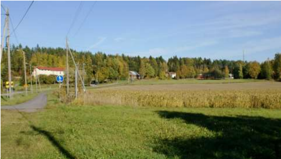
Kuva: Sälinkään koulu ja Kaanaantien varren rakennuksia.