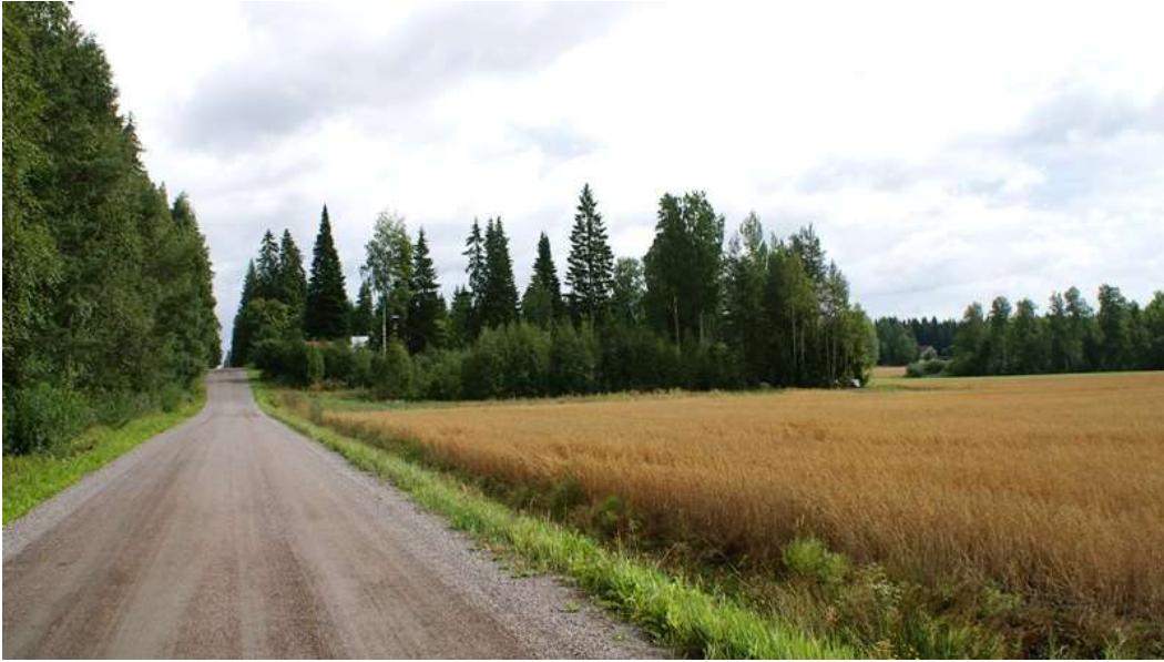
Kuva: Tikkatie ja mäenkumpareelle perustetun Suomäen komea pihapuusto,