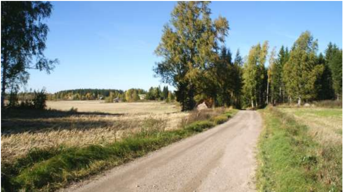
Kuva: Näkymä Karelian suunnalta Nikkilän talon ohi Sälinkääntielle.