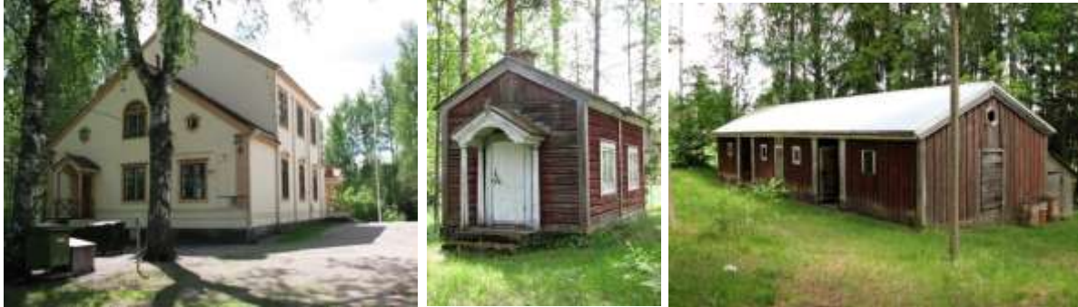
Kuvat: Lukon koulu, sauna ja ulkorakennus (2008).

rakennuksia on myös koulun eteläpuolella, Sälinkääntien varrella. Pensasaidat rajaavat tontteja, joiden keskellä on rakentamisajankohdalle tyypillisiä harjakattoisia puutaloja. Maantien alapuolella, Temmolan ja Puiston tonteilla, on eri-ikäisiä pieniä rakennuksia, joista vanhimmat ovat 1900-luvun alkupuolelta. Kohdealueen ulkopuolella alkaa entisen sahan alue, jossa on huonokuntoisia rakennuksia ja betonirakennelmia. Lukon koulun ja Sälinkääntien välissä on urheilukenttä ja vedenottamo.