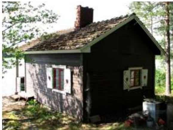
Kuvat: Vasemmalla on Pukkisaaren kesämökki. (2008)