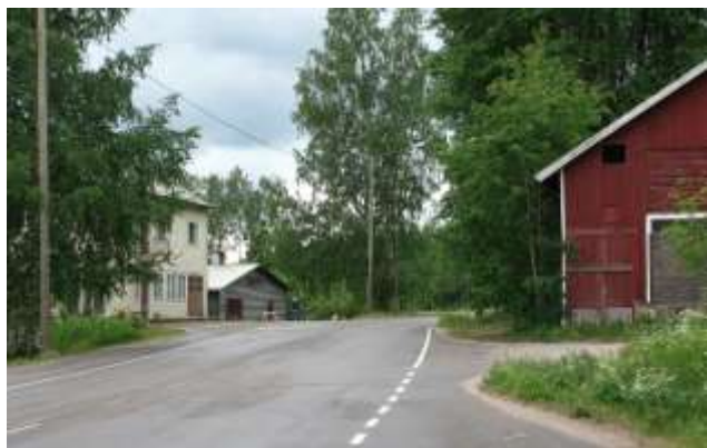
Kuva (vas.): Kaanaantie. Rakennukset oikealta vasemmalle: entinen navetta, saha ja Rippulan asuinrakennus.