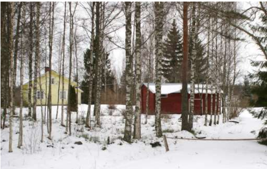
Kuva: Björkbackan talo ja aitta (2014)