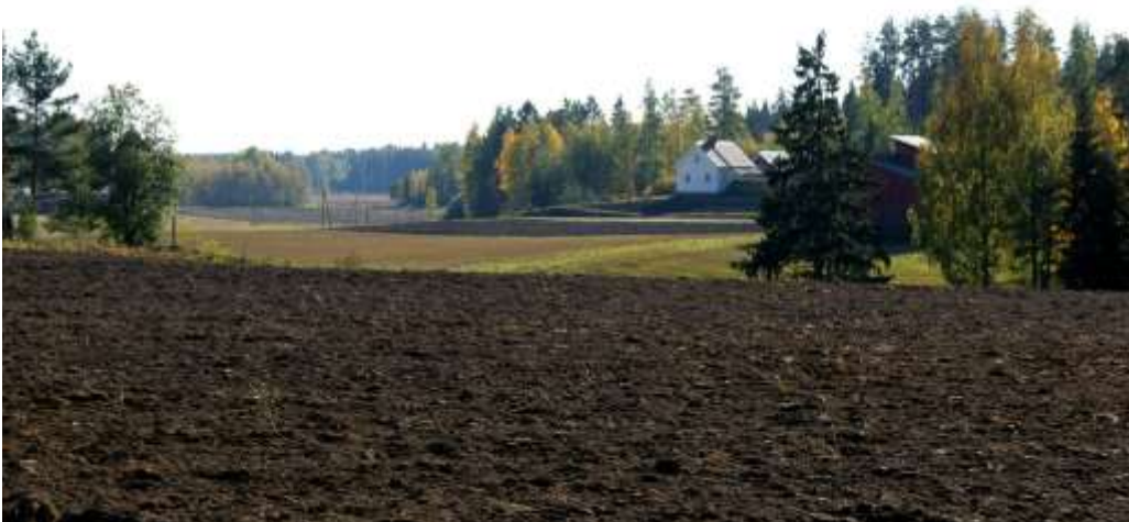
Kuva: Pakkalan pienehkö selkeälinjainen asuinrakennus on eri suunnalta lähestyttäessä maiseman kiintopisteenä.