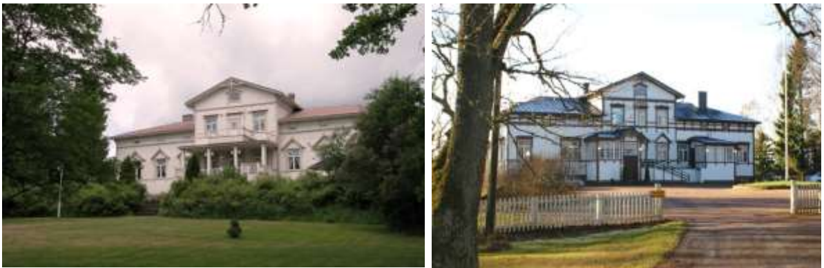
Kuvat: Sälinkään kartanon järvenpuoleinen fasadi v. 2008, ja pohjoisfasadi v. 2013.