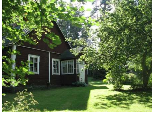
Kuva (vas.): Eskolan päärakennus hopeapajukujan päässä entisen lasitehtaan päärakennuksen tontilla. (2008)