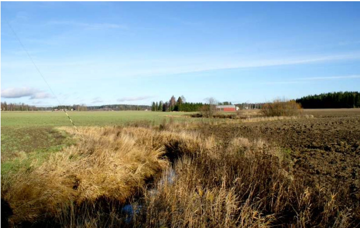
Kuva: Kilpiojan viljelylaakso. Vanhimmat asuinpaikat sijaitsevat vasemmalla selänteiden reunoilla, viime sotien jälkeen perustetut tilat keskellä Kilpiojan varrella.