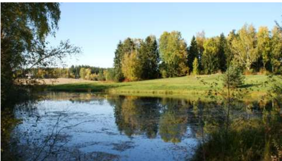
Kuva: Näkymä Ruonansillalta 2000-luvulla toteutetun laskeutusaltaan yli pohjoiseen.