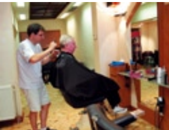
H &amp; N Hairdesign