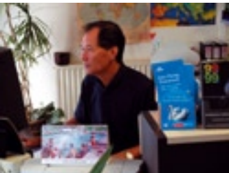
Intimex Travel service