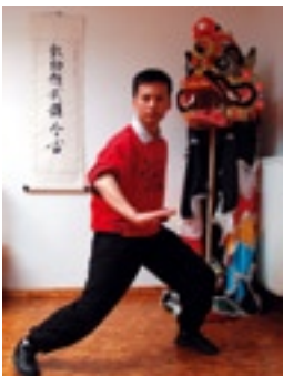
Tith Ngaw Pai

Sinds midden jaren negentig is deze vereniging actief in Antwerpen. Zij organiseert voor de ongeveer 400 Tibetanen in Antwerpen tal van culturele activiteiten. Daarnaast ondersteunt zij haar leden op allerlei vlakken (sociaal, educatief, enz.). Elk jaar zijn er drie speciale momenten: het Tibetaans Nieuwjaar (in februari of maart), de verjaardag van de Daila Lama (6 juli) en de herdenking van de uitreiking van de Nobelprijs voor de vrede aan de Daila Lama (10 december).