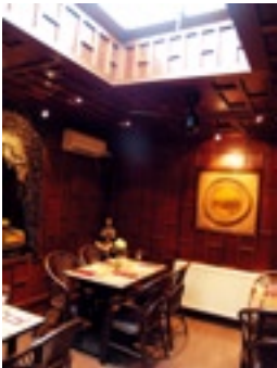
Ploy Pochana Thai

Open van maandag tot vrijdag van 12 tot 15 uur en van 17 tot 23 uur. Zaterdag en zondag van 12 tot 23 uur.