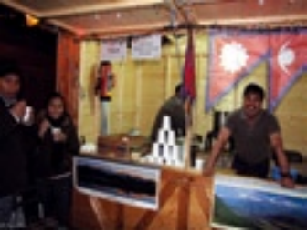
Nepal Belgian Cultural Society