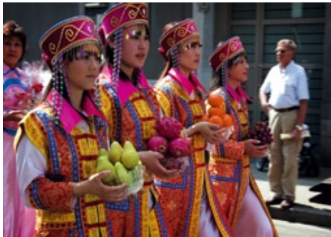
Viering verjaardag van Boeddha

De creatieve benutting van Chinatown sluit naadloos aan bij de toenemende aandacht voor cultureel immaterieel erfgoed. Vlaanderen heeft de UNESCO-Conventionie voor het behoud van immaterieel erfgoed van 2006 goedgekeurd. Op de officiële erfgoed site van Vlaanderen staat: 'Erfgoed gaat ook over de cultuur