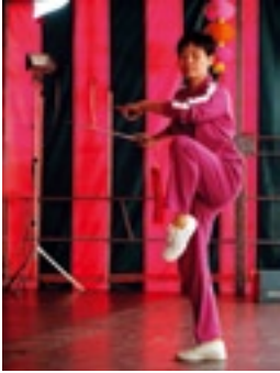
Chinese Vereniging van Fujian