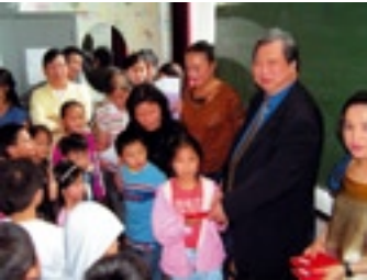
Chinese school van Antwerpen

Er worden lessen Cantonees en Mandarijn (putonghua) gegeven op woensdagmiddag en zaterdagvoormiddag. De school telt gemiddeld 200 leerlingen, die voornamelijk uit Antwerpen komen, maar ook uit andere provincies zoals Vlaams Brabant, West Vlaanderen, Limburg en zelfs uit Nederland.