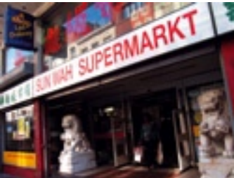
Sun Wah Supermarket

De eigenaars komen van Hong Kong en hebben achttien jaar geleden de winkel geopend. Ze zijn begonnen met de verkoop van diepvriesvoeding voor restaurants maar verkopen nu ook aan particulieren. In hun winkel kunt u allerlei voedsel kopen van China en Zuid-Oost Azië. Hun doelstelling is om hun klanten op de beste manier te bedienen en de best mogelijke producten te leveren.