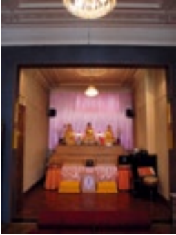
Fo Guang Shan Tempel