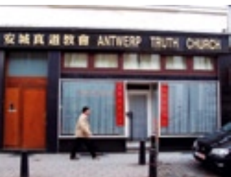
Antwerp Truth Church Belgium

De doelstelling van deze organisatie is om de integratie van de Filippijnse gemeenschap in Antwerpen te bevorderen en de kennis van de Filippijnse cultuur bij Belgen en mensen van andere culturen te verbeteren. De vzw is sinds 2007 actief en organiseert cursussen, culturele activiteiten en workshops. Op 16 mei 2009 organiseerde zij voor de eerste keer een Filippijns feest in Park Spoor Noord onder de naam Flores de Mayo. Het hoogtepunt was een multiculturele bloemenparade.