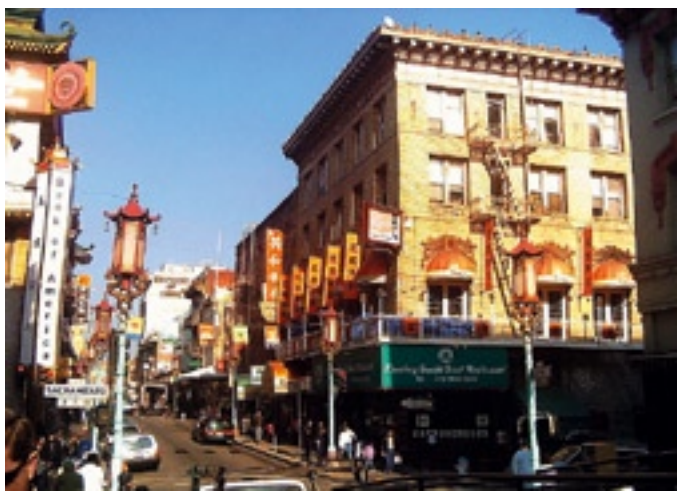
Chinatown San Francisco

Historisch verwijst de term naar de vrijgezelligengemeenschap van Chinese mannen (de bachelor society), die vanaf het einde van de 18de eeuw tot 1952 in de VS verbleven. Het fenomeen van Chinatown als Chinese buurt is het gevolg van een raciaal uitsluitingsbeleid. Chinese arbeiders en avonturiers hadden toen geen recht op het Amerikaans burgerschap. Gedurende zes decennia werd immigratie van Chinese arbeiders aan banden gelegd, alsook familiehereniging en gemengde huwelijken. De verhouding man/vrouw in 1890 was 21/1. Vanaf 1910 tot 1940 weken de meeste Chinezen uit naar de steden, waar ze gedwongen werden tot het kleine ondernemerschap zoals de restaurant- en de wasserijsector. Na de tweede wereldoorlog ontwikkelden ze zich tot immigranten-enclaves, waar naast alleenstaande mannen ook families zich vestigden. Door