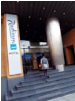
Radisson Blu Astrid Hotel