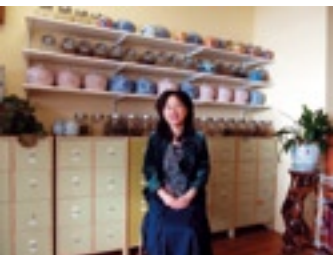
Tao's Acupuncture Center

Sun Wah maakt deel uit van de Rolic Group. Deze brengen elke maand "Rolic News" uit. Een krant met nieuws over mode, technologie, financieel nieuws en cultuur. Diverse Aziatische bedrijven promoten producten in deze krant. De krant is gratis en wordt verspreid in België, Luxemburg en Nederland. Ze is erkend door de Chinese ambassade.