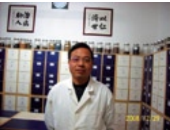
Renji Medical Center

Centraal gelegen in het hart van de stad, tegenover het Centraal Station en de Zoo. Radisson BLU Astrid biedt 247 ruime luxueuze kamers aan, met wireless internet, fitness & health club en parkeergarage. In The Square kunt u genieten van een heerlijk drankje, een snack of gastronomisch diner.