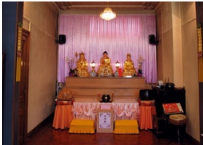
Boeddhistische tempel Fo Guang Shan

Wat deze buurt typeert, naast de bruisende commerciële, sociale en religieuze activiteiten, is de op China geïnspireerde inrichting van de buurt. Na lang onderhandelen tussen de Chinese gemeenschap en het stadsbestuur, werden in 2001 vier handgemaakte leeuwenbeelden aan de Van Wesenbekestraat geplaatst. De vier leeuwen markeren de in- en uitgang van Chinatown en dienen als bewakers van de wijk. Bovendien zijn in datzelfde jaar achttien lampions van 80 cm in de vorm van een draak in de wijk geplaatst.