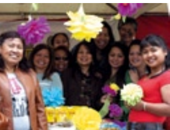
Belgisch Filippijnse Solidariteit