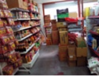
Sun Kwon Trading