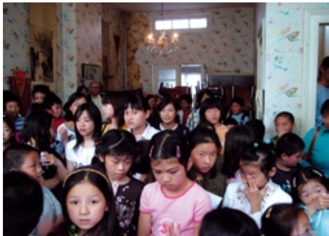
Chinese school met Chinese kinderen, bang wachtend op de resultaten

Sommige schrandere Chinese handelaars hebben toen eethuizen en videotheken geopend uitsluitend gericht op Chinese klanten, die met de familie uit eten gingen op de wekelijkse sluitingsdag van hun zaak of na hun inkoop een restaurant binnensprongen voor een hap, een gesprek en de laatste nieuwtjes uit de Chinese gemeenschap.