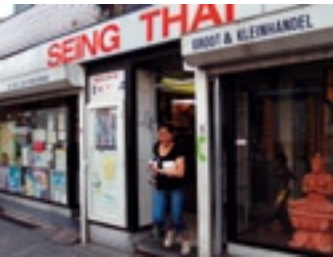
Seing Thai Supermarkt