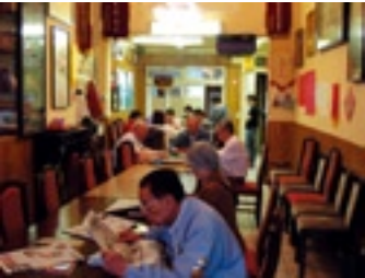
Vereniging van Chinezen in België

De vereniging is opgericht in 1994. De belangrijkste doelstellingen zijn: de belangen van de Chinese handelaars behartigen, het promoten van de Chinese cultuur bij het grote publiek zoals het opzetten van prestigieuze tentoonstellingen van Chinese kunstenaars en een positieve beeldvorming van de Chinese gemeenschap in België nastreven. Verder is de vereniging ook actief in China door het oprichten van scholen, het leveren van financiële bijdrage in geval van nationale rampen, enz.