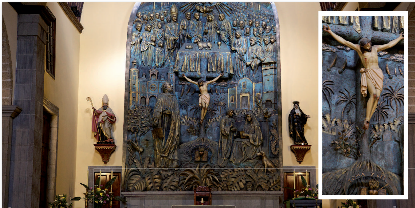
③ Retablo del Altar Mayor.