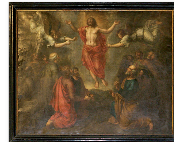
⑦ La Ascensión de Cristo.

Finalmente, el Crucificado fue bendecido en este mismo año. La veneración que desde antaño ha tenido este Crucificado queda patente en la fundación de una cofradía, establecida en el siglo XVI, en la primitiva ermita donde se veneraba el Cristo mejicano anteriormente reseñado. En esta capilla cuelga una pintura flamenca representando la Ascensión de Cristo ⑦, atribuida a Peter van Lint. Este óleo sobre cobre fue realizado en Amberes en la segunda mitad del siglo XVII.