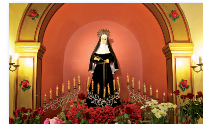
⑧ Santa Rita.

Finalmente, el Crucificado fue bendecido en este mismo año. La veneración que desde antaño ha tenido este Crucificado queda patente en la fundación de una cofradía, establecida en el siglo XVI, en la primitiva ermita donde se veneraba el Cristo mejicano anteriormente reseñado. En esta capilla cuelga una pintura flamenca representando la Ascensión de Cristo ⑦, atribuida a Peter van Lint. Este óleo sobre cobre fue realizado en Amberes en la segunda mitad del siglo XVII.