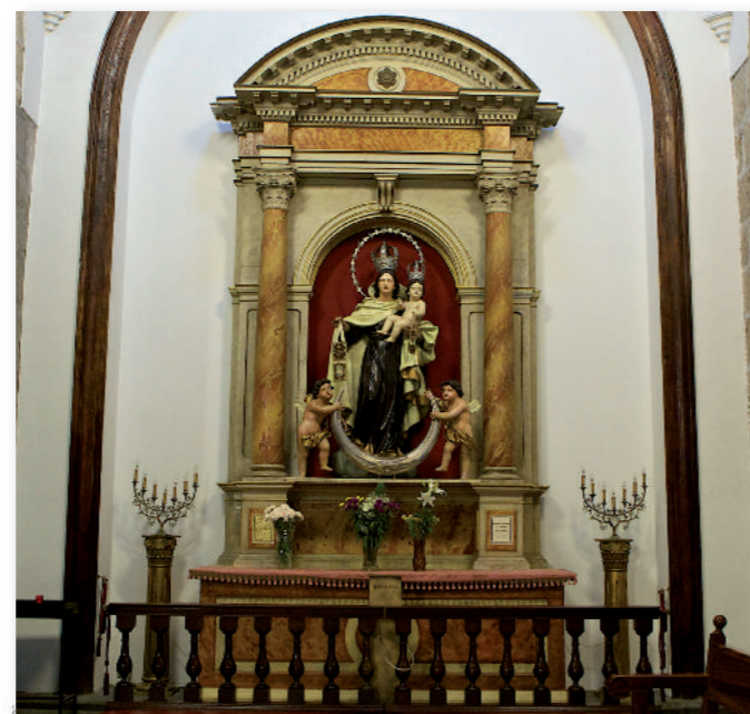
④ Capilla de Nuestra Señora del Carmen.

La capilla de la izquierda ⑤ presenta una mayor sencillez, pudiendo destacar la escultura de Nuestra Señora de los Dolores, conocida como La Genovesa. Esta efigie fue traída a la parroquia capitalina por el militar Andrés Ortega, bajo la advocación mariana de Nuestra Señora del Retiro en el primer tercio del siglo XVIII. Posteriormente, se transformó en Dolorosa con el fin de completar un paso de la Semana Santa para acompañar al Cristo