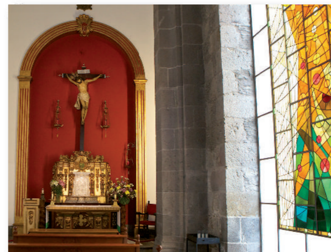
⑥ Capilla del Santísimo.