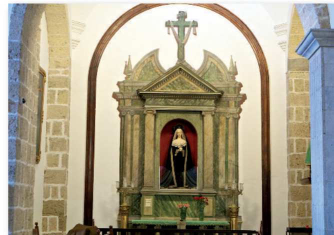
⑤ Nuestra Señora de los Dolores (La Genovesa).