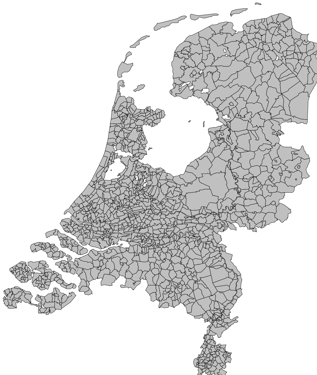
Figuur 2. Nederlandse gemeenten, 1 januari 1820