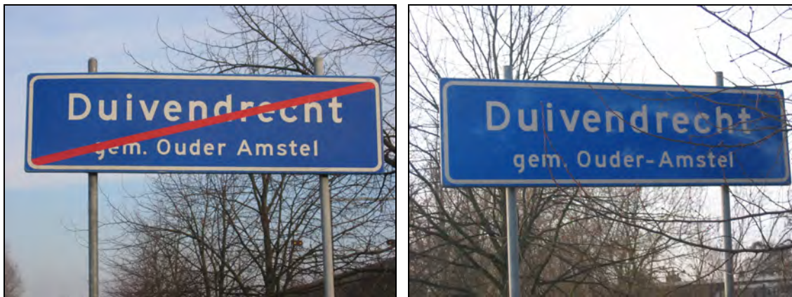
Afbeelding 1. Ouder Amstel of Ouder-Amstel?

Er wordt door enkele geografen en taalkundigen nog steeds wel wat gemopperd over de onduidelijke spelling van aardrijkskundige namen, maar er is feitelijk geen discussie meer over de 'juiste' spelling van geografische namen. De Bosatlas gebruikt vanaf 1955 weer de van oudsher gehanteerde namen. De naamlijsten van het CBS en de namen in wetten en besluiten stemmen al vele jaren vrijwel altijd overeen. Dat wil niet zeggen dat er nooit meer onduidelijkheid is: er zijn enkele raadsbesluiten geweest om definitief de spelling van de gemeentenaam vast te stellen (zie hierna). En soms is men het er binnen één gemeente ook niet over eens... (zie Afbeelding 1).