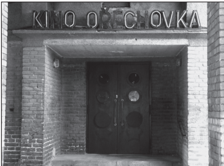
Asi těžko byste hledali v našem okolí někoho, kdo nebyl v kině Ořechovka. Ekonomické problémy a peripetie s penězi biograf zavřely, ale považte: začne se znovu promítat a to v nejbližších dnech! Dobrou zprávu rádi otiskujeme.