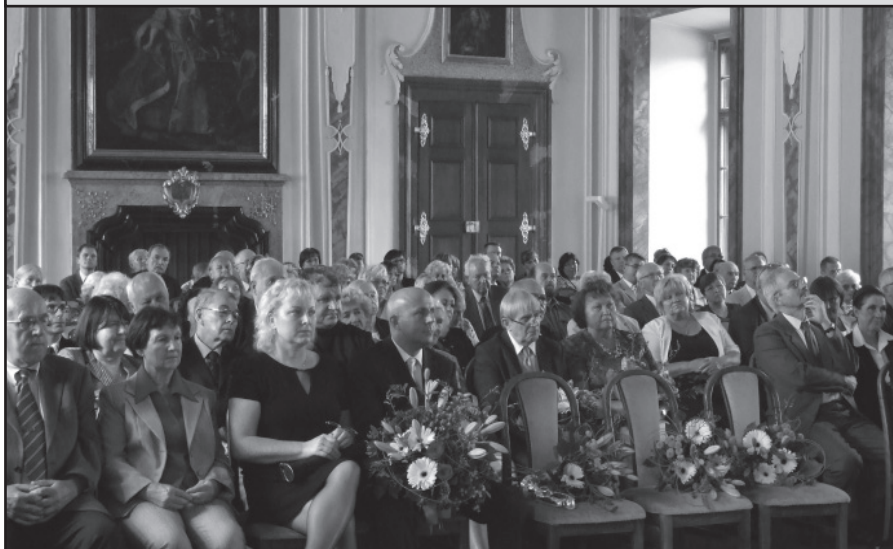
Při předávání Čestného občanství Prahy 6 v Tereziánském sále kláštera sedí v prvních řadách vždy vyznamenaní občané. Tentokrát za tři čs. důstojníky odbojové skupiny Tři králové vyznamenané in memoriam – zůstaly symbolicky tři prázdné židle s kytičí.