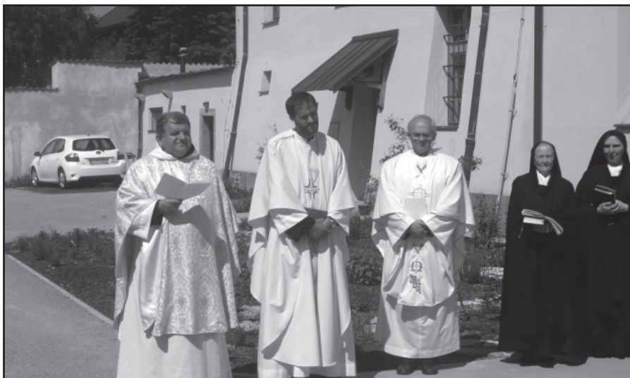
Centrem společenského dění je v našem okolí klášter, farnost v Liboci, ale též na Bílé Hoře, jak dokládá otištěný článek.

● Bělohorské benediktinky spolu s farním společenstvím zorganizovaly atraktivní benefiční koncert Evy Pilarové, jehož výtěžek bude použit pro částečné krytí nákladů spojených s naléhavou rekonstrukcí bělohorského poutního areálu (kostela, ambitů a přilehlých kaplí). Koncert se konal 21. května v refektáři kláštera Na Slovanech (Emauzy). Slavná a oblíbená zpěvačka prokázala, že i po tolika letech zpívá stále velmi krásně. Mistrně předvedla mnoho hitů z dob své největší slávy. Pak poutavě vyprávěla o příbězích ze svých zahraničních turné - a jednu ze swingových písní sedmdesátých let zazpívala dokonce v čínském jazyce. K jejímu vyprávění se připojil i basista jejího „bandu“ a vtípně pohovořil o tom, jak si na jeho nástroji kdysi zahrál sám prezident Václav Havel a na jeho prosbu se mu na něj i podepsal. Slavná zpěvačka pak s velkým úspěchem imitovala známé interprety - na příklad Luise Armstronga i s jeho charakteristickým „chrapláním“. Asi všichni diváci se shodli na tom, že „zlatým hřebem“