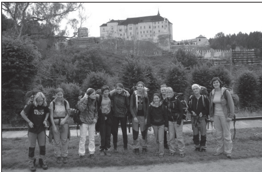
Skauti vrátili se opět z hvozdů spokojeni s pobytem v přírodě. Světlušky z desátého oddílu z Bílé Hory byly v lesním táboře nedaleko Trhového Štěpánova (viz článek Skauting v Praze 6).

● Archeologický park Liboc - Občanské sdružení Archaia, uspořádalo dne 2. září ve svém areálu další akci - ROZLOUČENÍ S PRÁZDNINAMI. Školáci, i ti, které první vstup do školy teprve čekal, vyzkoušeli si zde například tesání klády, tkaní oděvů, střelbu z luku na cíl nebo oblékli opravdické brnění. To vše pod dohledem instruktorů, kteří přidali zajímavě podaný odborný výklad. Činnost Sdružení je zaměřena na praktické ověřování středověkých pracovních postupů