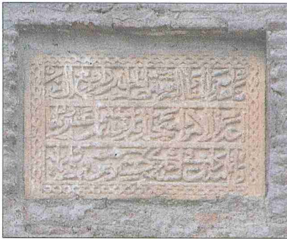
Mihal Bey Hanı ve inşa kitabesi