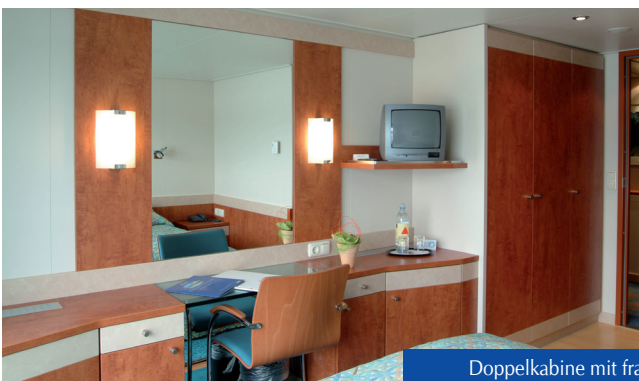
Doppelkabine mit franz. Balkon