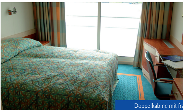
Doppelkabine mit franz. Balkon