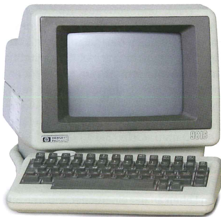
Der Original-Computer, auf dem MicroFe entstand. Mit sagenhaften 9 inch Bild diagonalen, einer 400 mal 300 Pixel Auflösung und einer Speicherkapazität von 128K RAM.

Wassermann: So schwierig war das gar nicht. Ich bin voller Tatendrang in diese Aufgabe eingestiegen. Das Ziel war schon klar: Bauingenieurwesen und Informatik sollten zusammengebracht werden. Oder anders formuliert: Anfang der 80er Jahre wurden die ersten Tischrechner bezahlbar, auch für Ingenieure. Sie wurden gekauft, aber es gab noch so gut wie keine Software für das Bauwesen, die auf diesen Rechnern lief. Und hier sollten Entwicklung und Forschung vorangetrieben werden.