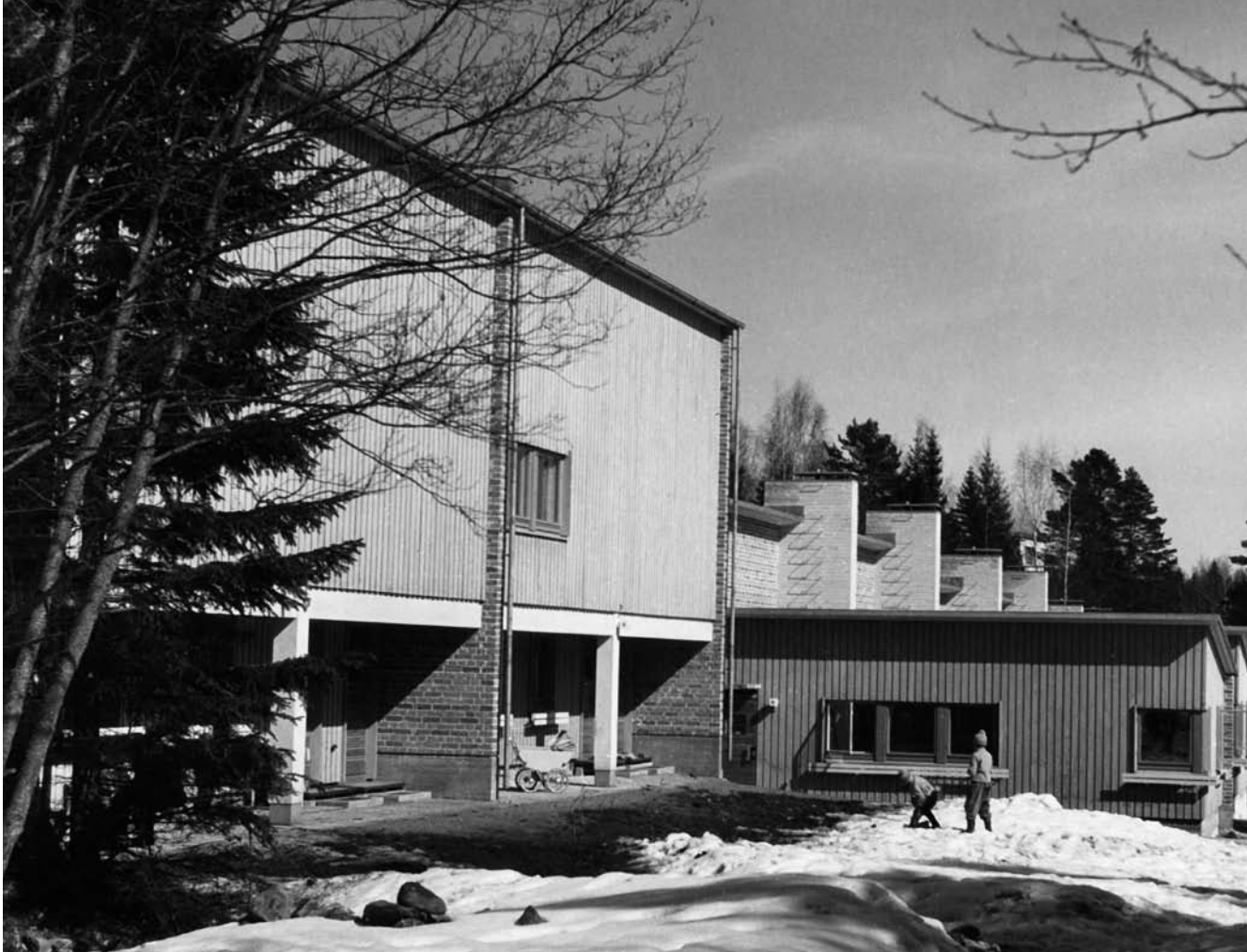
Ateljeeasuintalo Tapiolan Nallenpolulla (1955) oli maan ensimmäinen ateljeerivitalo ja sai seuraajia eri puolille maata.