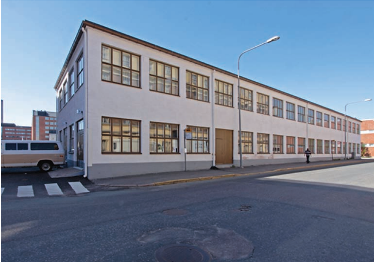
Helsingin Sörnäisten teollisuusalue on kehittymässä nykyaikaiseksi työ- ja asuinalueeksi. Kalasataman taiteilijatalo käynnisti vuonna 2008 kaupunginosan kulttuuritoimijoiden muutostyöt. Kuva Verkkosaarenkadulta.