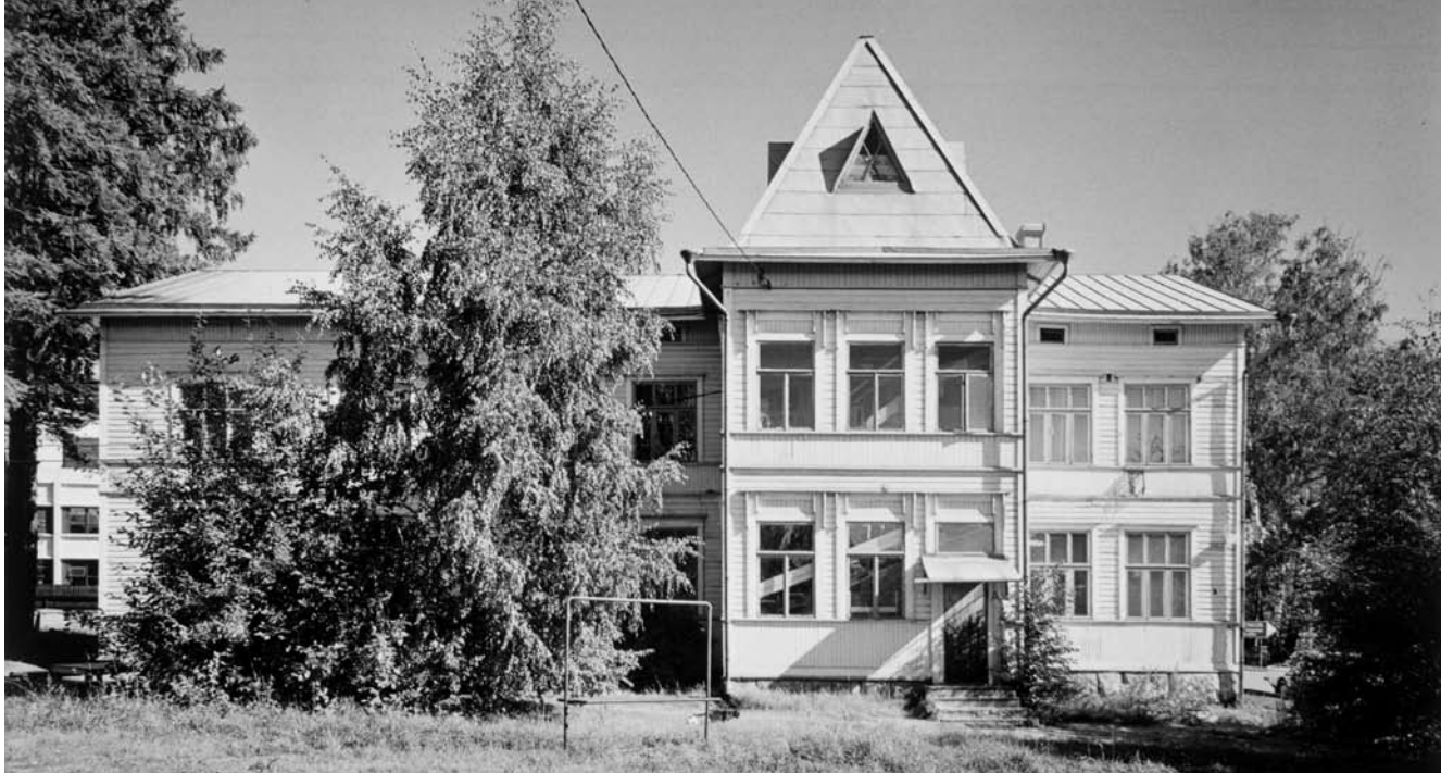
Suomen Taiteilijaseura osti Oulunkylän entisen yhteiskoulun taiteilijataloksi. Boheemin maineen saanut talo palveli taiteilijakäytössä purkamiseensa saakka 1976.

Vuosi 1955 kului taloa rakennettaessa, ja taiteilijat pääsivät muuttamaan taloon joulukuun. Rakennukseen tuli kuusi ateljee-asuntoa, joissa on korkea, parvella varustettu työskentelytila. Asuntoon (50 m 2 ) kuuluu keittiö-olohuone, kaksi makuuhuonetta ja kylpyhuone. Lisäksi talossa on neljä ensisijaisesti työkäyttöön tarkoitettua, isolla parvella ja keittiöllä varustettua ateljeehuoneistoa.