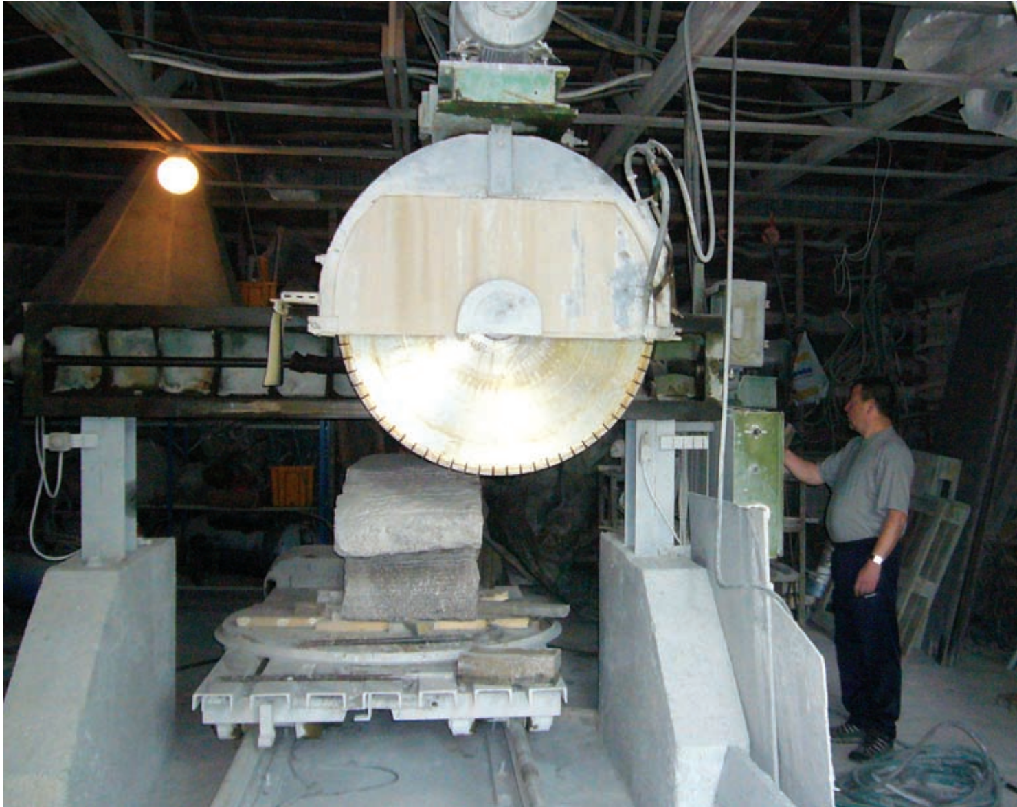
Taidekivenveisto ry ja ateljeesäätiö paransivat Tattarisuon kiviveistämön toimintaedellytyksiä uudella kivisahalla, jota esittelee kuvanveistäjä Matti Nurminen.