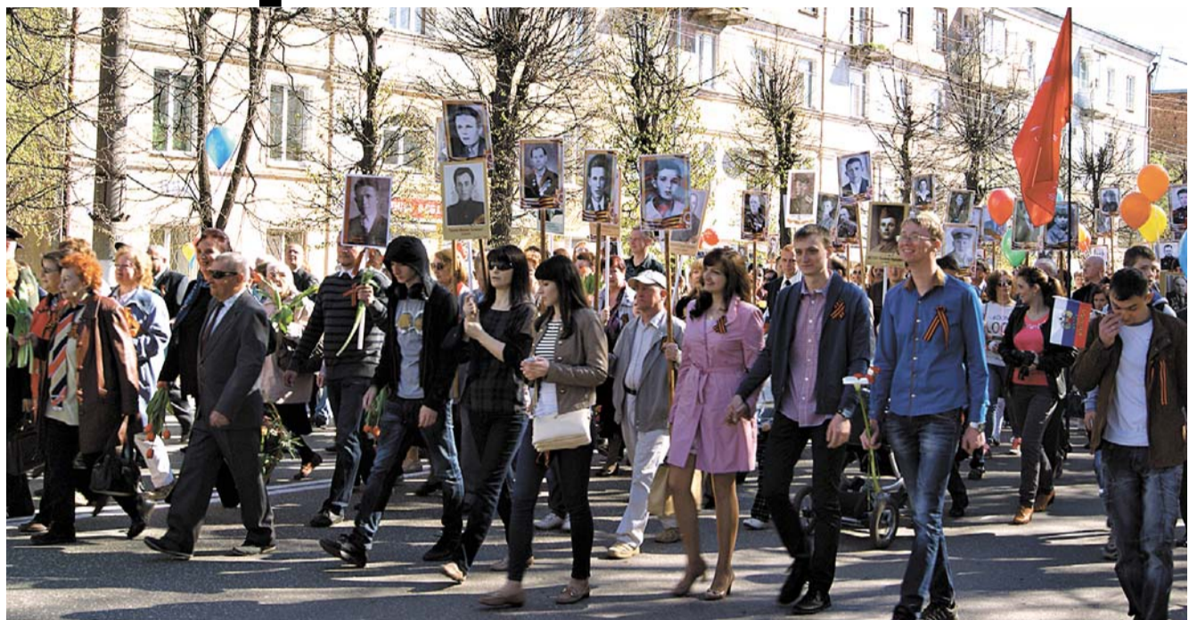
Впереди заводской колонны, как всегда – знаменосцы, за ними – духовой оркестр, ветераны и колонна с портретами участников войны, руководство завода и работники всех подразделений. Заводская колонна заняла практически всю проезжую часть от Дома культуры В. А. Дегтярёва до перекрёстка.

Пусть этот праздник несет немало горечи и грусти, пусть в этот день горожане поминают павших, все же День Победы – великий и радостный праздник. Ведь «никто не забыт, и ничто не забыто»: память, скорбь и благодарность навеки выжжены в наших сердцах.