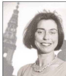
KULTURMINISTER ELSEBETH GERNER NIELSEN

Jeg bliver ofte bedt om at svare på, hvad der er grundlaget for kulturpolitikken generelt. Svaret er, at vi skal sikre udviklingen af kunstnerisk kvalitet. At kulturpolitikken skal understøtte den del af kunst og kulturen, der ikke kan klare sig på markedets vilkår. At det skal ske under hensyn til ytringsfriheden, den kunstneriske frihed, hensynet om at komme hele Danmark til gavn samt hensynet om at alle dele af befolkningen skal inddrages. Det gælder også for musikken.