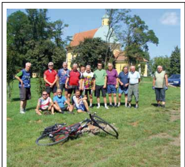
Členové TJ Sokol Český Těšín se ve dnech 19. až 21. srpna zúčastnili cyklistického výletu na jižní Moravu. Zde navštívili různé kulturní památky. Tato akce se uskutečnila za finanční podpory města Český Těšín.