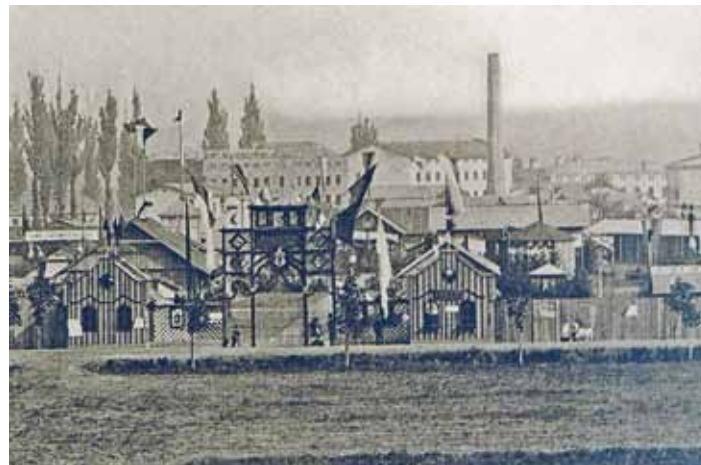
Vedle továrny se v prostoru dnešního autobusového stanoviště v roce 1880 konala II. Zemská průmyslová a zemědělská výstava. Navštívilo ji více než 50 tisíc lidí. Atrakcí bylo první elektrické osvětlení ve městě.