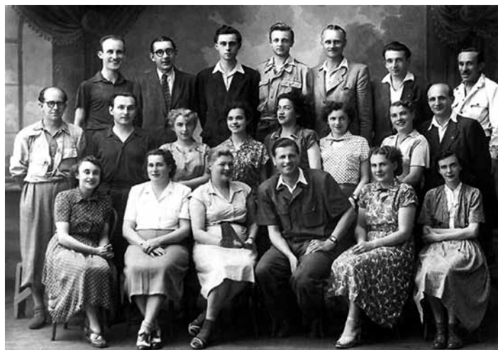
Soubor polské scény Těšínského divadla v sezóně 1951 / 1952.

W ciągu 60 sezonów Scena Polska wystawiła 422 premiery (w sumie 11 012 spektakli), które obejrzało około 3 000 000 widzów. Zespół aktorski liczy obecnie 16 osób, wystawia 6