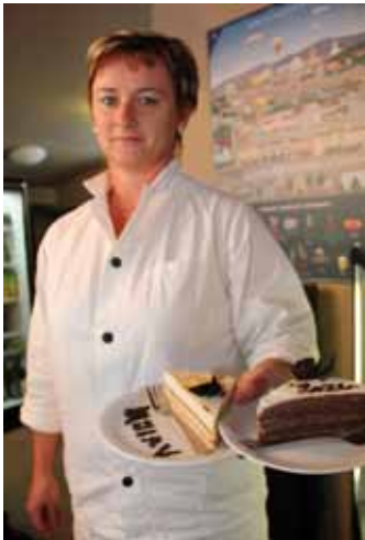
V kavárně Noiva pro vzácné hosty upekli speciální moučnik.