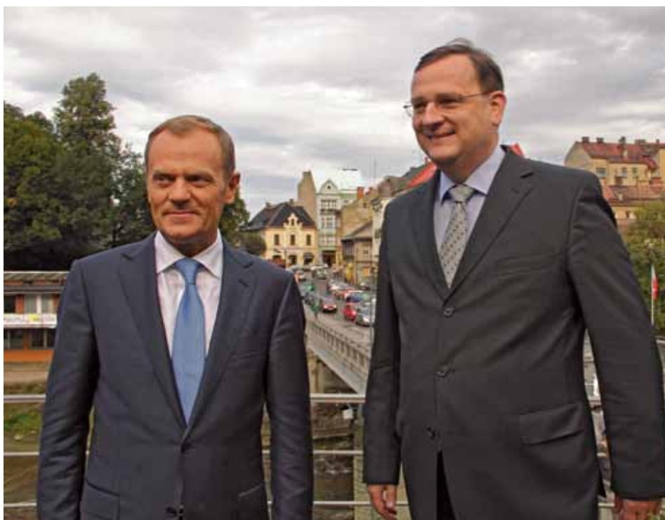
Petr Nečas a Donald Tusk se mohli podívat na Český Těšín a Cieszyn z terasy kavárny Noiva.