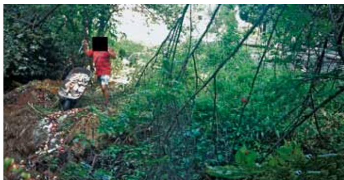
Místo zvěře zachytila fotopast lidí, kteří do přírody vyváželi odpad.

Ve většině případů se našťestí jedná o organický odpad ze zahrádek, který není životnímu prostředí tak škodlivý, ale objevil se zde i případ, kdy byl sypán odpad ze stavby. Naopak na této fotopasti nebyl zjištěn výskyt žádného ze sledovaných druhů savců. Vyvážení odpadů se občané dopustili porušení hned několika zákonů. Jedná se především o zákon č. 185/2001 Sb., o odpadech, zákona č. 254/2001 Sb., o vodách a zákon č. 114/1992 Sb., o ochraně přírody a krajiny. Za uvedený přestupek jim může být uložena pokuta až do výše 50 000 Kč.