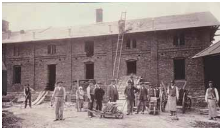
Fotografie zaměstnanců z roku 1900.

Fotografie pocházejí z knihy „Český Těšín. Příběh města na levém břehu řeky“, která vyšla vloni v nakladatelství WART Henryka Wawreczky na objednávku Městského úřadu Český Těšín.