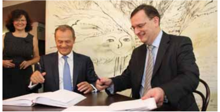
V kavárně Noiva se premiéři Donald Tusk a Petr Nečas zapsali do kroniky.

Po slavnostním puštění plynu do soustavy si oba ministerští předsedové prohlédli hraniční města ze střechy slavné kavárny Noiva, která stojí přímo na hranici, a seznámili se s historií budovy. Poté jednali téměř tři čtvrtě hodiny za zavřenými dveřmi. Podávala se káva a speciální zákusky vymyšlené zdejšími cukráři právě k této příležitosti. „Máme velmi dobré vztahy na úrovni premiér – premiér a těší mne, že si velmi rozumí i starostové obou hraničních měst,“ dodal premiér Nečas, který označil prostory kavárny a čítárny Noiva za velmi vkusné a pěkné. (DH)