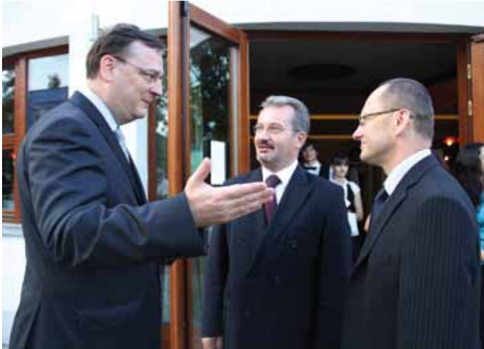
Starosta Českého Těšína Vít Slováček a starosta Cieszyna diskutují s českým premiérem Petrem Nečasem.