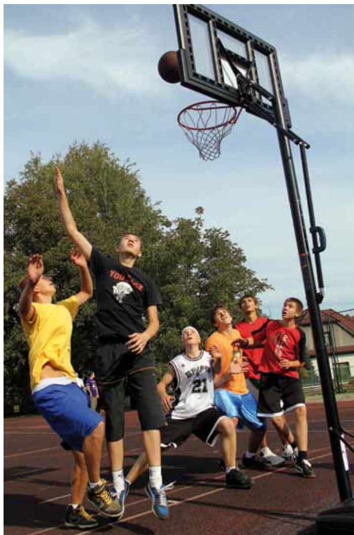
Streetball se mezi mladými těšii stále větší oblibě.

Streetball se často vyznačuje úžasnými smeči. Při tahu na koš se používají triky, které mají obelstít pozornost obránce. Určité porušení pravidel tradičního basketbalu, jako je například nesený balon, se zde vůbec neřeší. Styl je často rozhodujícím faktorem pro to, co je ve streetballu v pořádku, a co není. Jestliže to dobře vypadá, tak to je v pořádku. V tomto smyslu je streetball více o umění se předvést.