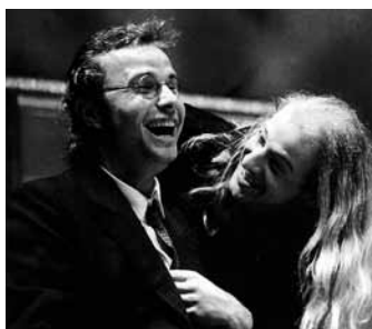
Czczesliwe wydarzenie (1996/1997)