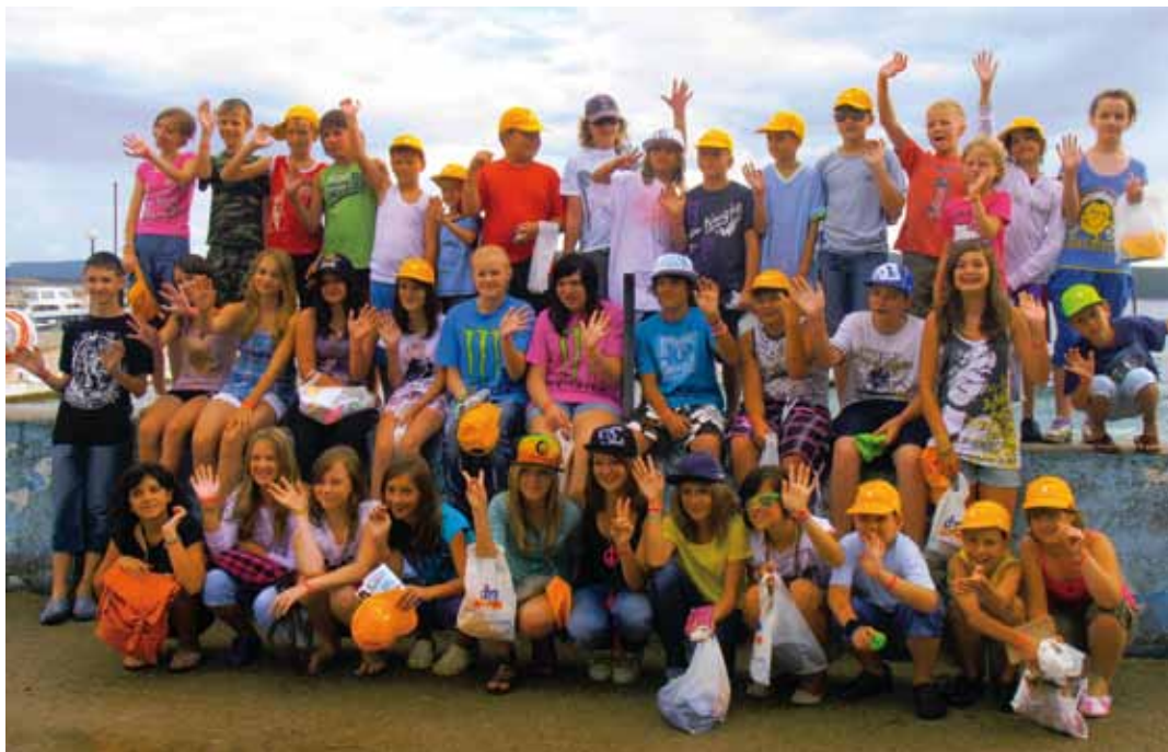
Děti se měly u chorvatského moře opravdu dobře.

V rámci letní hry si děti vyráběly i egyptské oblečení, sportovaly, barvily trika, vyráběly vlajky pro svůj kmen. Samozřejmě, že chodily denně k moři, kde se buď volně koupaly, nebo se mohly zúčastnit různých sportovních soutěží (lovení kameňů, závody na nafukovacích matracích, hry s míčem atd.). Během celého pobytu se prolínaly výtvarné aktivity se sportovními aktivitami.