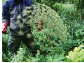
Takhle vypadá květenství bolševníku.

a lokalitu nadále monitoruje. Bolševník velkolepý je rostlina z čeledi miřkovitých, která k nám byla zavlečena v 17. stol. z Kavkazu jako okrasná rostlina zahrad. Postupně unikla do přírody, kde se volně a někde až nekontrolovatelně šíří. Její nebezpečnost spočívá pře-