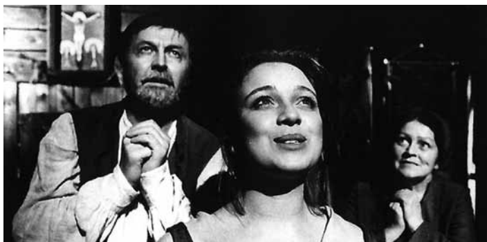
Gość oczekiwany (1996/1997)