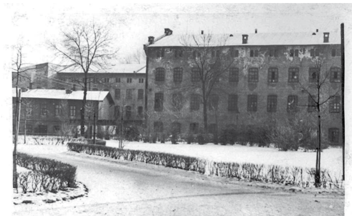
Foto ze sbírek Muzea Těšínska z 50. let 20. století představuje budovu Osevy.

Po těžkých letech krize a po 1. světové válce byla firma velmi zadlužena a nakonec ji v roce 1922 převzala banka. Výrobu v Těšíně zpečetilo rozdělení Těšína mezi Československo a Polsko v roce 1920. O čtyři roky později bylo vedení společnosti přeloženo do Brna. Tehdy byla také v Českém