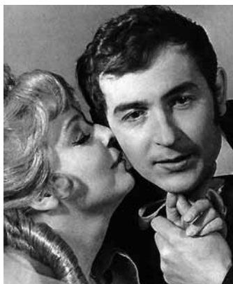
Dama kameliowa (1968/1969)