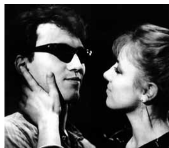
Motyle sa wolne (1985/1986)