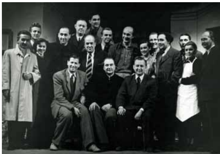
Soubor polské scény Těšínského divadla v roce 1960.