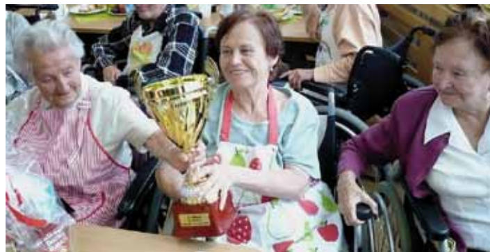
Seniorky získaly na klání vozičkářů pohár.

Dne 16. září odjeli naši uživatelé v doprovodu zaměstnanců na výlet do Dolní Lomné. Podívali jsme se do národopisného areálu Matice slezské, kde se konají Slezské dny. Zároveň jsme navštívili místní muzeum. Nechyběla ani návštěva vyhlášené