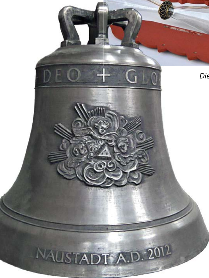
Neue Glocken für Naustadt – Große Glocke mit Glockenzier