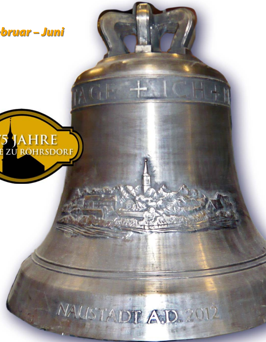
Titel: Neue Glocken für Naustadt – Mittlere Glocke mit Glockenzier Ansicht Naustadt