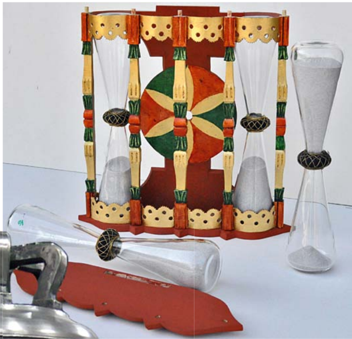
Die Predigt- bzw. Kanzeluhr vor dem endgültigen Zusammenbau. (zum Artikel auf S. 12)