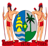
Het wapen van de Republiek Suriname

De Districten van Suriname vormen een bestuurslaag in Suriname . Suriname is sedert de herindeling in 1985, onderverdeeld in tien districten die elk weer verdeeld zijn in ressorten.