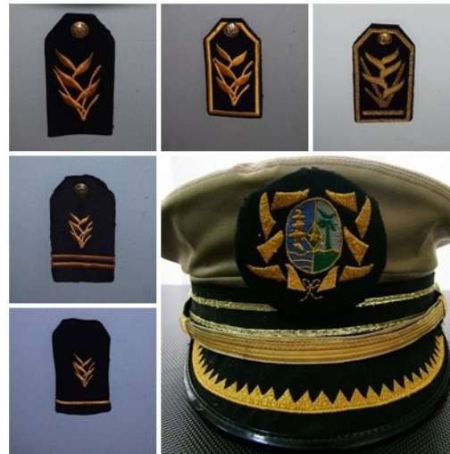
Van onder naar boven de epauletten 2 t/m 6 behorende bij de functies binnen de bestuursdienst. De pet is dat van de DC.

De functie van ABO wordt door de jaren heen niet zoveel meer gebruikt.