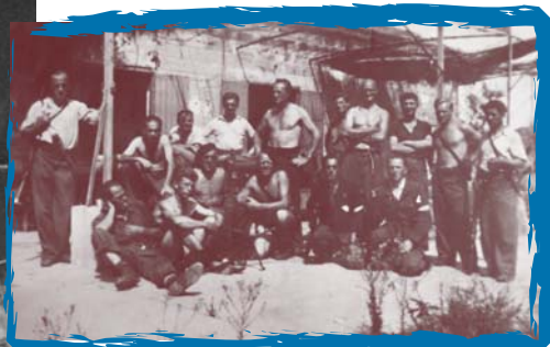
Des antinazis allemands, ayant combattu dans les brigades internationales, dans un maquis de Lozère.