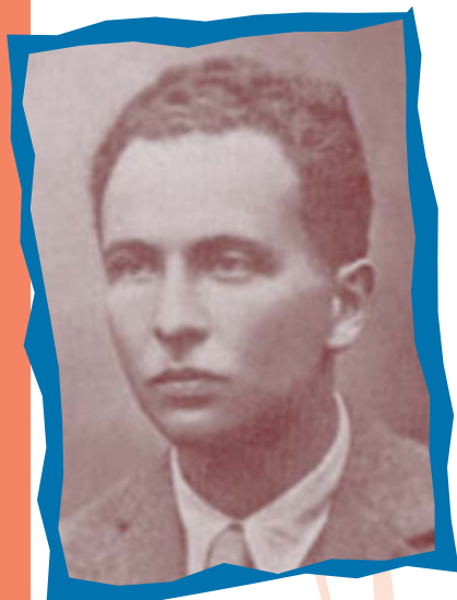
Louis Aragon écrivain, poète français 1897-1982