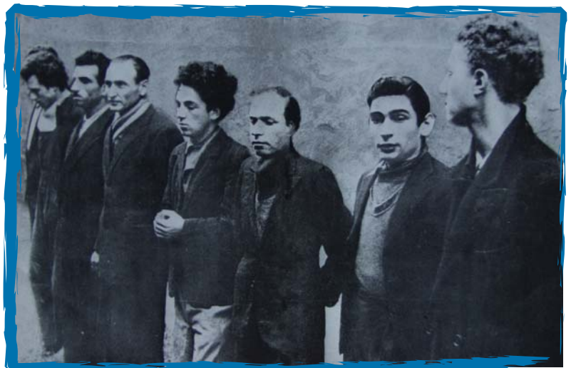
Le groupe Manouchian après son arrestation.