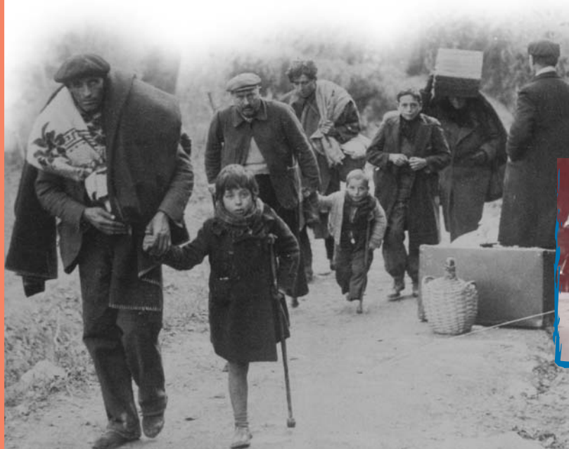
Perpignan 1939. Après la prise de Barcelone par les franquistes, l'exode des Espagnols vers la France s'amplifie (à gauche).