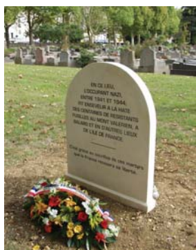
La stèle " Division 40 ".

Un monument à la mémoire des fusillés du Mont-Valérien a été inauguré le 20 septembre 2003. On y relève le nom des résistants de la MOI fusillés le 21 février 1944.