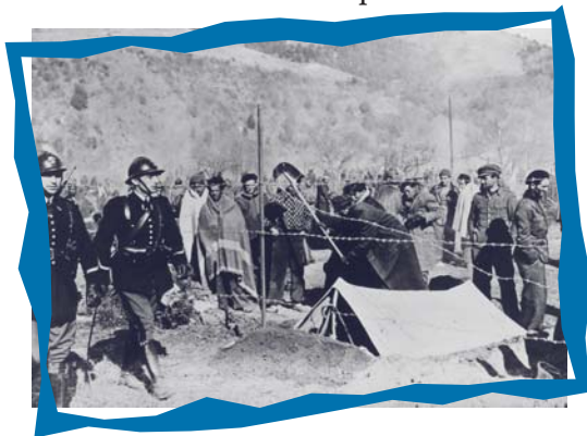
Camp d'Amélie-les-Bains où, à partir de 1939, sont placés sous haute surveillance des combattants républicains espagnols et des brigadistes étrangers.

Lorsqu'en septembre 1939, la France déclare la guerre à l'Allemagne nazie, un grand nombre d'étrangers veulent s'engager au service de l'armée française. D'autres, victimes d'une politique de répression, sont internés dans des camps. Nombreux sont ceux qui rejoignent les rangs de la France libre ou les maquis de la Résistance où ils vont tenir une place très importante.