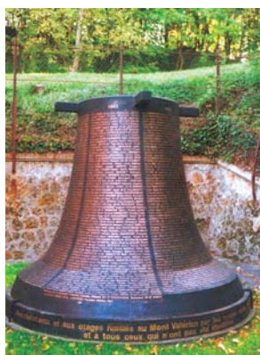
Le monument à la mémoire des fusillés du Mont-Valérien.

Commémoration au cimetière d'Ivry du premier anniversaire de l'exécution du groupe manouchian, 25 février 1945.