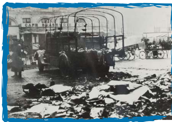
Attentat de la 35e Brigade FTP-MOI contre des convois de transport allemand à Toulouse en février 1943.