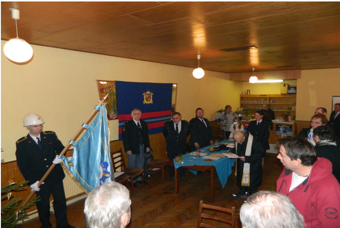
VVH SDH Rozstání 10.12.2011 sál v Domě hasičů SDH Rozstání