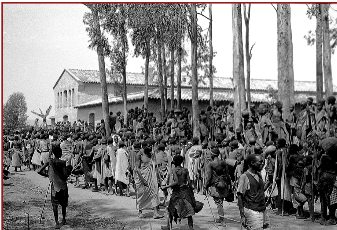
Ci-contre : Distributions de vivres à la mission de Kabgayi, au centre du Rwanda. Ca. 1943-1944.