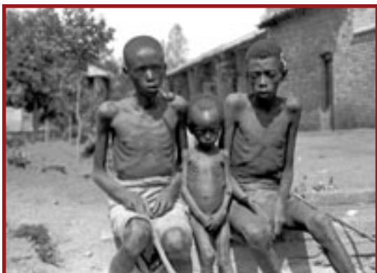
Ci-dessus et ci-contre : photographies d'affamés qui se sont présentés à la mission de Kabgayi pour bénéficier des secours des missionnaires Pères Blancs. (Société des Missionnaires d'Afrique/Pères Blancs, Photos Service, Namur).

seconde nécessité, comme les houes, les habits, les perles, etc., contre des vivres. D'autres en seraient même arrivés à troquer les piliers en bois de leur case pour de la nourriture.