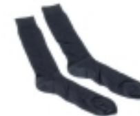
CALCETINES NEGROS (PARA UTILIZACIÓN CON PANTALÓN)