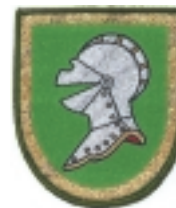
DISTINTIVO DE DESTINO (5)