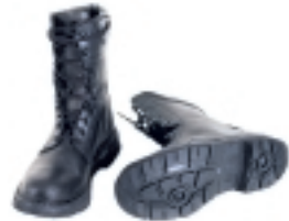
BOTAS IMPERMEABLES TRANSPIRABLES