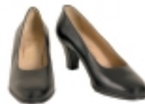
ZAPATOS NEGROS DE TACÓN BAJO