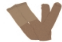
MEDIAS COLOR NATURAL (2)

(1) PANTALÓN CAQUI, CON ZAPATOS Y CALCETINES NEGROS SI SE AUTORIZA U ORDENA (2) DE USO POTESTATIVO