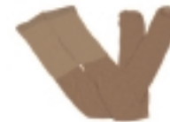
MEDIAS COLOR NATURAL (3)