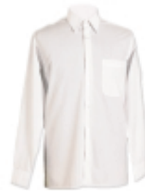
CAMISA BLANCA M/L