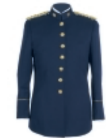
GUERRERA AZUL CON PUÑOS Y TIRILLAS BLANCOS