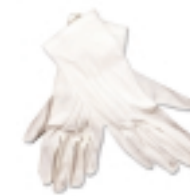
GUANTES BLANCOS (5)