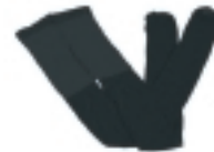
MEDIAS COLOR NEGRO