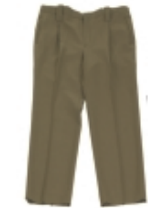
PANTALÓN CAQUI (1)