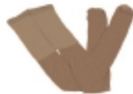
MEDIAS COLOR NATURAL (5)