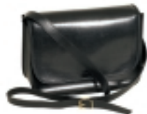
BOLSO NEGRO (3)