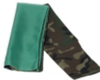
UNIDADES DE MONTAÑA