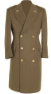
CAPOTE CAQUI (2) (4)