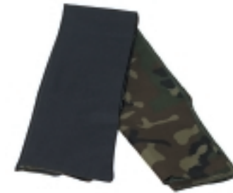
BRIGADA LIGERA AEROTRANSPORTABLE