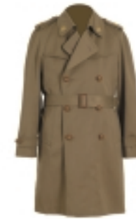
GABARDINA (2) (3)