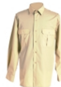
CAMISA AMARILLO GRISÁCEA M/L