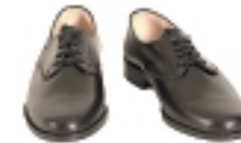
ZAPATOS NEGROS BAJOS