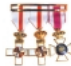
CONDECORACIONES TAMAÑO NORMAL