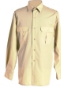
CAMISA AMARILLO GRISÁCEA M/L