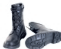
BOTAS IMPERMEABLES TRANSPIRABLES