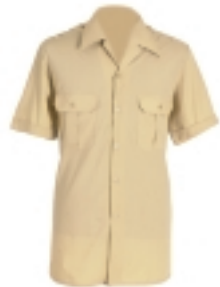
CAMISA BLUSÓN M/C AMARILLO GRISÁCEO