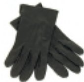
GUANTES NEGROS (3)