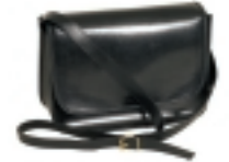
BOLSO NEGRO (3)