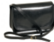
BOLSO NEGRO (3)