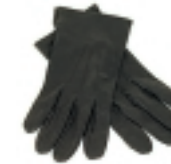
GUANTES NEGROS (3)