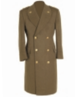
CAPOTE CAQUI (2) (3)