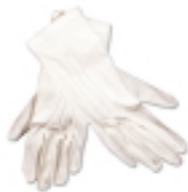
GUANTES BLANCOS (2)