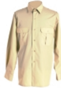
CAMISA AMARILLO GRISÁCEA M/L