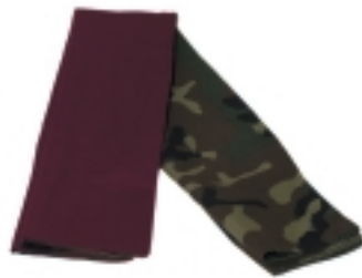
FUERZA DE MANIOBRA