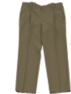
PANTALÓN CAQUI (1)