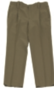
PANTALÓN CAQUI (1)