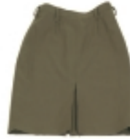
FALDA CAQUI (1)