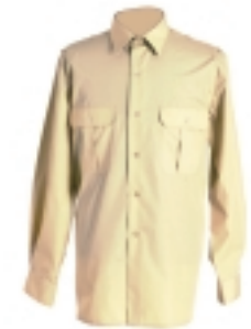
CAMISA BLUSÓN M/L AMARILLO GRISÁCEO