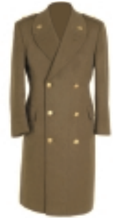
CAPOTE CAQUI (2) (4)