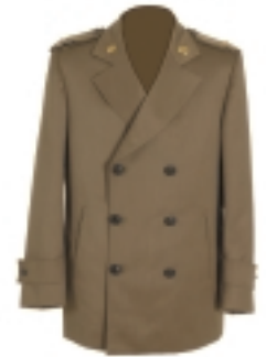
CHAQUETÓN (2) (3)