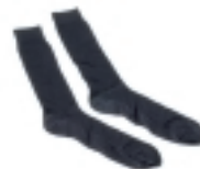
CALCETINES NEGROS (2)