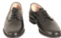
ZAPATOS NEGROS BAJOS