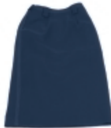
FALDA LARGA AZUL