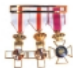
CONDECORACIONES TAMAÑO NORMAL