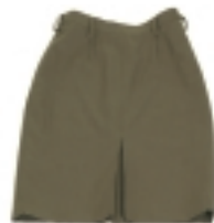
FALDA CAQUI (1)