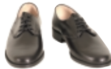
ZAPATOS NEGROS BAJOS