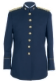
GUERRERA AZUL CON PUÑOS Y TIRILLAS BLANCOS