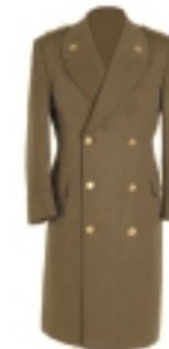
CAPOTE CAQUI (2) (3)