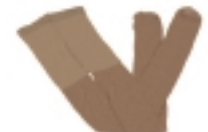
MEDIAS COLOR NATURAL