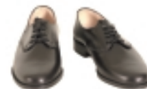
ZAPATOS NEGROS BAJOS (PARA UTILIZA- CIÓN CON PANTALÓN)