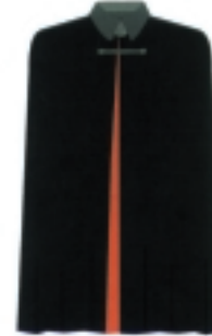
CAPA NEGRA (1)