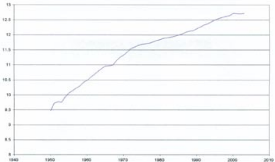
תרשים 1: לוג טבעי של התוצר המקומי הגולמי הריאלי בישראל, 1950-2003

בטרם אדון ביישום הדיון הכללי בנושא לגבי ישראל אציג את העובדות הבסיסיות על צמיחה ואי־שוויון בישראל. תרשים 1 מציג את תוואי הצמיחה בישראל בשנים 1950-2003. התרשים מציג את הלוגריתם הטבעי של התוצר המקומי הגולמי הריאלי (במחירי 1995). בתרשים כזה שיעור הצמיחה הוא שיפוע העקומה. קל לראות מתרשים זה כי בישראל היו שתי מגמות צמיחה עיקריות וכי נקודת השבר ביניהן היא ב־1973. בעוד שבשנים 1950-1973 צמח המשק בשיעור ממוצע של כ־10% בשנה, הרי שמאז 1973 ועד היום צומח המשק בשיעור נמוך הרבה יותר של כ־4% בשנה.