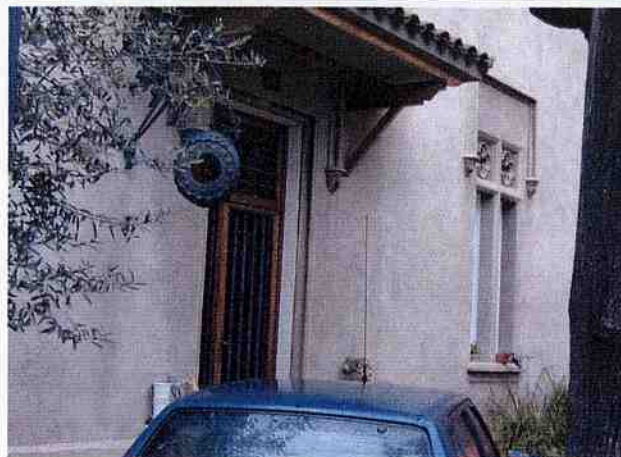
1- Façana al Passeig Cordelles