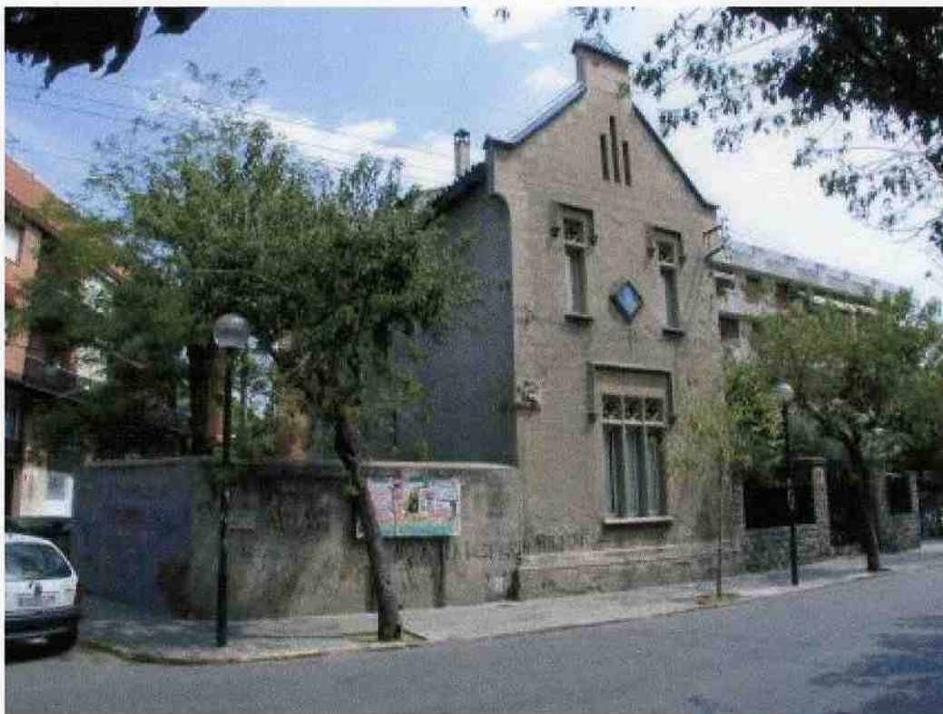
Vista general des del passeig de Cordelles