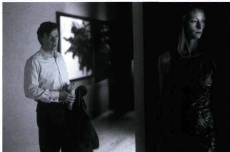
Tom McCamus et Tilda Swinton.

affectionne ce genre de caisson. Or, cette «bonne idée» apparaît comme l'audace pas vraiment convaincante d'un cinéaste aimant jouer avec les formes, mais peu intéressé par le récit.