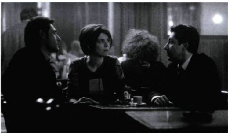
Gérard Lanvin, Agnès Jaoui et Alain Chabat.

sir à transformer complètement le genre? Ou bien qu'à force d'attrition (caricaturaux, les personnages sont petit à petit affinés, dégrossis), elle laminait tant son film qu'il ne laisse à la fin qu'un goût éventé à la bouche, tout en vous communiquant l'état dépressif dans lequel il se moule? Curieux film sur les préjugés, qui dit qu'on ne doit pas considérer les gens sur leurs apparences. Film inclassable, plein de finesse mais manquant d'épaisseur, honnêtement manipulateur, prenant des risques calculés, au scénario très ouvragé, à la direction d'acteurs impeccable, qui se situe quelque part entre le cinéma grand public et le cinéma d'auteur. Cet entre-deux lui donne son intérêt et ses limites. (Fr. 1999. Ré.: Agnès Jaoui. Int.: Jean-Pierre Bacri, Anne Alvaro, Alain Chabat, Agnès Jaoui, Gérard Lanvin.) 112 min. Dist.: Les Films Séville. — A.R.