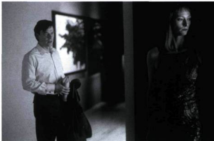
Tom McCamus et Tilda Swinton.

affectionne ce genre de caisson. Or, cette «bonne idée» apparaît comme l'audace pas vraiment convaincante d'un cinéaste aimant jouer avec les formes, mais peu intéressé par le récit.