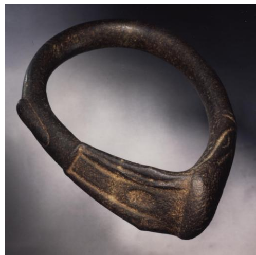
Jou. Diorita verda. Cultura totonaca. Veracruz, Mèxic. 600 - 1200 dC 13 x 35 x 40 cm