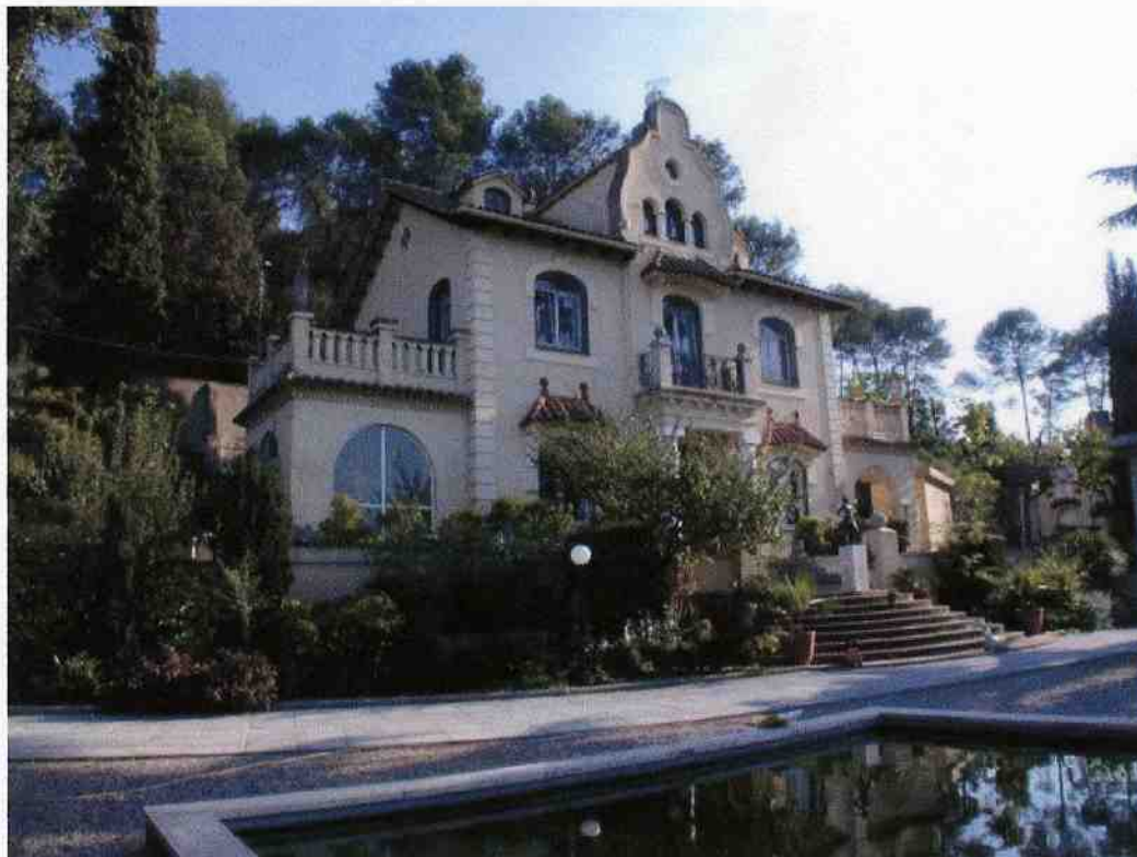
Vista des del nord

Generalitat de Catalunya (Octubre, 2001) Departament de Política Territorial i Obres Públiques Direcció General d'Urbanisme Comissió Territorial d'Urbanisme de Barcelona Ajuntament de