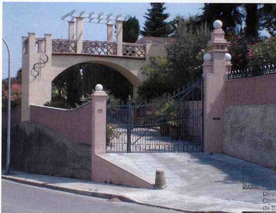
1,2- Mirador 2,3- Capella 4- Tanca (Octubre, 2001)

Generalitat de Catalunya Departament de Política Territorial i Urbanisme Direcció General d'Urbanisme Comissió Territorial d'Urbanisme de Barcelona