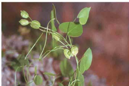
>> Pie femenino