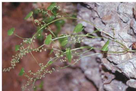
>> Pie masculino