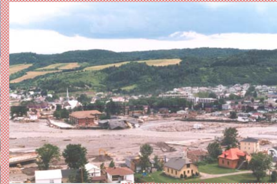
Durant le déluge