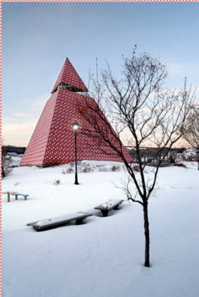
La pyramide en hiver