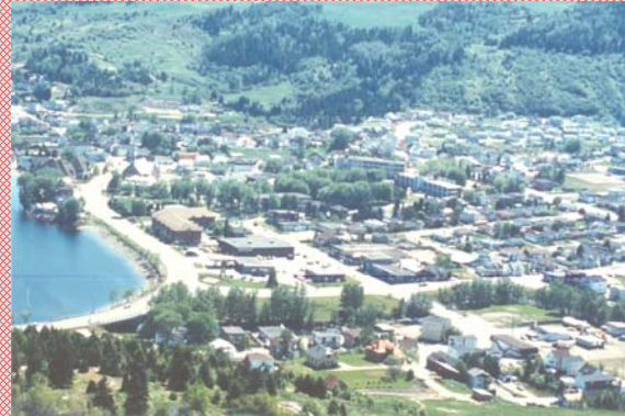
Avant le déluge