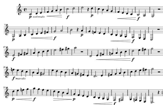
Figura 3: Partitura.