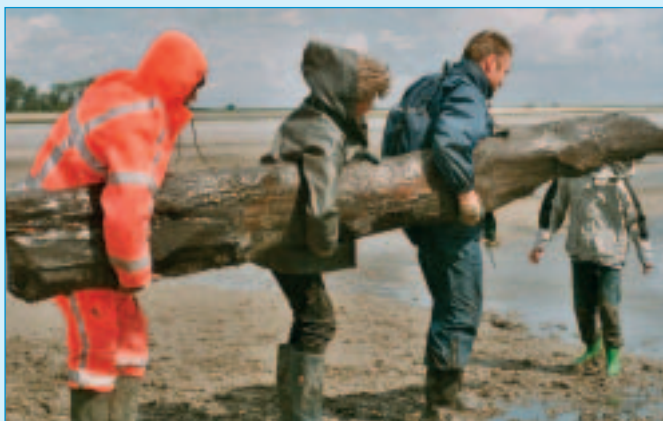
BerGING van een houten duiker bij het verdrongen Rilland (2004, AWN).

Het ringdorp Valkenisse, gesticht eind twaalfde eeuw en verloren gegaan in 1682, is archeologisch gezien Zeelands belangrijkste verdrongen dorp. Het ligt vóór de schorren van Waarde, aan de noordkant van de Westerschelde. Vanaf circa 1990 vindt meer dan tien jaar onderzoek plaats. Valkenisse is nu wettelijk beschermd als archeologisch monument, maar ook fysiek door middel van strekdammen. Uniek voor Nederland! Het zo goed mogelijk in kaart gebrachte dorp rust onzichtbaar onder een dikke laag beschermend slik.