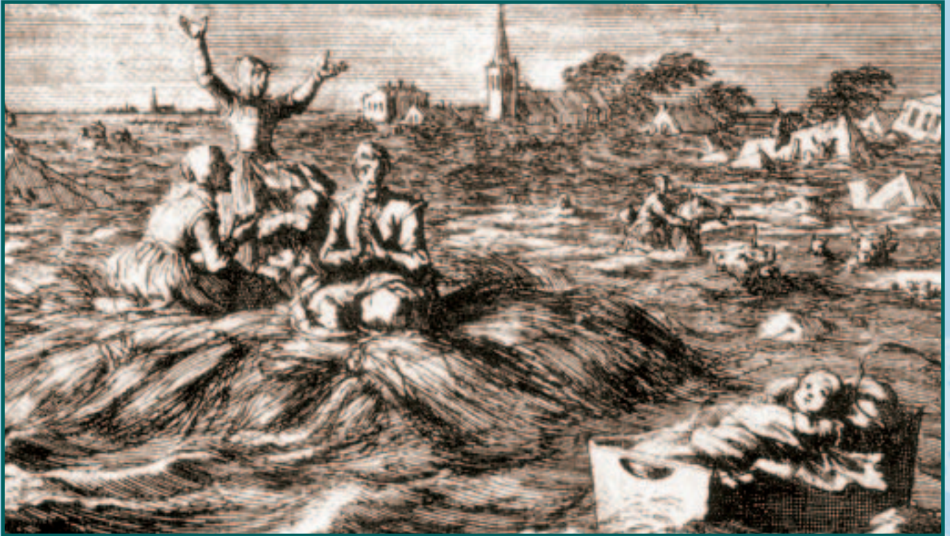
Illustratie van de vloed van 1682 in zuidwestelijk Nederland en 1686 in Groningen (zeventiende-eeuwse gravure van Jan Luyken). Het kind in de wieg rechts op de voorgrond verwijst naar een eeuwenoud verhaal over een wonderbaarlijke redding.

Het Zeeuwse kleigebied telt naar verhouding de meeste verdronken nederzettingen van Europa. Behalve de provincie Zeeland omvat dit gebied de Zuid-Hollandse eilanden, de Rotterdamse Maasregio en een deel van Noord-Brabant. De meeste verdronken dorpen liggen binnen de Zeeuwse provinciegrenzen. We tellen in Zeeland minstens 117 verdronken kerkdorpen, naast vele tientallen verdronken buurtschappen en kapeldorpen.