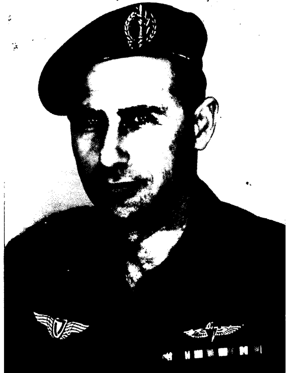
ראש אמ"ן – קבעה ועדת אגרנט – אימץ לעצמו את הקונספציה, שבנוקשותה המיתה את הפתיחות הדרושה ואת הנכונות להתמודד תמיד מחדש עם המידע שזרם

כי לאור מסקנותיה של ועדת כהן עלול גם עיוות מוסרי בפעילותו של קצין המודיעין לבסס את אחריותו.