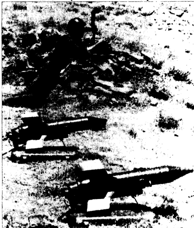
המידע על טילי ה"סאגר" הופץ, אך למרות זאת הלוחמים הופתעו

ולחביא זאת בפני אלוף הפיקוד ובפני אמ"ן. 62 הנה כי כן, ייתכן שיש גם בכך כדי ללמד על החובה להביא את הספקות גם בפני צרכני המודיעין. אם אכן כך, הרי שאיש המודיעין הבכיר, היודע על דעה הסותרת את הדעה המקובלת, אינו יכול להסתפק בדחייתו בתוך גופי המודיעין. אם דעה זו אינה נסתרת בתונום, הרי שהיא דעה "קבילה", שיש להעלותה בפורומים המתאימים. 63 החובה להתייחס למידע בפתיחות עניין אחר, שיש לעסוק בו בהקשר לכללי ההתנהגות הצריכים להנחות את קצין המודיעין, הוא הצורך להתייחס למידע בפתיחות מקסימלית. בהקשר זה ראוי להזכיר כי אחד המושגים העיקריים שתרמה ועדת אגרנט ללקסיקון הציבורי הישראלי הוא "קונספציה", שהפך לשם גנאי המציין קיפאון מחשבתי. כך, למשל, קובעת הוועדה כי ראש אמ"ן: "אימץ לעצמו את הקונספציה, שבנוקשותה