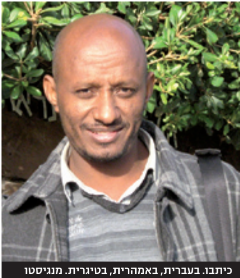
כיתבו. בעברית, באמהרית, בטיגרית. מנגיסטו

השאיפות שלכם, והן את ההתלבטויות והקשיים שלכם בלימודים ובחיי היומיום, או כל דבר העולה על דעתכם.