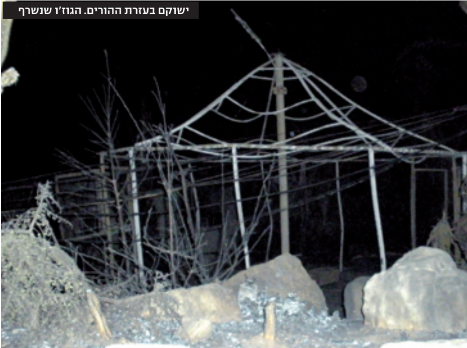
ישוקים בעזרת ההורים. הגו'ו ששרף