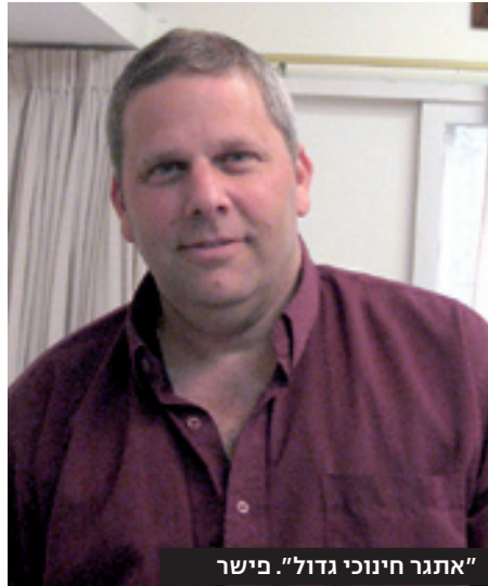
"אתגר חינוכי גדול". פישר

גורר בימין אורה. ביתו נשרף כליל. שגאו: "ביום חמישי, כשאמרו לנו לעזוב את הכפר, אמרתי לאשתי לקחת את הילדים למשפח