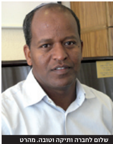
שלום לחברה ותיקה וטובה. מהרט

היא מכהנת כמנצחת ופסנתרנית ב"בית הספר למוזיקה" של תל אביב, וב-2009 סיימה תואר שני במוזיקה באוניברסיטת תל אביב. היא מכהנת כמנצחת ופסנתרנית ב"בית הספר למוזיקה" של תל אביב, וב-2009 סיימה תואר שני במוזיקה באוניברסיטת תל אביב.