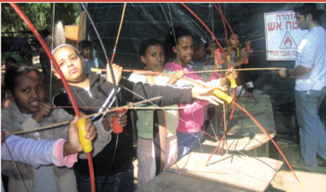
ילדי הדרום מכיפים באתגרים

מרכז ההיגוי והאגודה לקידום החינוך נתנו לקהילה להרגיש שהם לא לבד בזמן המלחמה