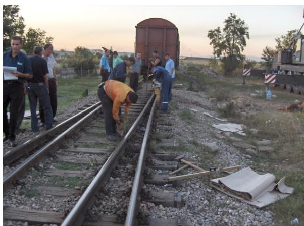
Mirëmbajtja e infrastrukturës