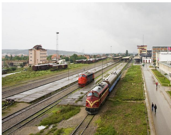
Qasia në infrastrukturën hekurudhore