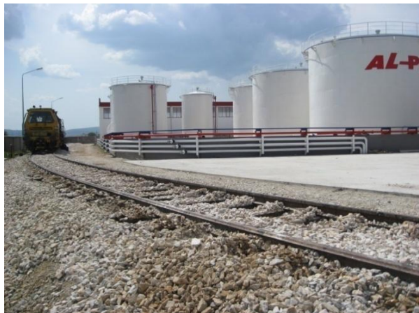
Ndërtimi i binarëve industrial privat