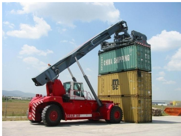
Shërbimet e terminalit