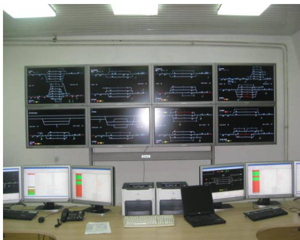
Menaxhimi i trafikut hekurudhor