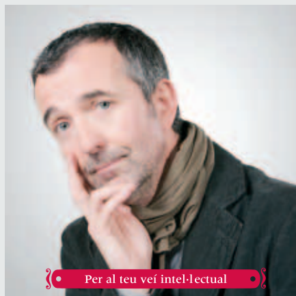
Per al teu veí intel·lectual