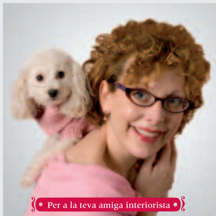
Per a la teva amiga interiorista