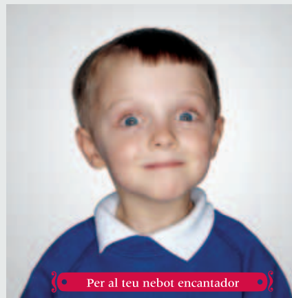
Per al teu nebot encantador