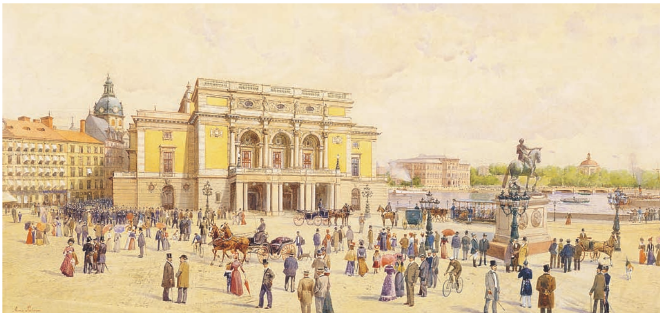
Nya Operan och Gustaf Adolfs torg. Målad i Frankrike efter fotografiska förlagor. Akvarell, omkring 1898