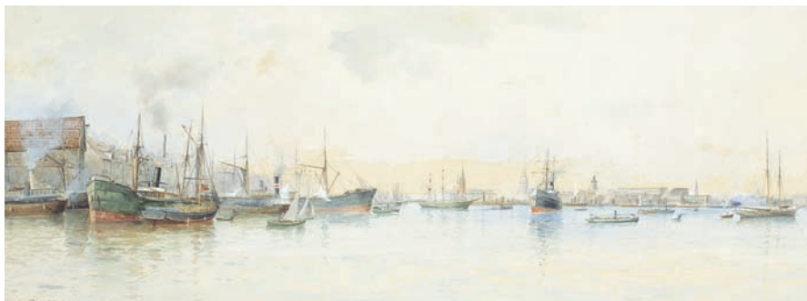
Stockholms inlopp med Gamla stan i fonden. Till vänster ses engelska lastångare som lossar stenkol längst ut på Stadsgården. Akvarell, omkring 1890, SSM.