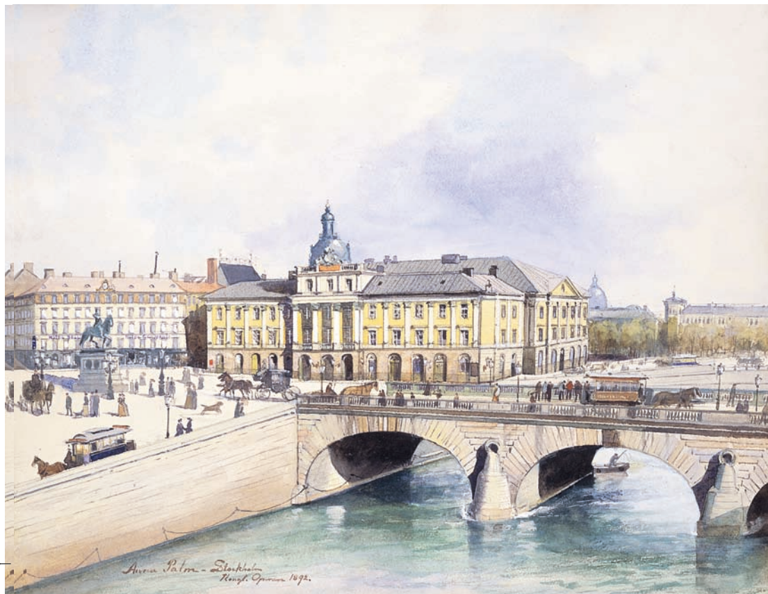
Gamla Operan och Gustav Adolfs torg, «målad directe efter naturen». Akvarell, 1892, SSM.