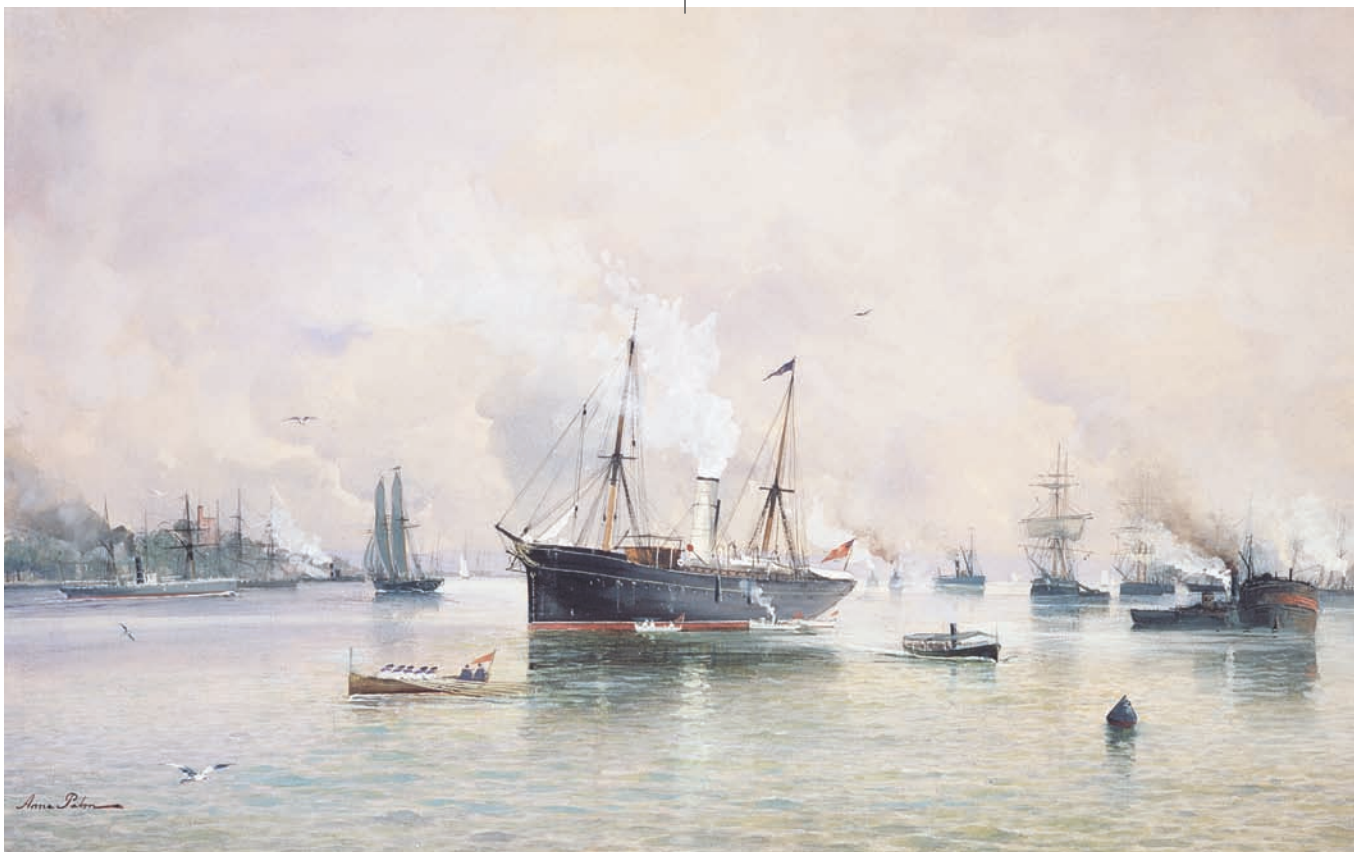
Fartyg på Strömmen. Till vänster skymtar Skeppsholmen och Kastellholmen. Akvarell, omkring 1890, SSM.