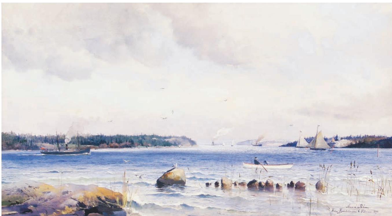
Stockholms inlopp österut från Fjäderholmarna. Akvarell, daterad 6 feb. 1890, SSM.