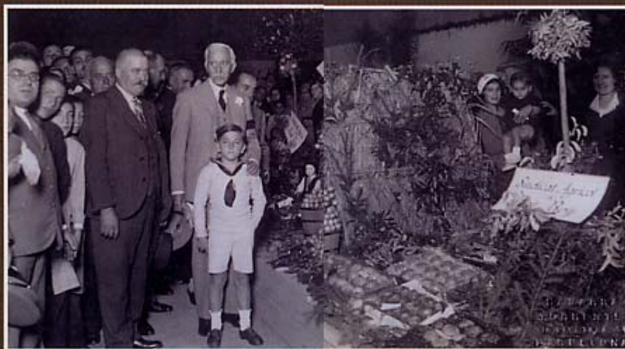
El President Macià visitant la mostra exhibida pel Sindicat Agrícola de Sant Boi.