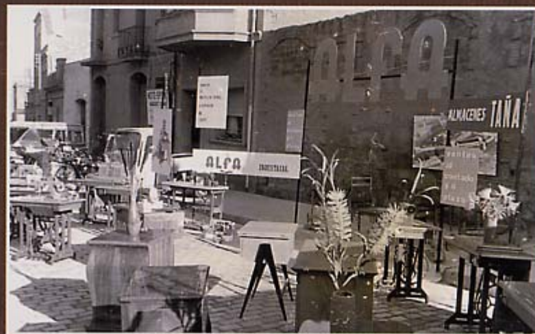
Els complements de la llar van irrompre amb força a les edicions dels anys 60.