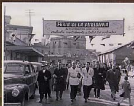
Les autoritats camí de l'Ateneu Santboià a l'any 1951.

La responsabilitat organitzativa de les primeres edicions de la Fira va recaure, de forma exclusiva, sobre els membres de la «Hermandad Sindical». A les diverses edicions, i de forma puntual, s'incorporaren actes organitzats per les entitats culturals i esportives locals. La fira tenia, com a principals escenaris, la Rambla, la plaça de l'Ajuntament, l'avinguda de Maria Girona i el carrer de l'estació.