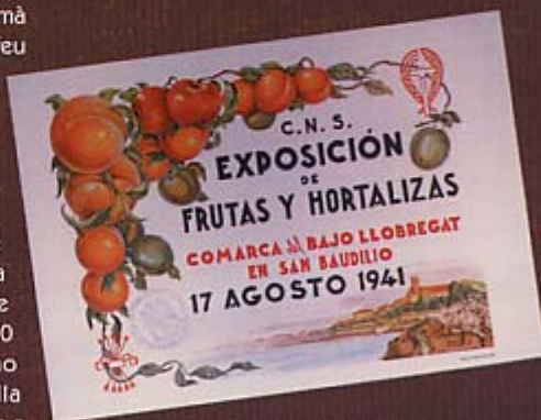
Propaganda de 1941