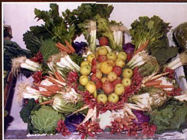
Un exemple de composició artística a l'Exposició de Fruites.

Cal dir que la Fira havia passat de comptar els visitants en milers -en els seus inicis- a desenes de milers -al llarg dels anys