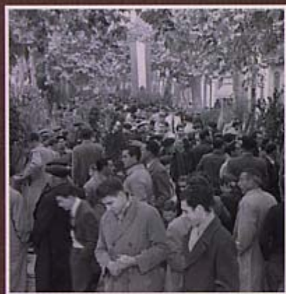
El públic visitant la Fira de Planters a la Rambla.