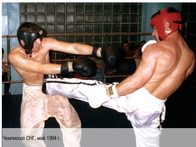
Чемпионат СНГ, май 1994 г.

Многие судьи сами «родом из спорта» и несправедливость прочувствовали на себе, а этого порой достаточно, чтобы не допустить такого в отношении других.