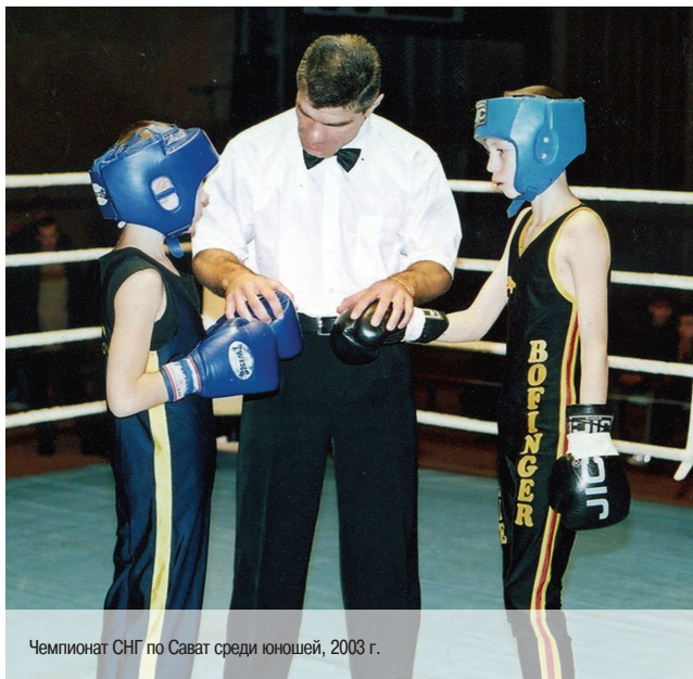
Чемпионат СНГ по Сапат среди юношей, 2003 г.

— Нет. Самый сложный был первый, в 1993 году в Венгрии. Уже в 1/4 финала мне довелось встретиться с Чемпионом Мира по тхэквондо.