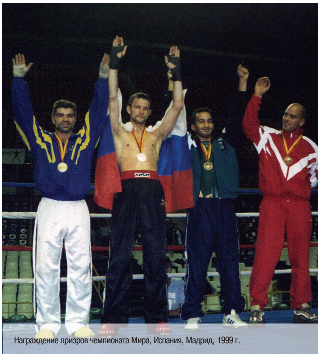
Награждение призов чемпионата Мира, Испания, Мадрид, 1999 г.

— В 1999 году Чемпионат Мира в Испании. Встретились с канадцем, затем с выходцем из Средней Азии и в финале с россиянином — победили, став чемпионом, несмотря на перелом. Или это как раз то, что называется «победил одной левой»?