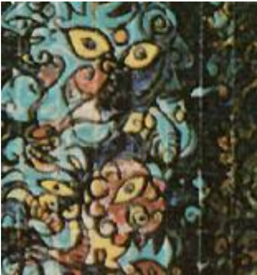
Udsnit af facade på C H Petersens museum.

Plakater og kunstkort henter inspiration i storbyen gerne udlevet i nattens neonlys, hvor iscenesættelsen fører billedfortællingerne ud i livet, de er stærkt grænseoverskridende, og billederne er splittet ad (dekonstruktivisme) og herefter sammensat på en utraditionel måde for således at fange iagttageren og tvinge denne til at forholde sig som aktiv spiller af budskabet (hvad er budskabet?).