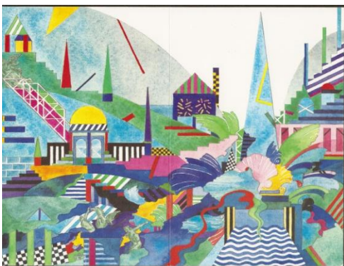
Plakat af Ernst Lohse