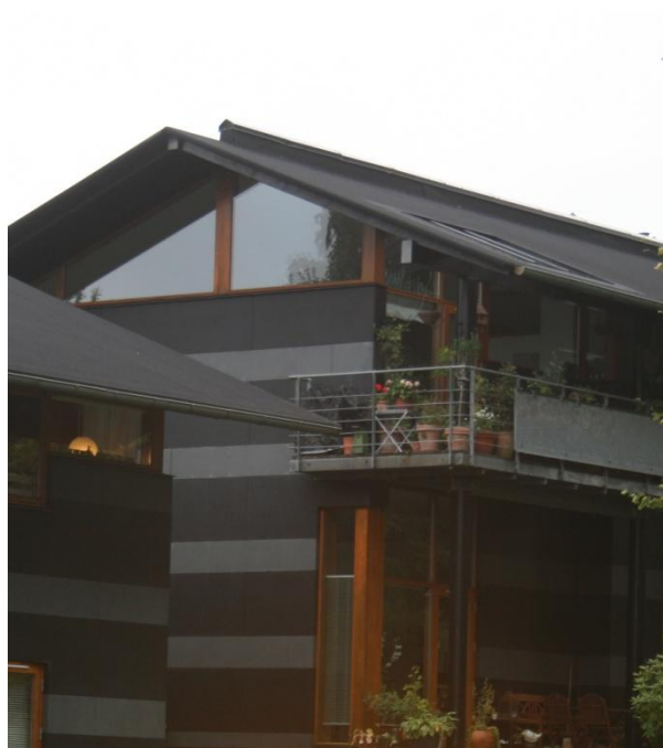
Dianas have, Hørsholm. Tegnestuen Vandkunsten