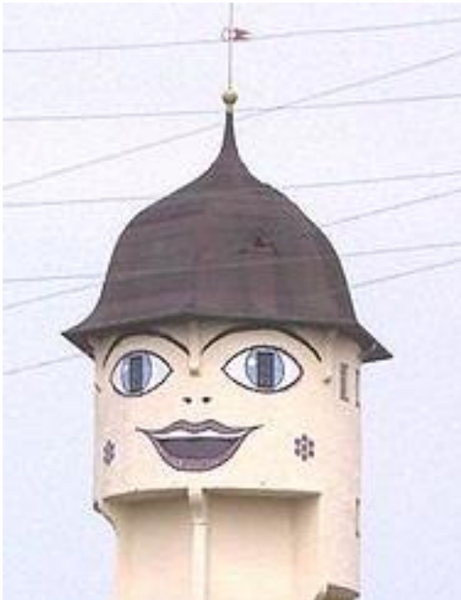
Det smilende vandtårn i Sakskøbing. Tegnestuen Årstiderne