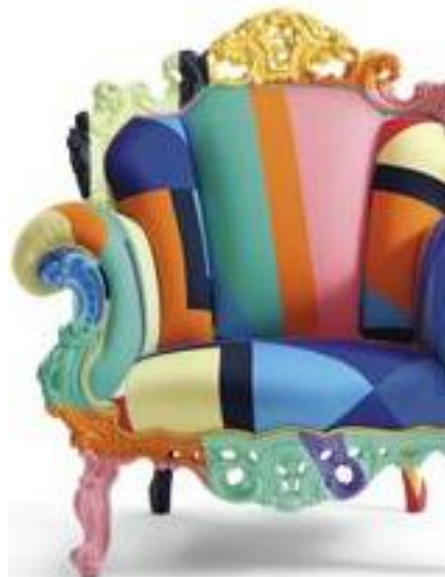
Design Alessendro Mendini