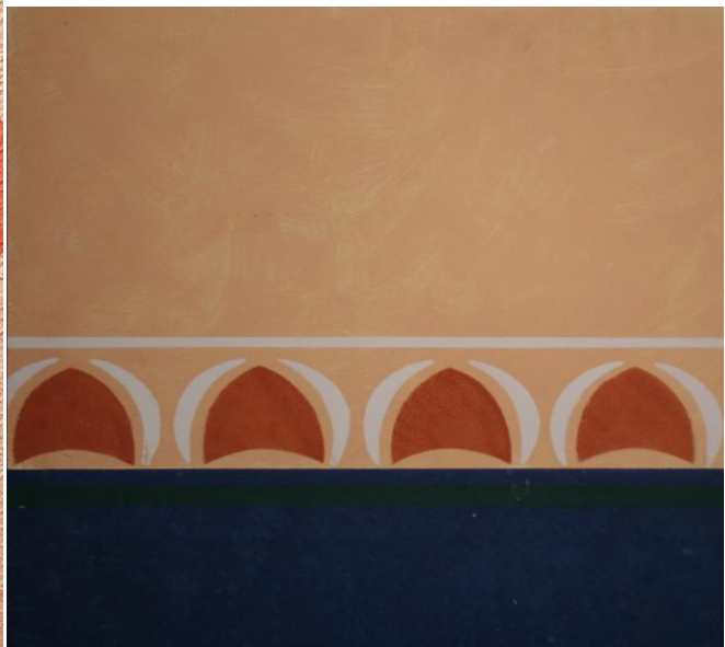
Nederst: Hotel i Tyskland.