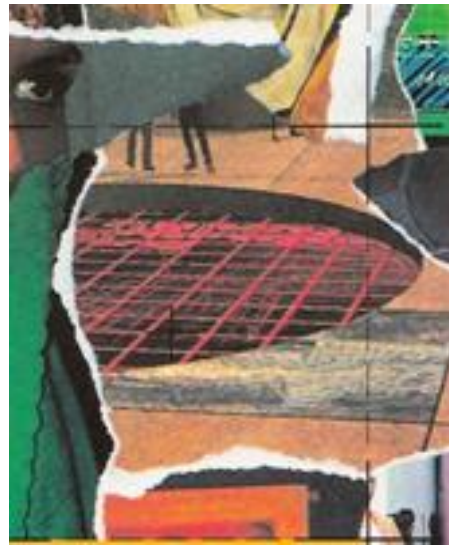
Udsnit af plakat fra Memfisgruppen