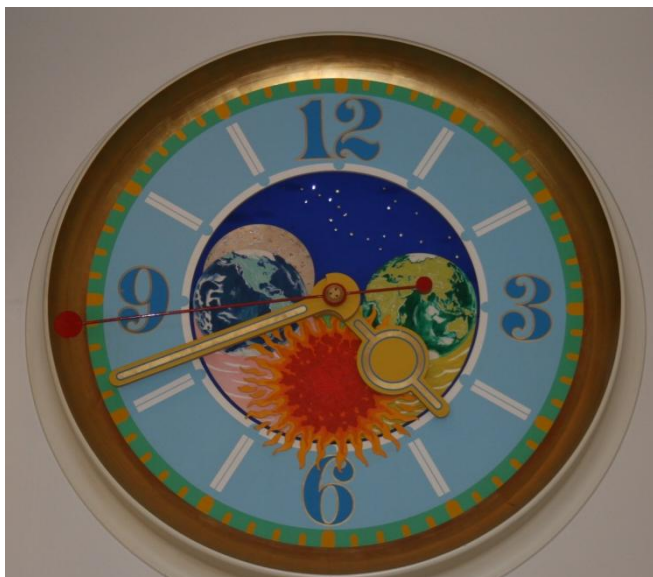
Ur på Herlev hospital

Af internationale designere kan nævnes George Sowden (født 1942) og Alessendro Mendini (født 1931). George Sowden eksperimenterede med former og farver for at bryde med modernismens funktionalitet. Alessendro Mendini udførte luksus design for de få med vægt på betydninger og funktionaliteten blev derfor lavere prioriteret.