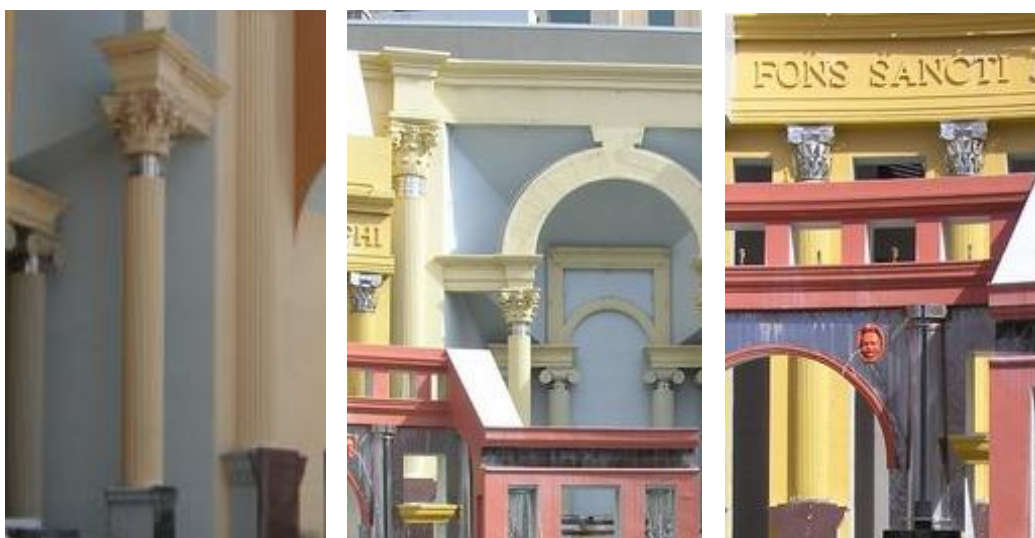
Udsnit fra Piazza d'Italia, New Orleans. Ironisk fortolkning af romersk antik og renæssance. Arkitekt Charles Moore.

I USA var nogle af foregangsmændene arkitekterne Robert Venturi og Charles Moore, der gjorde op med funktionalismens og modernismens kassebyggeri. De byggede bl.a. med forskellige materialer og trak forbindelser til historicismens brug af påsatte søjler og ornamenter for på denne måde at skabe et nyt udtryk.