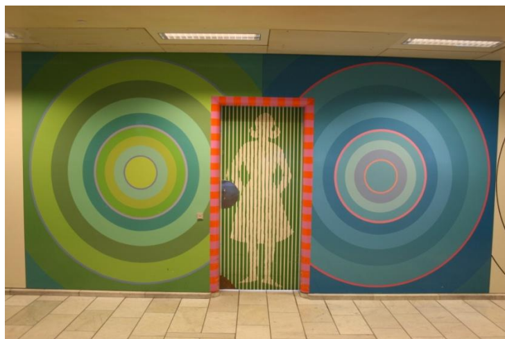
Poul Gernes. Udsmykning på Herlev hospital.