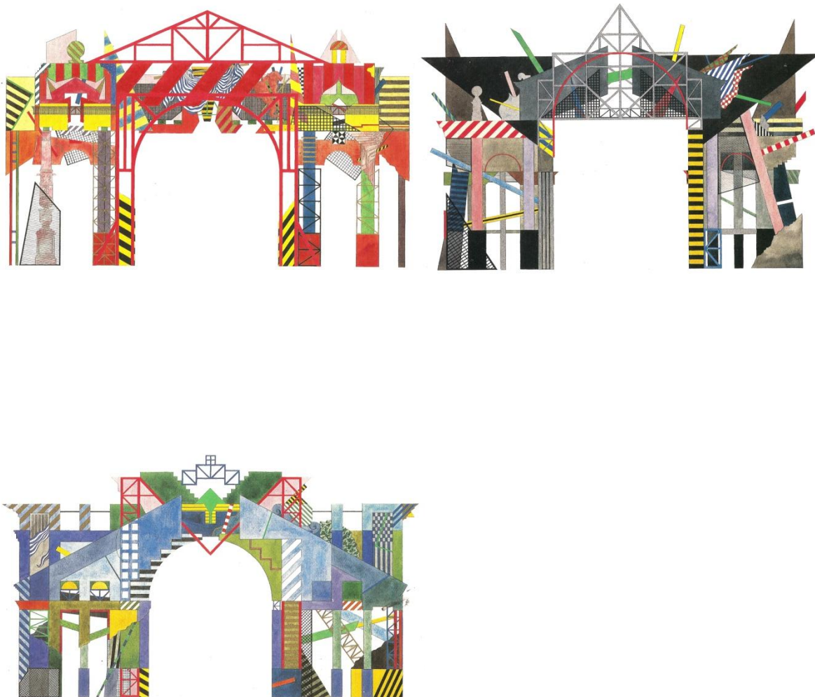
Postkort af Ernst Lohses byporte.

Ernst Lohse (1944 – 1994) var uddannet arkitekt, men bevægede sig et sted mellem arkitekturen og kunsten. Et af de arbejder han er mest kendt for er hans forsøg på at genskabe den gamle tradition med byporte. Lohse udførte nogle midlertidige porte i København (1985), som han blev inspireret til under et ophold i England. Disse porte læner sig op af historicismen med brug af elementer fra antikken arkitektur i et fantasifuldt udtryk. 2 af disse porte blev realiseret og den ene står ved Brandts klædefabrik i Odense. Lohses intention var at bringe sjælen og skønheden tilbage til dagligdagens byggeri.