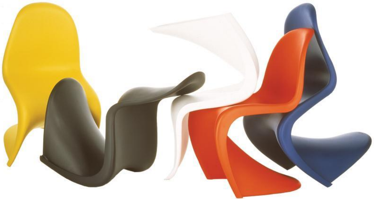
Støbt stol. Design Verner Panton.

Verner Panton (1926 – 1998) var en af de betydningsfulde designere af dansk interiør i postmodernismen. Hans arbejder bar præg af eksperimenteren med nye former og materialer i stærke farver. Plastik, stål og glasfiber var Verner Pantons foretrukne materialer, da disse var formbare.