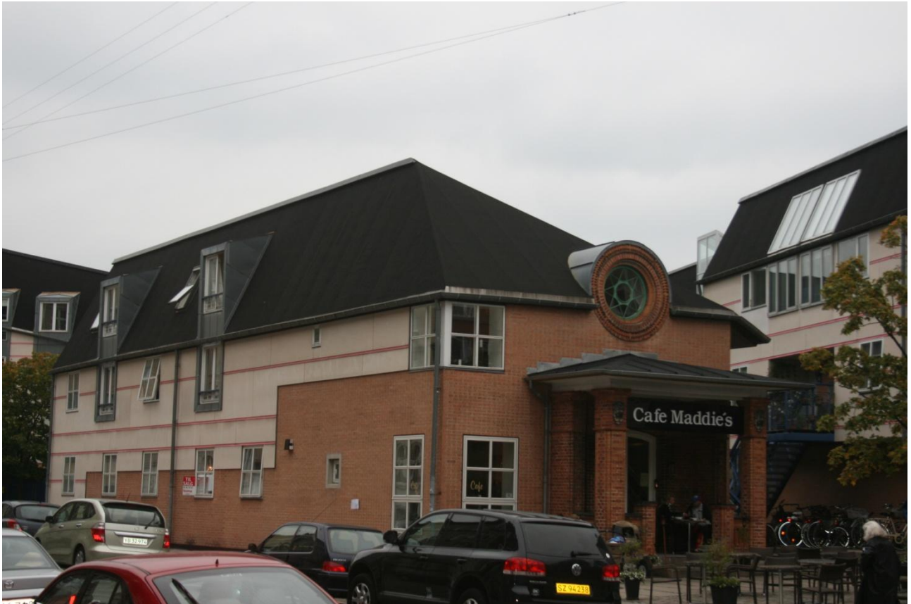
Tæt, lav bolig i København

I takt med økonomi- og energikrisen ændrer arkitekturen sig fra de store og ensartede boligblokke i beton, til nye boliger med tæt - lavt byggeri i form af rækkehuse eller klyngehuse, der var i harmoni med omgivelserne.