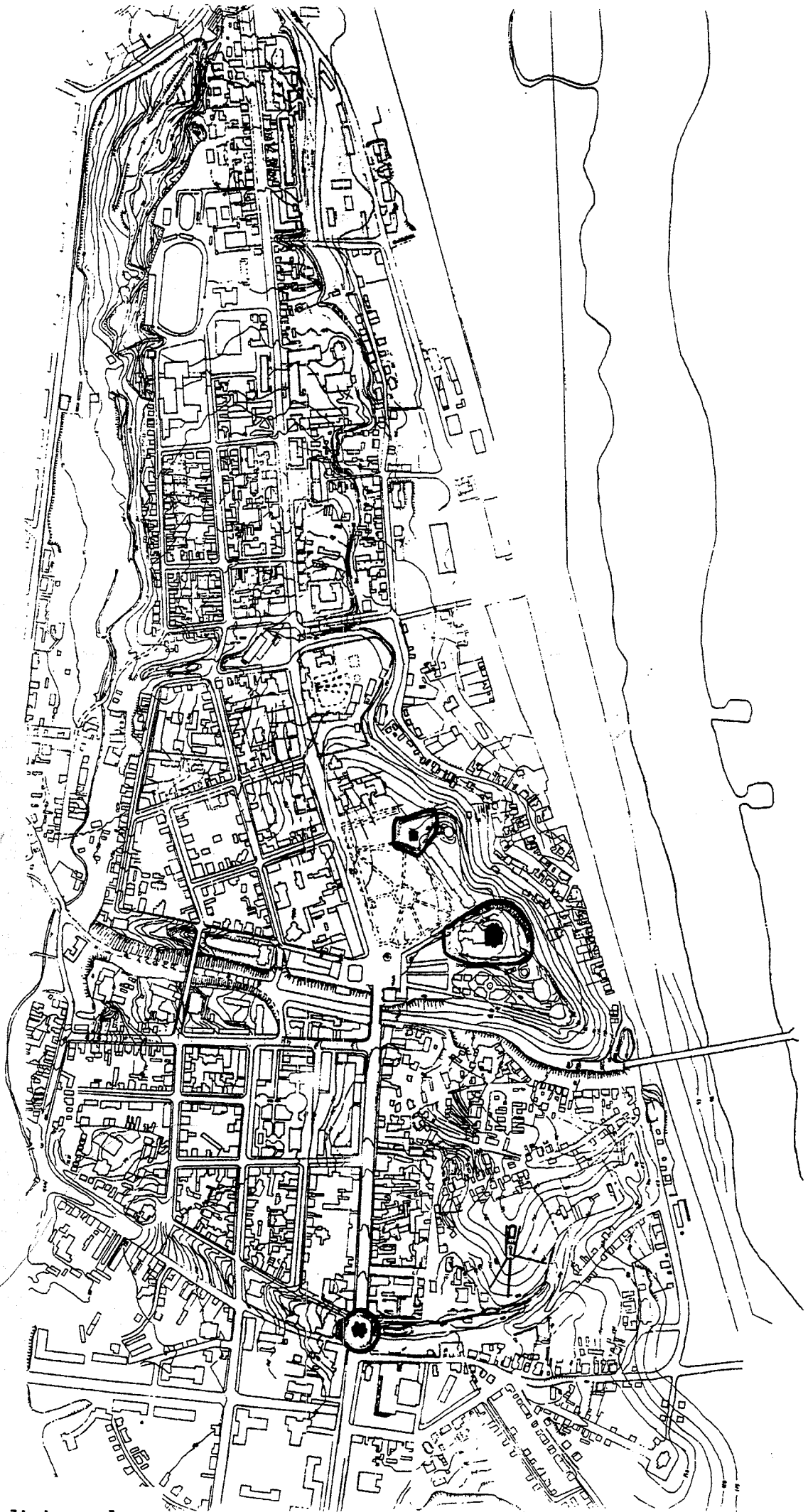
Vladimir : plan